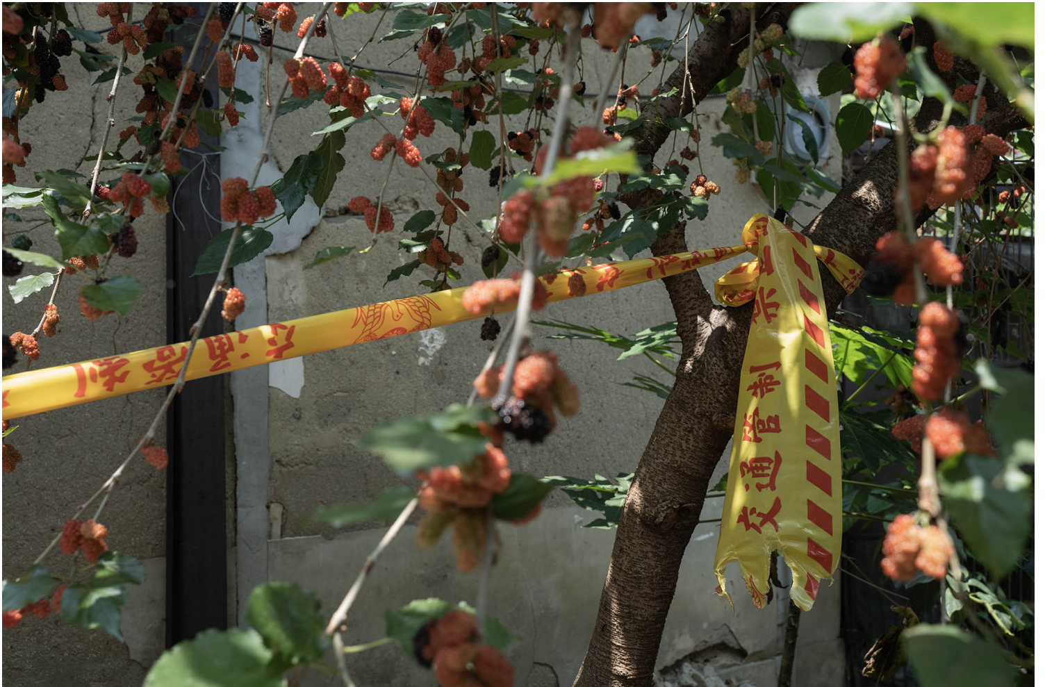
2023年4月10日 台中番仔路庄 房子外掛上封鎖線