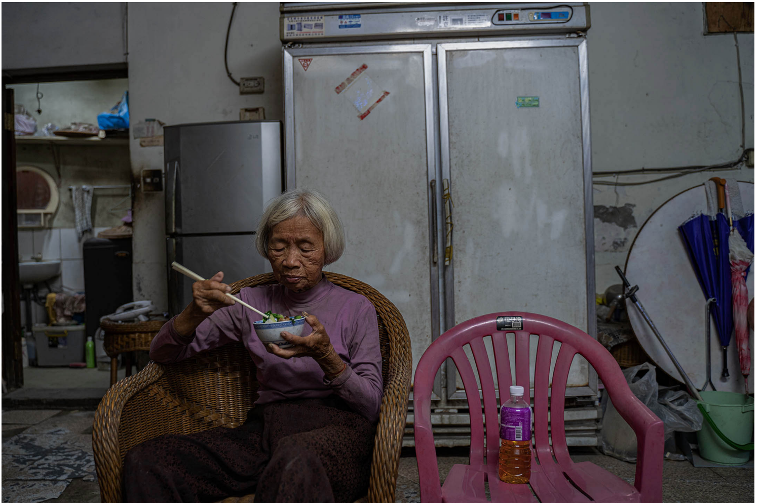
2023年4月9日，台中番仔路庄，居民在家中吃飯。