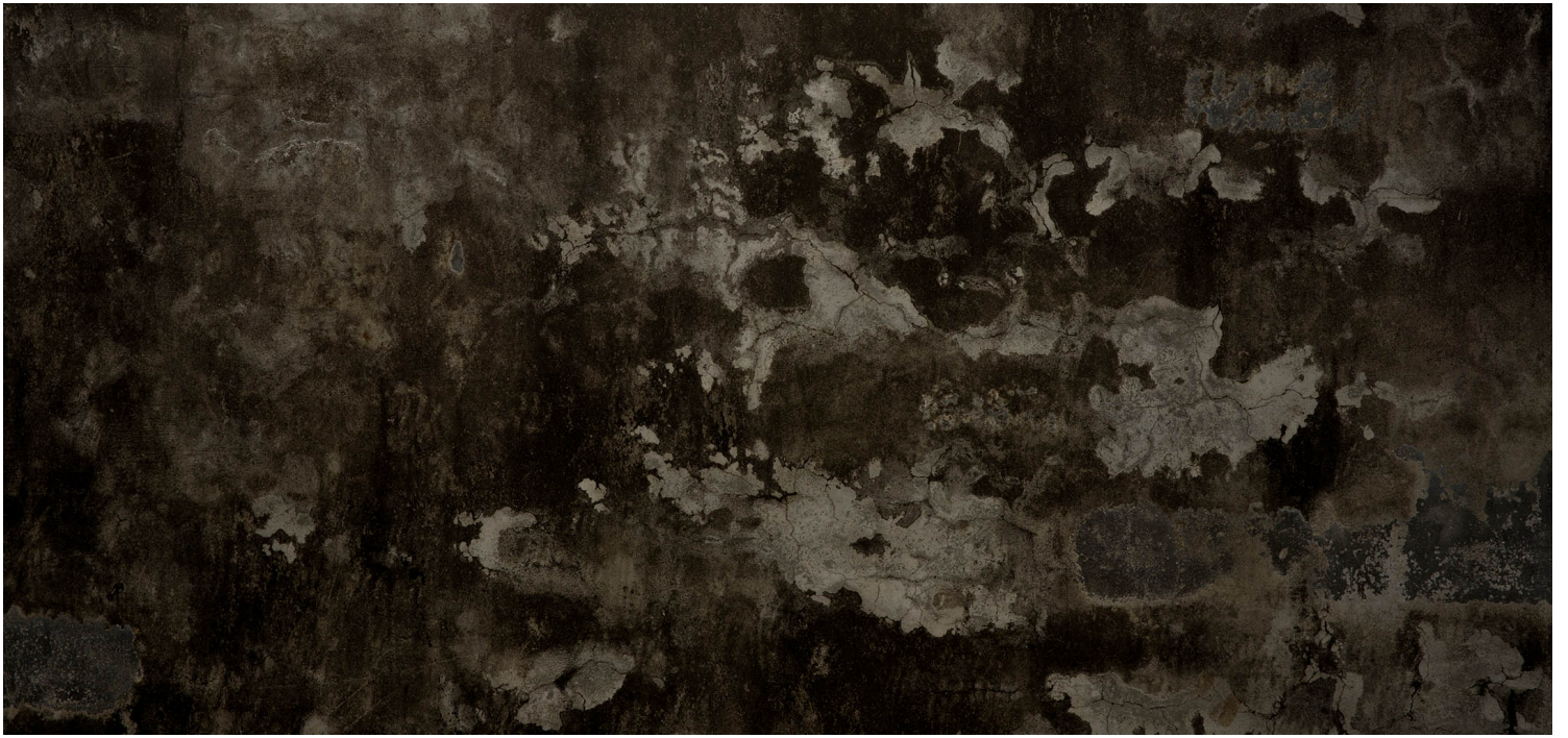
2023年4月9日，台中番仔路庄。