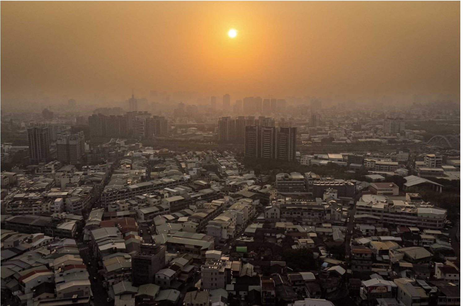
2023年4月14日，位於台中市太平區的番仔路庄。