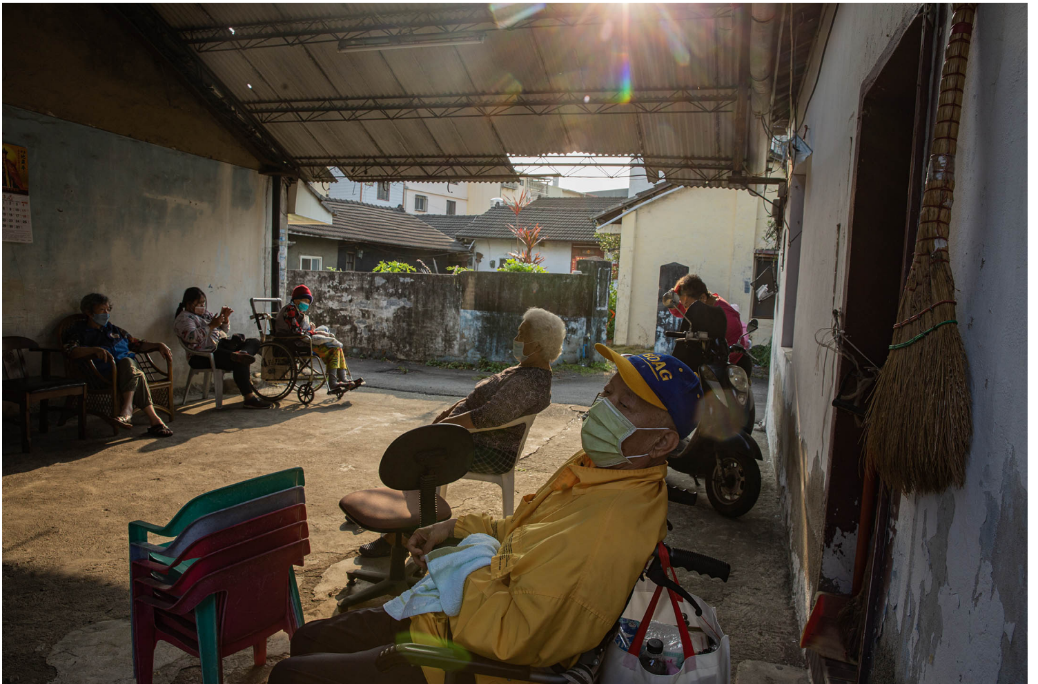
2023年4月10日，台中番仔路庄。