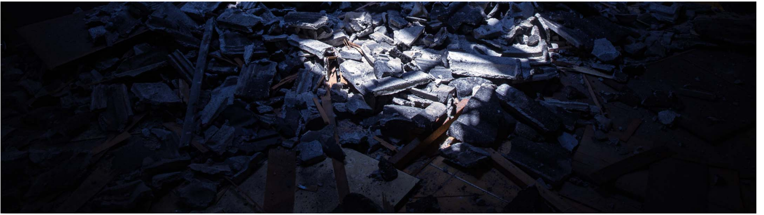
2023年4月10日，台中番仔路庄，房子內的一堆瓦礫。