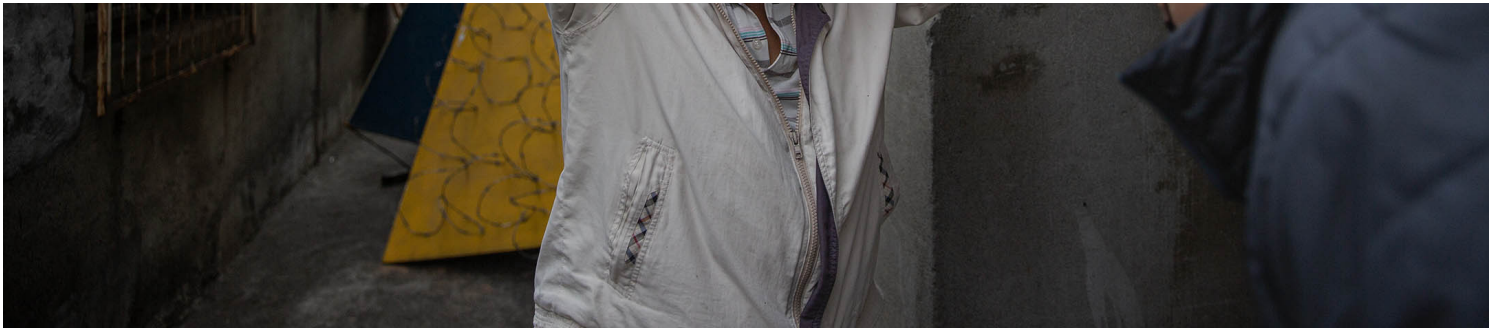
2023年4月10日，台中番仔路庄，居民聚集在面臨清拆的房子前抗議。