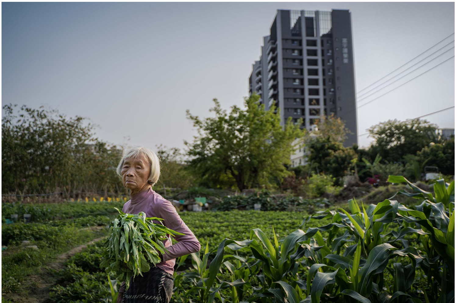
2023年4月10日，台中番仔路庄，居民在田地上種菜。

位於台中市太平區的「番仔路庄」，是都市中少數保有12座閩式三合院與「土角厝」（thôo-kat-tshù）的歷史聚落、庄頭（tsng-thâu）。當地村民大多為清領時期受太平林家招募，在此墾地、修圳的佃農後代。日本殖民時期，村民則透過繳交「稻穀（tshik-á）租」，向林姓地主承租土地以整地、興建房屋，並逐漸形成今日村落的樣貌。如今，村民已是聚落的第五、六代人。但世居其上的土地，卻在這半世紀以來，因為土地開發利益，越發受外人覬覦、上下其手。