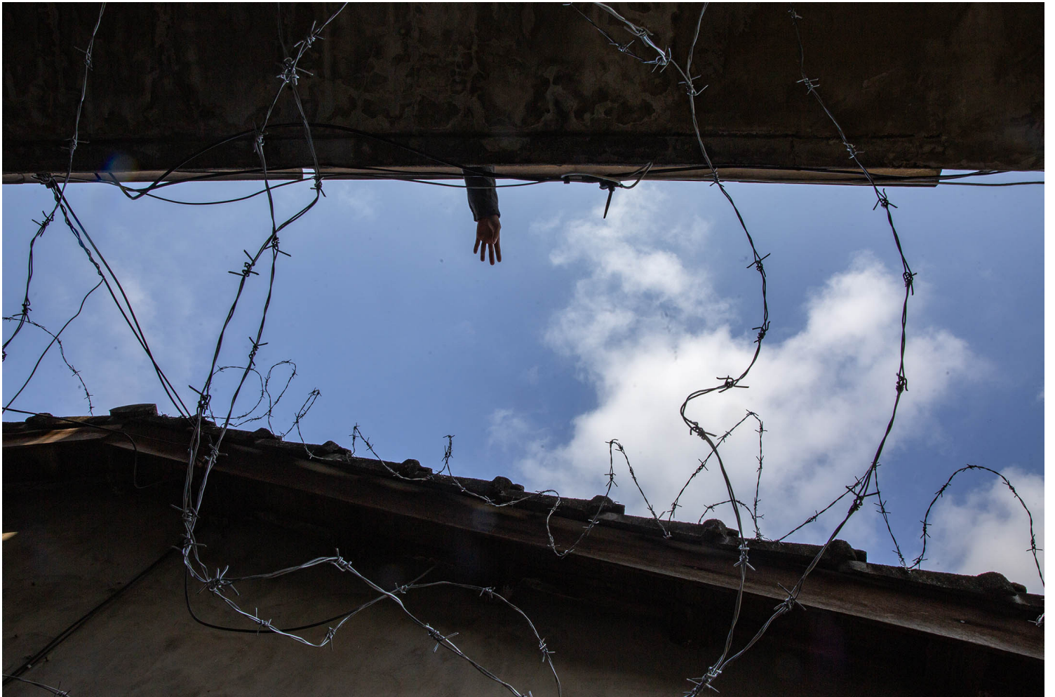
2023年4月10日，台中番仔路庄，示威者站在面臨清拆的房子上。