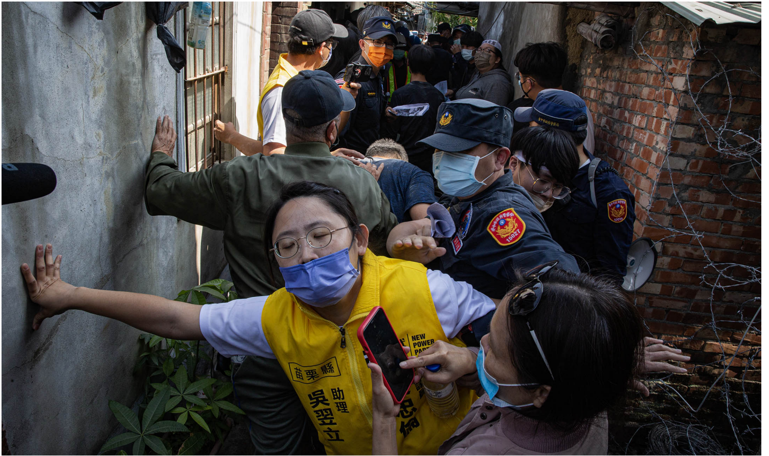
2023年4月10日，台中番仔路庄，示威者與負責清拆的工人及警察推撞。