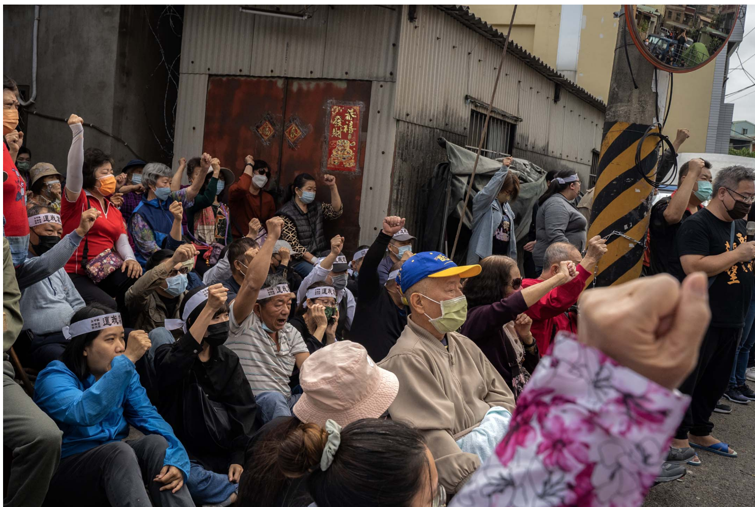
2023年4月10日，台中番仔路庄，居民聚集在面臨清拆的房子前抗議。