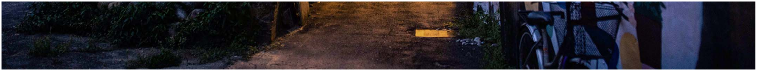
2023年4月10日，台中番仔路庄。