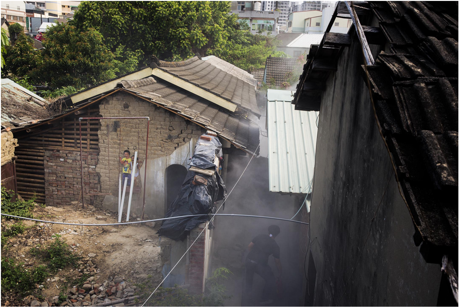
2023年4月10日，台中番仔路庄，示威者聚集在面臨清拆的房子前與警方對峙，期間噴射滅火器。