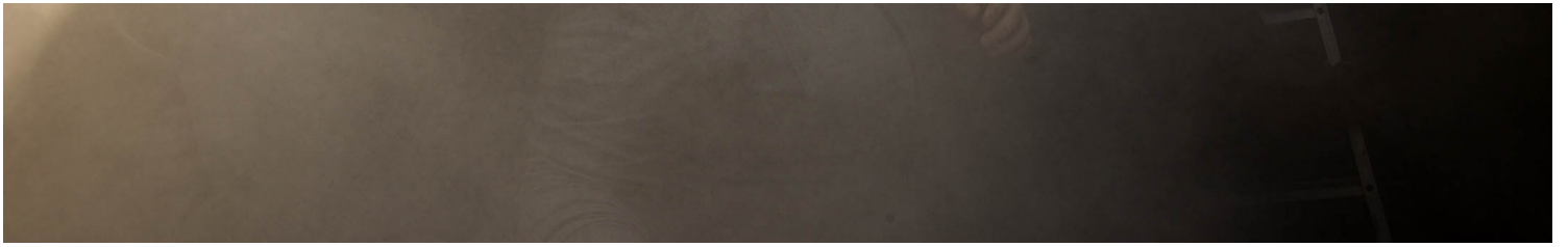
2023年4月10日，台中番仔路庄，示威者聚集在面臨清拆的房子前與警方對峙，期間噴射滅火器。