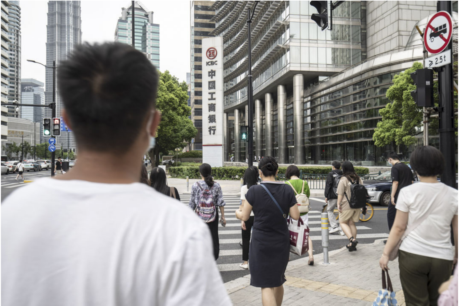
2022年8月26日，中國上海一家工商銀行分行外的市民。