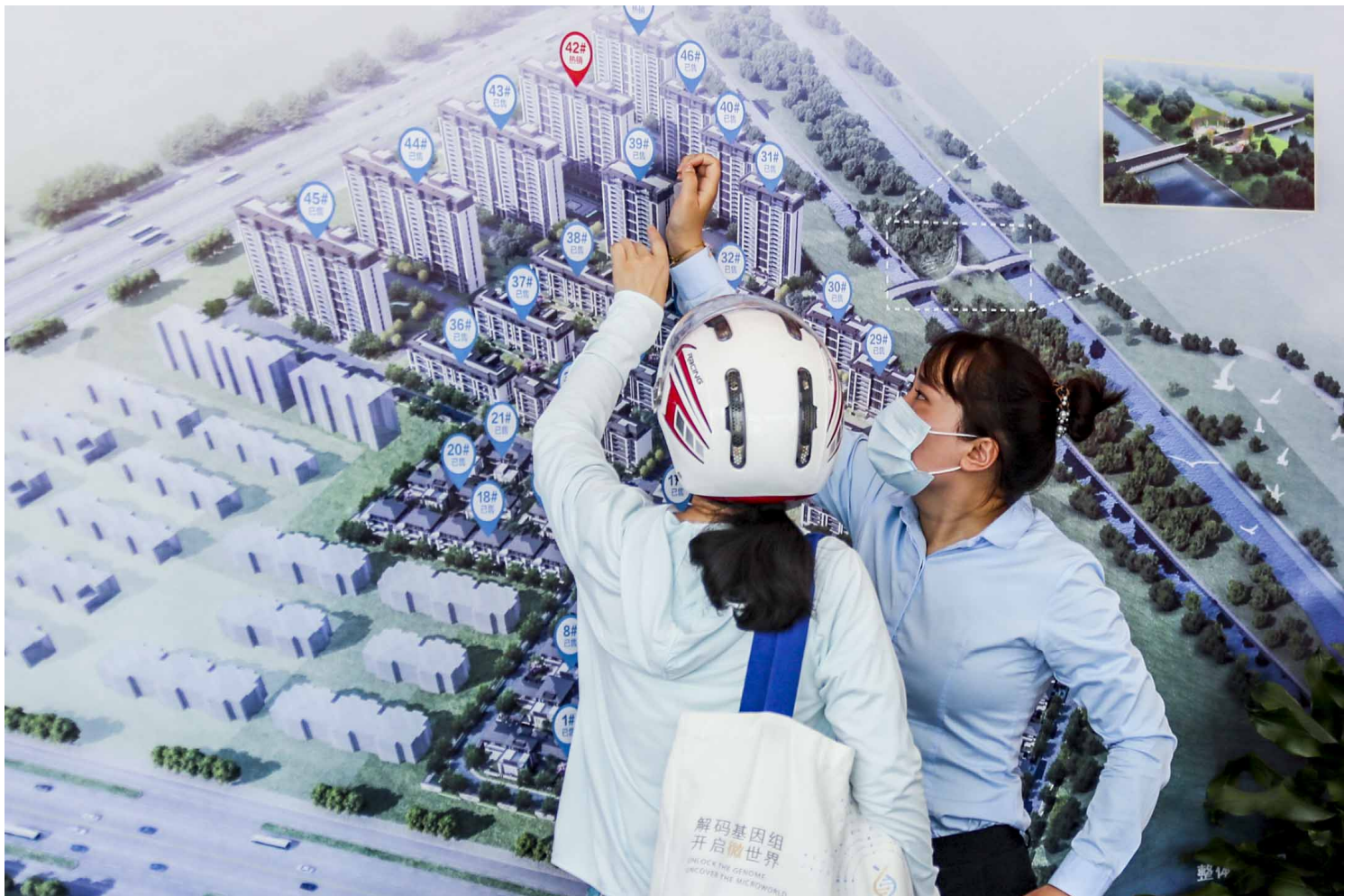
2022年6月18日，中國江蘇，人們在住宅展覽會上觀看示範單位。

這兩年，她為諮詢、買房、借貸、裝修折騰了數趟，償還了十萬的商貸利息，房價卻降了。趙悅一畢業工作即遇到疫情，沒趕上行業的紅利期。現在，每月房貸又是不小的支出，日子過得緊巴巴。再以「投資」的視角看待這套房時，曾經的動力全等加倍轉化成了壓力。