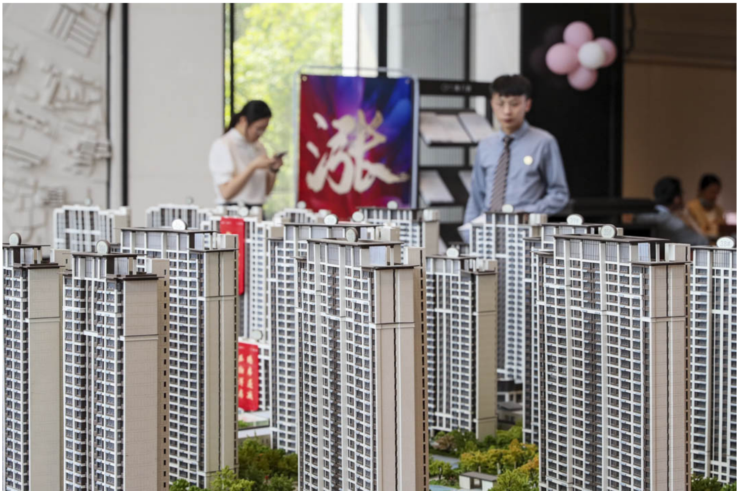
2022年8月3日，江蘇的一個樓盤售樓處，市民在觀看示範單位。

持續觀察一陣，周思涵打定主意，用這些年的積蓄把余下的30萬商貸一次性還清，省下十多萬，讓她免於為未來擔心。但那段時間，中國大陸各個城市還在此起彼伏的封控中，地域之間的流動受到限制。周思涵只能在線上諮詢，由此開始和銀行的拉鋸戰。