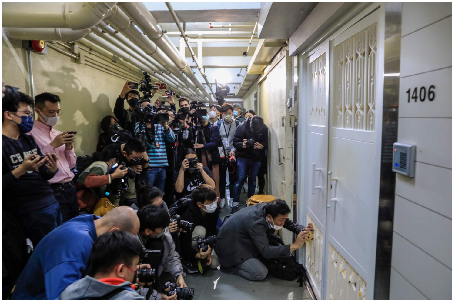
2021年12月29日，大批記者在《立場新聞》位於觀塘的辦公室外拍攝。

總括而言，控方認為文章的被訪者是非法活躍分子、被通緝者，言論針對政權及政治秩序；另一方面也宣揚抗爭行為、港獨及國際戰線等計劃。控方又指，評論作者散播分裂國家思想，指控毫無事實根據，其中包括對警方濫暴、國安法是暴政工具等批評；立場為這些煽動言論提供了平台。