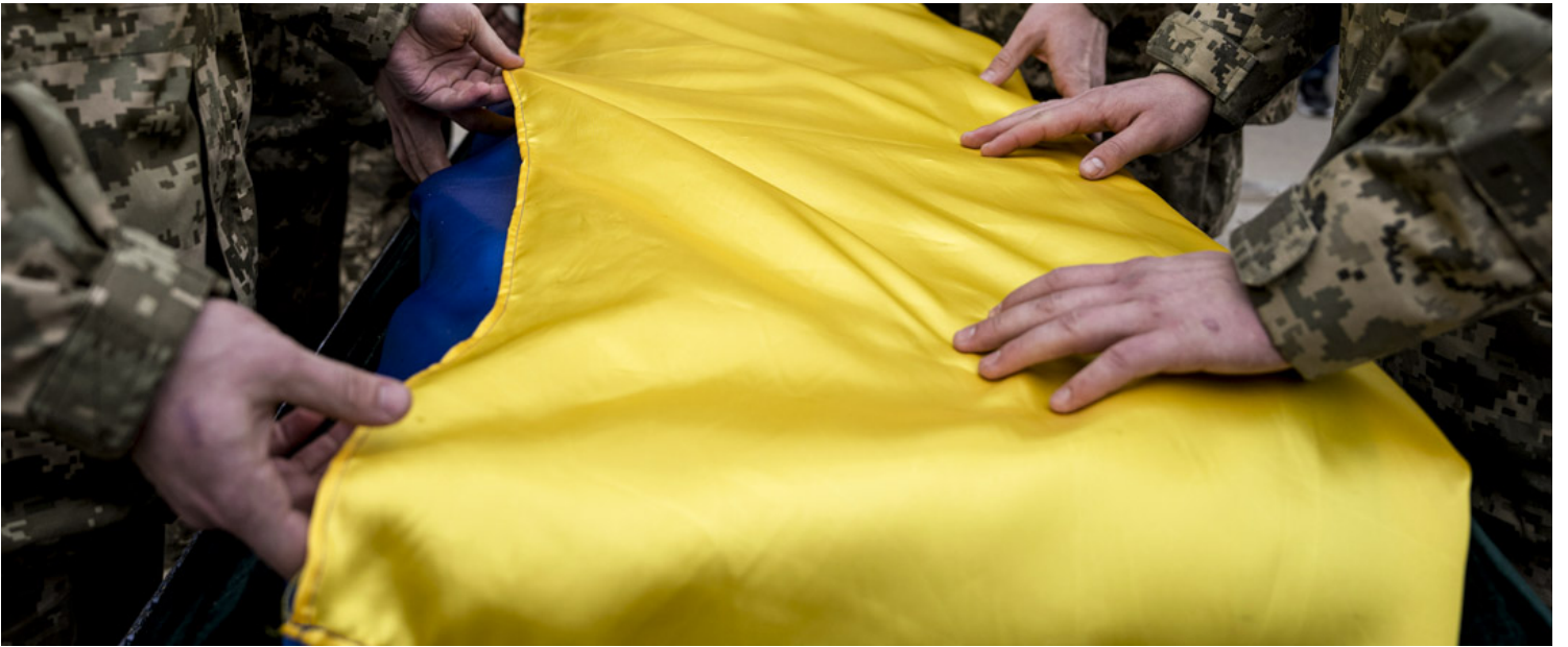
2023年3月25日，烏克蘭基輔舉行的葬禮上，烏克蘭軍人將國旗折疊在逝世軍人的棺材上。

俄羅斯儘管已經傳出向西部調動「古董」坦克，卻也並沒有停戰或者感到疲勞的意思。現在看來，普京並沒有從戰爭初期的失利中吸取教訓，甚至，當前的局勢加強了他對自己判斷的堅定信仰。舉例而言，近日普京發表的 公開演說 中提到歐洲對烏克蘭的支持已經難以為繼，尤其是提到歐洲和美國的工業能力不足以為烏克蘭提供足夠每天使用的炮彈。這意味着他仍然對兩條判斷極為自信。其一，他認為在長期作戰中俄羅斯仍然大有希望；其次，他對西方「墮落」的總體判斷仍然存在，包括看不起西方的工業能力和援助烏克蘭的決心。