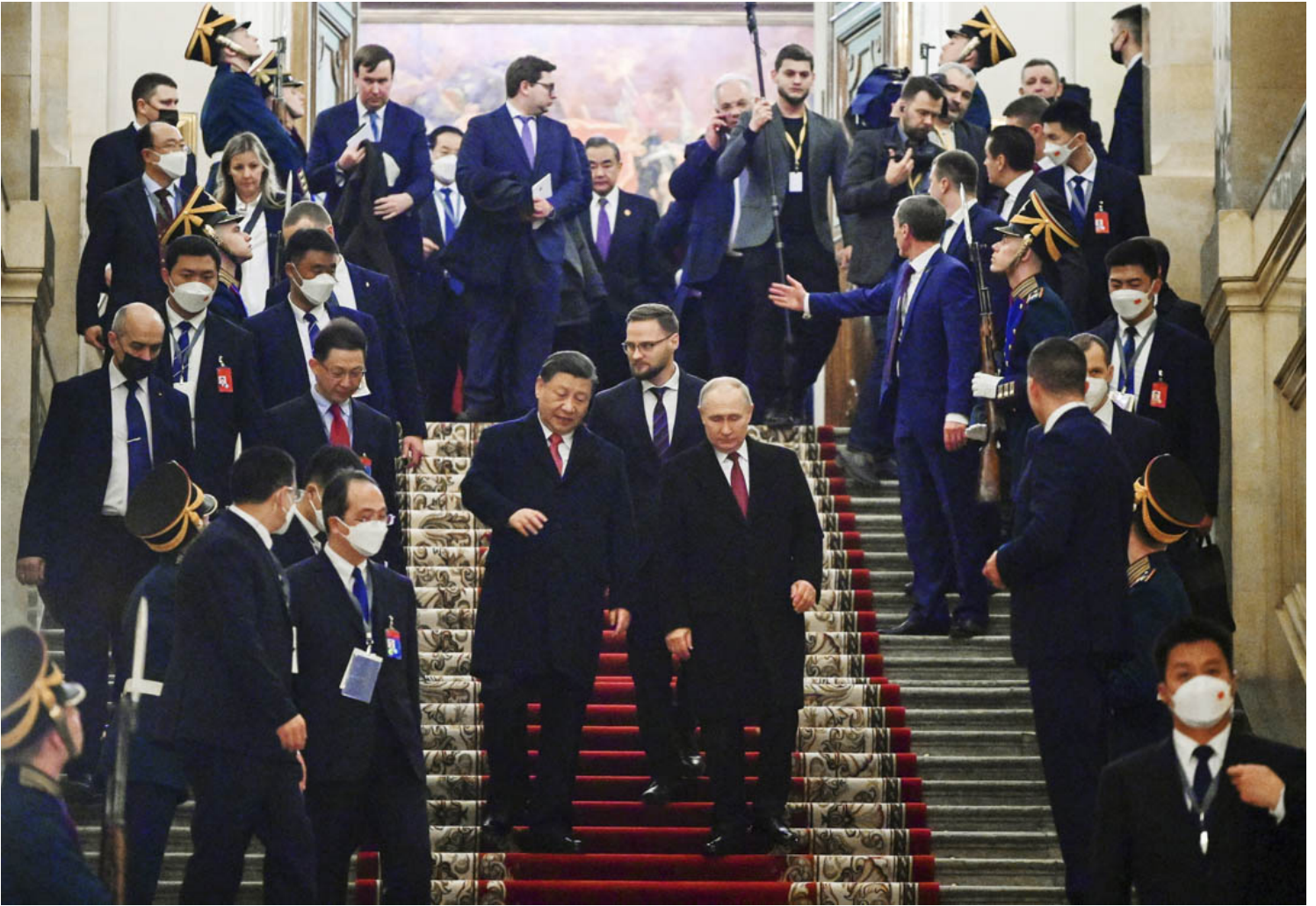
2023年3月21日，俄羅斯莫斯科克裏姆林宮，俄羅斯總統普京和中國國家主席習近平出席招待會後離開。

2023年和2022年唯一的不同，也許就是前中國外交部長王毅以如今政治局委員和中央外事辦主任的身份在習近平訪俄之前再次會見了烏克蘭外長庫列巴。這是至今為止最高級別的中烏官員會談。這樣級別的會談當然存在着為兩國領導人會面鋪路的可能性。但這同樣也可以理解為某種試探——看看彼此雙方領導人想通過會談提到、認可什麼，如果談不攏，那就再放着。畢竟，北京對烏克蘭的需求一向不高，甚至可以說，北京高層要是能認識到烏克蘭並非西方傀儡，都已經算是非常重大的認知調整了。因此，如果習近平-澤連斯基會談最終沒有出現，人們也不必過多驚訝。