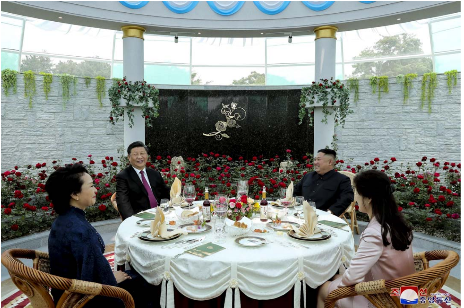
2019年6月21日，中國國家主席習近平與北韓領導人金正恩在平壤出席午餐會。

儘管習時代一直堅稱要建設「人類命運共同體」，也希望在各種國際問題中扮演更積極的角色，但是一些圍繞中國周邊，對北京影響更大的議題上，中國的斡旋外交併不出色。