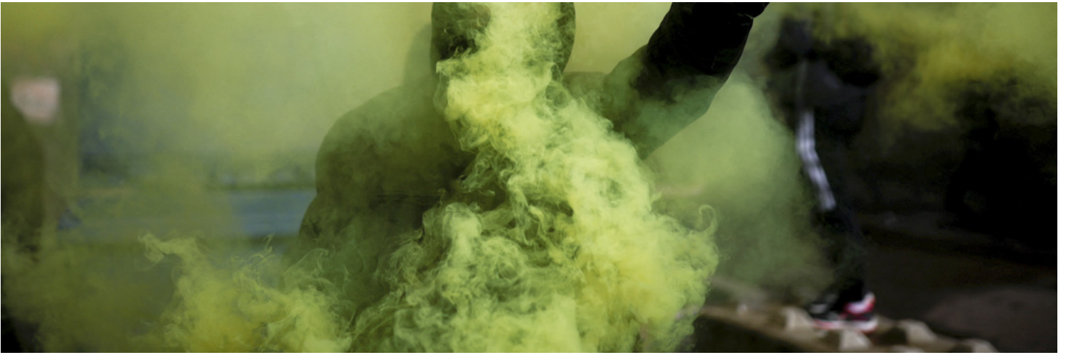
2023年3月18日，法國南特，法國養老金改革的示威抗議。