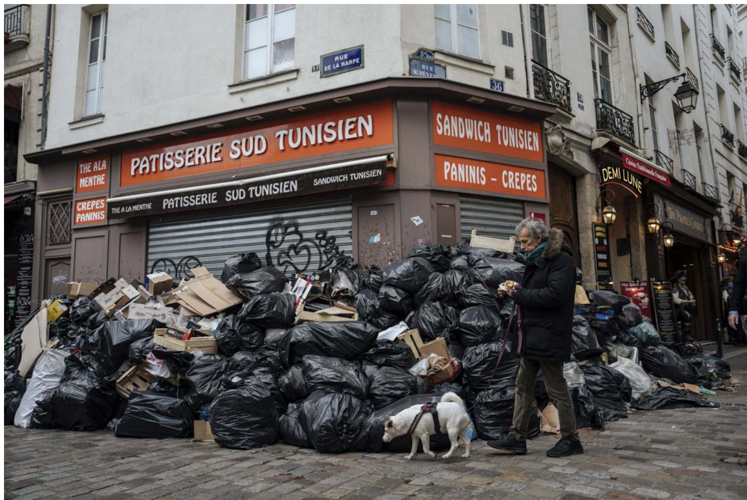
2023年3月13日，清潔工罷工期間，一名男子走過巴黎堆積的垃圾。

除了人口結構轉變，法國的經濟危機亦令退休金問題漸趨嚴重。二戰結束後歐洲經歷急速經濟復甦，當時民眾亦處於充分就業狀態，勞動力充足，退休人口又較少，故退休金系統負荷不大。然而，自1980年代起，法國失業率大增。後來2008金融海嘯更為法國經濟蒙上一道陰影，2012至2014年的國民生產總值每年增長不到0.5%，收入增長停滯不前。雖然法國經濟於2020年疫情爆發期間展現韌性，2021年經濟增長達到歷史性的7%，但俄烏戰爭於2022年爆發，令法國再面臨另一場經濟考驗。這亦令退休勞工變得更為依賴退休金。