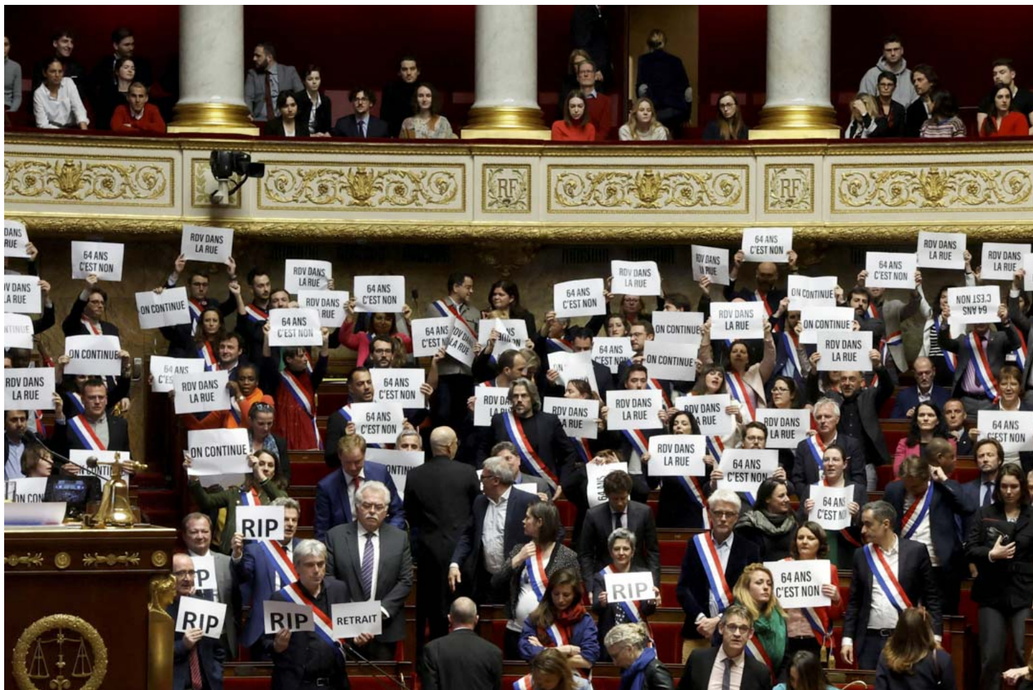
2023年3月20日，巴黎，法國國民議會，中間派團體Liot已提出一項多黨不信任案，左翼的議員在表決後舉起標語。

誠然，除了提高退休年齡以減少支出，法國政府亦能透過增加稅收減低赤字。採取「開源」方案亦能避免馬克龍觸及延長退休年齡這敏感議題，激怒基層民眾。然而，法國稅收於歐洲已算偏高。根據經濟合作暨發展組織（OECD）數據，於2021年，法國稅收占國內生產總值為45.1%，為38個國家中排名第二，而OECD國家平均數值僅為34.1%。法國若想以提高稅收解決退休金問題，恐怕只會增加社會負荷，或者招來上流社會強烈反對。這只會造成另一場階級爭議，促成社會撕裂，故增加稅收以支持退休金系統亦並非可行選項。開源既不可行，節流亦不受歡迎，馬克龍執意推行改革亦難以逃離陷入兩難的局面。