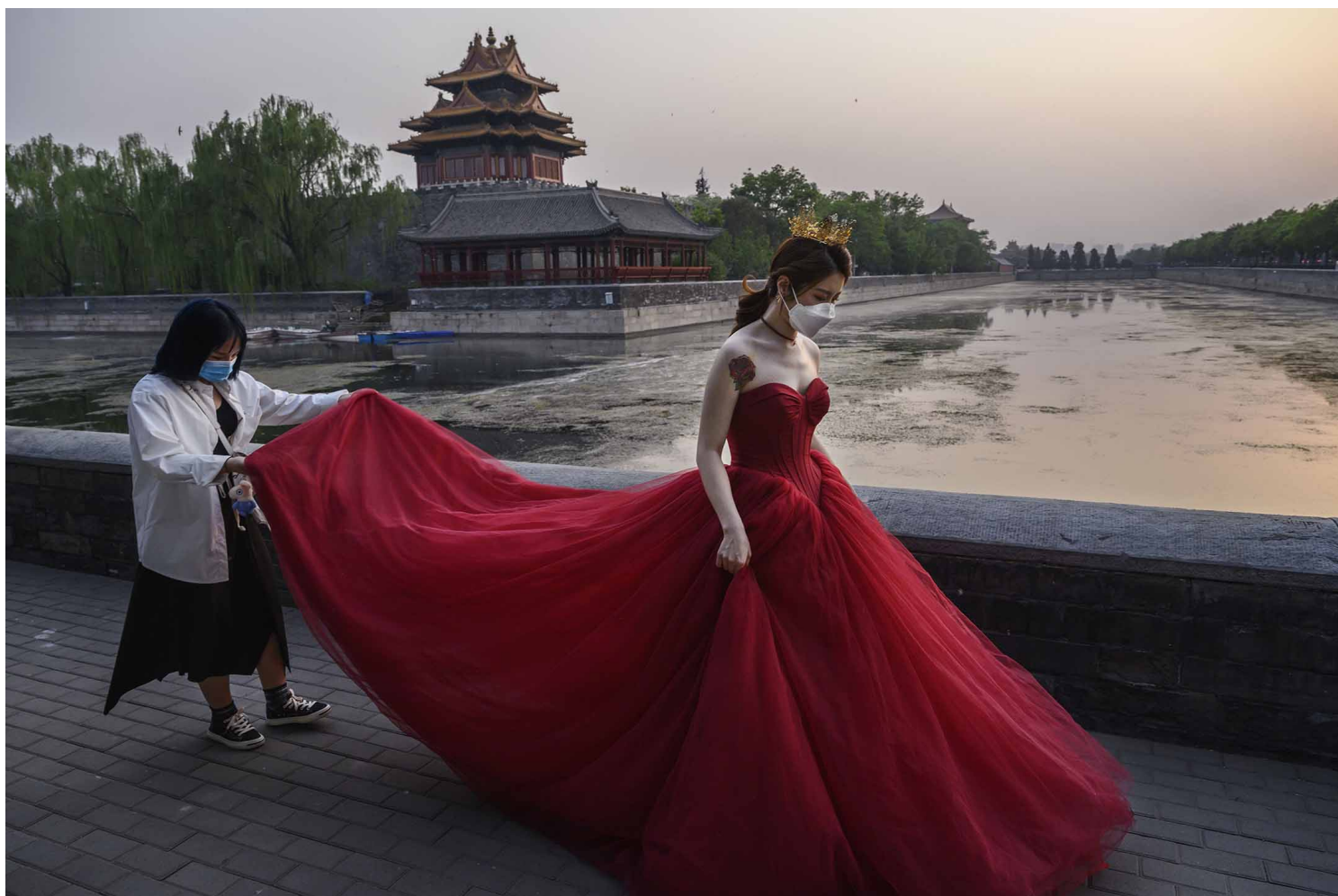
2020年4月30日，北京，一名中国妇女在紫禁城外拍婚纱照。

同样是《涉渡之舟》开篇，戴锦华称，“诸多历史文献与统计图表可以印证：迄今为止（指新中国成立后），中国仍是妇女解放程度最高、女性拥有最多的权利与自由的国度之一。”此书出版于2002年，她本人在后记中称，文章大部分完成于1994年前。但1994年的中国，参考国际通用标准：经济参与和机会、教育程度、健康与生存（溺杀女婴）、政治赋权（即女性参政比例）等因素，中国妇女的地位排名132，中国妇女远没有达到戴锦华“解放程度最高，最多权利、最自由”的状况。这些论述与戴锦华对革命运动是对中国妇女的“赐予”之说一起，倒是如实地反应观点持有者自身的姿态和其所在的关于性别、民族和国家的意识形态座标象限，以及这些交叉变量一旦存在冲突时，她的优先排序何在。性别叙事服务于国家民族和意识形态的论述，这的确倒让她有落入了“粉红女权”这一分类中。