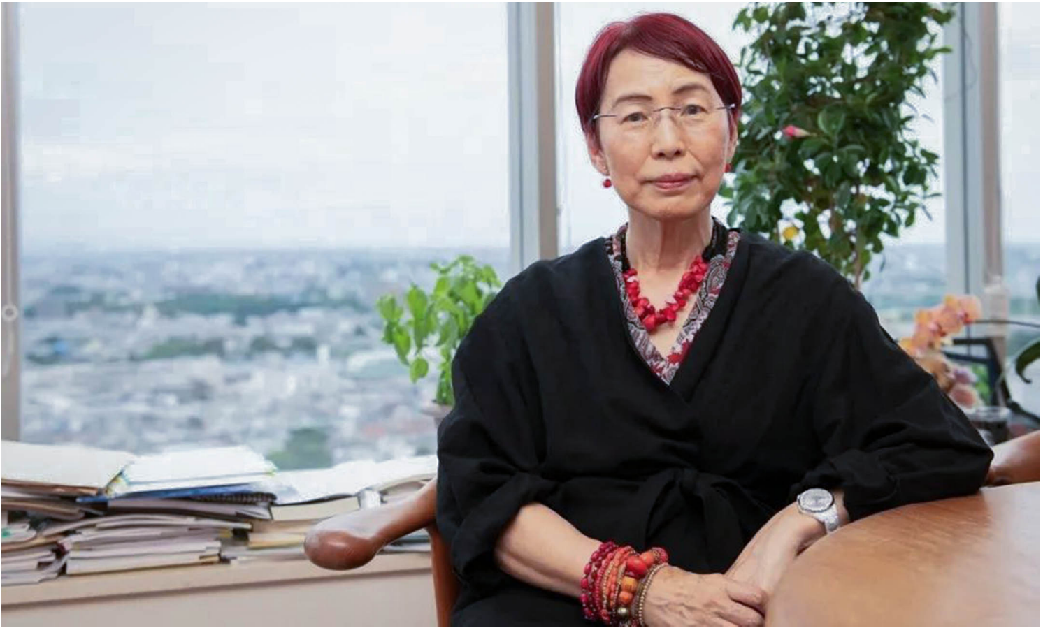
上野千鹤子。