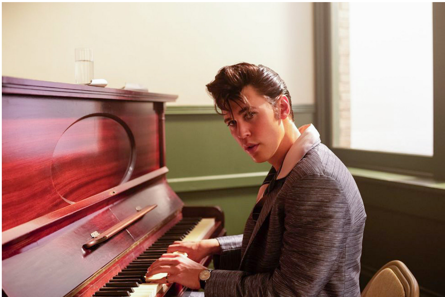
《猫王艾维斯》剧照。

因为没有这种深入，即使是一个人的生命的陨灭，也没有好莱坞传统战争电影那种沉甸甸的质感，则更多的只是一种礼貌性的概念上的喟叹。