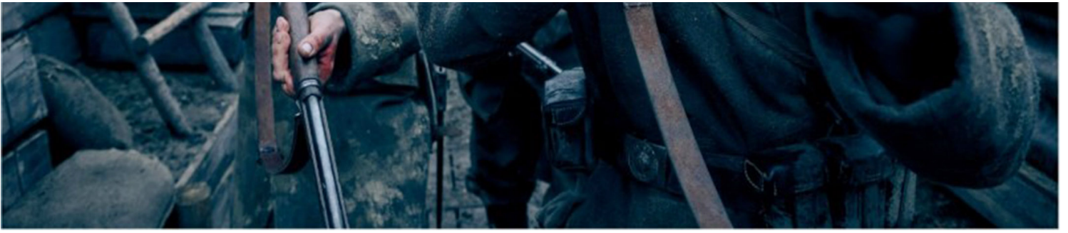
《西线无战事》剧照。