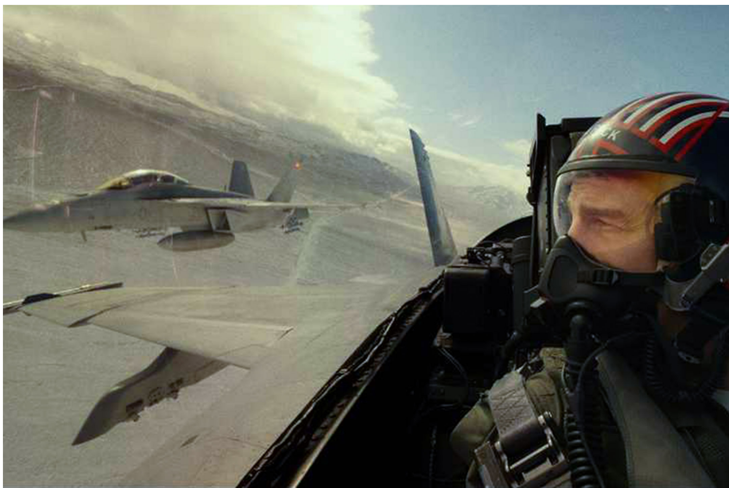
《捍卫战士：独行侠》剧照。

影片如此轻盈和精确的抓住了人在当下的某种困境，不动声色而又略带讥讽同时又饱启悲悯地描述了我们人类另一种永远无法解决的争斗。在今年的奥斯卡最佳影片提名中，无论是思想的穿透力还是对于形式与内容的微妙平衡都是一流的。