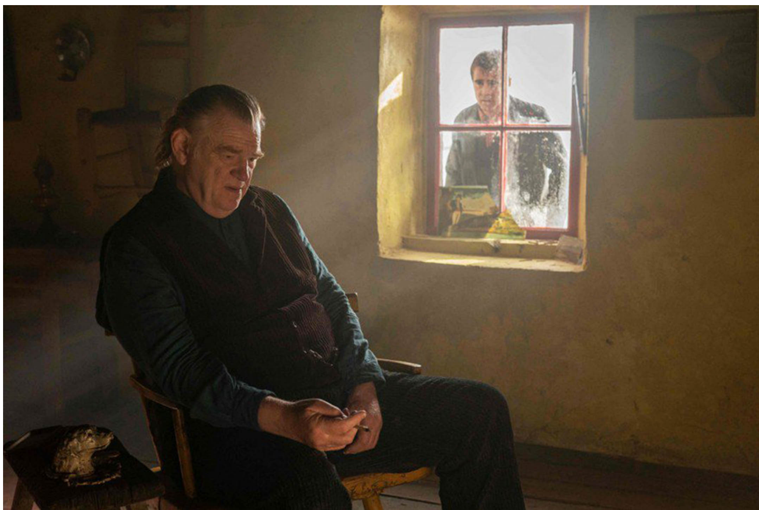
《伊尼舍林的报丧女妖》剧照。

奥斯卡这个奖，除了近年以政治正确带领主旋律，其实还是一直偏爱具有“阿甘”精神的电影？