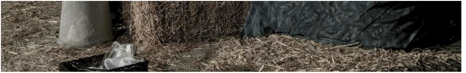
《女人悄悄话》剧照。