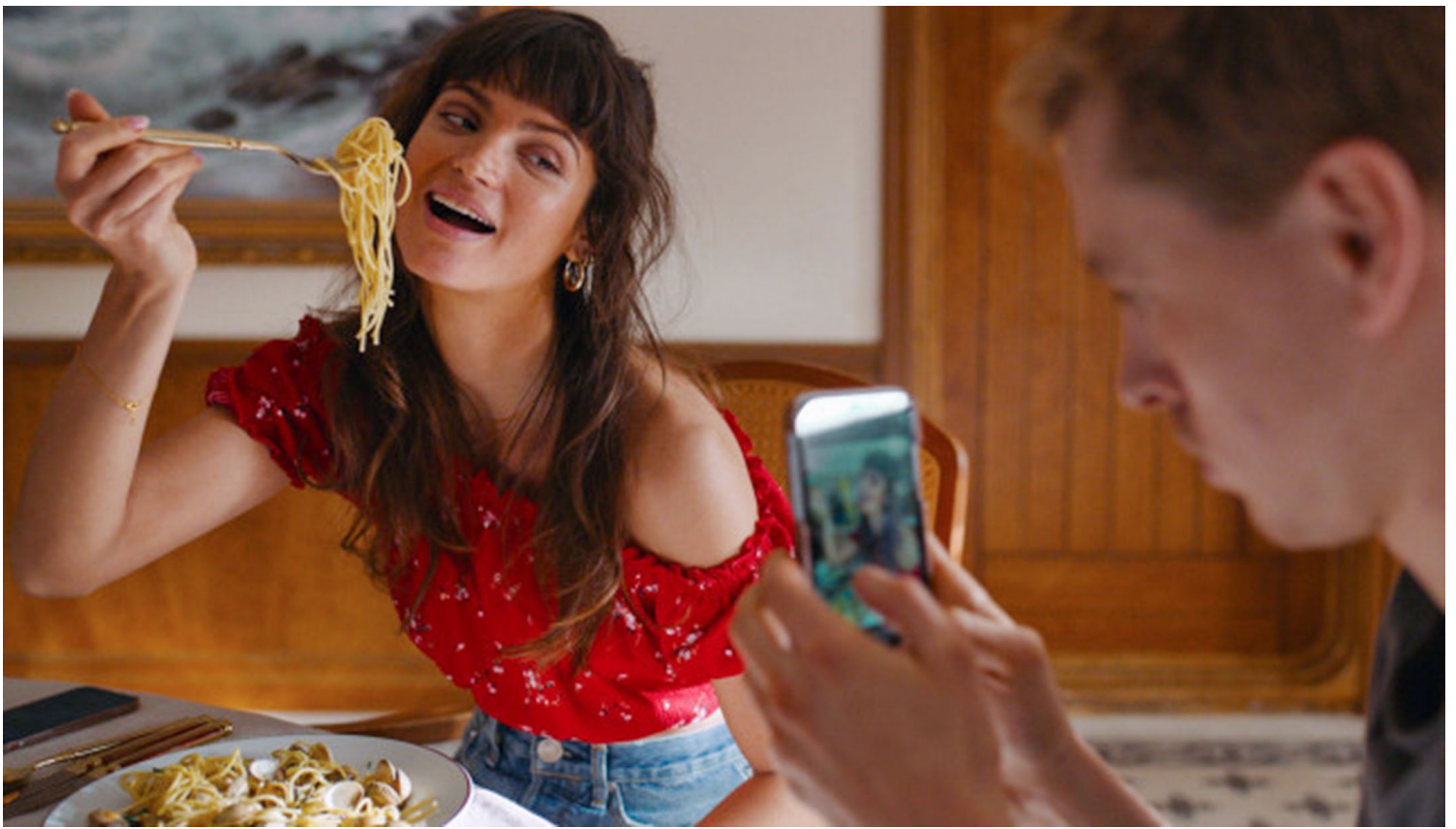
《上流落水狗》剧照。