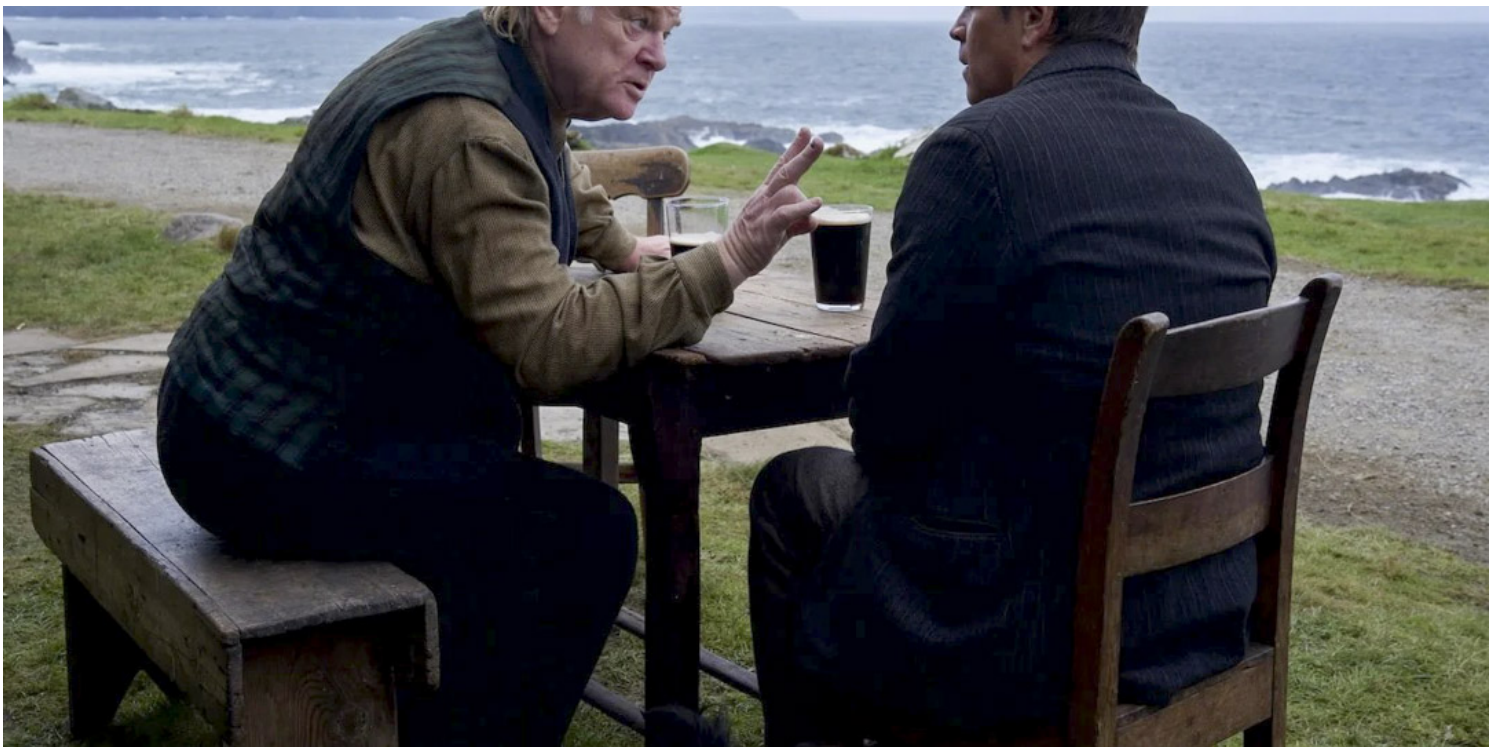
《伊尼舍林的女妖》剧照。