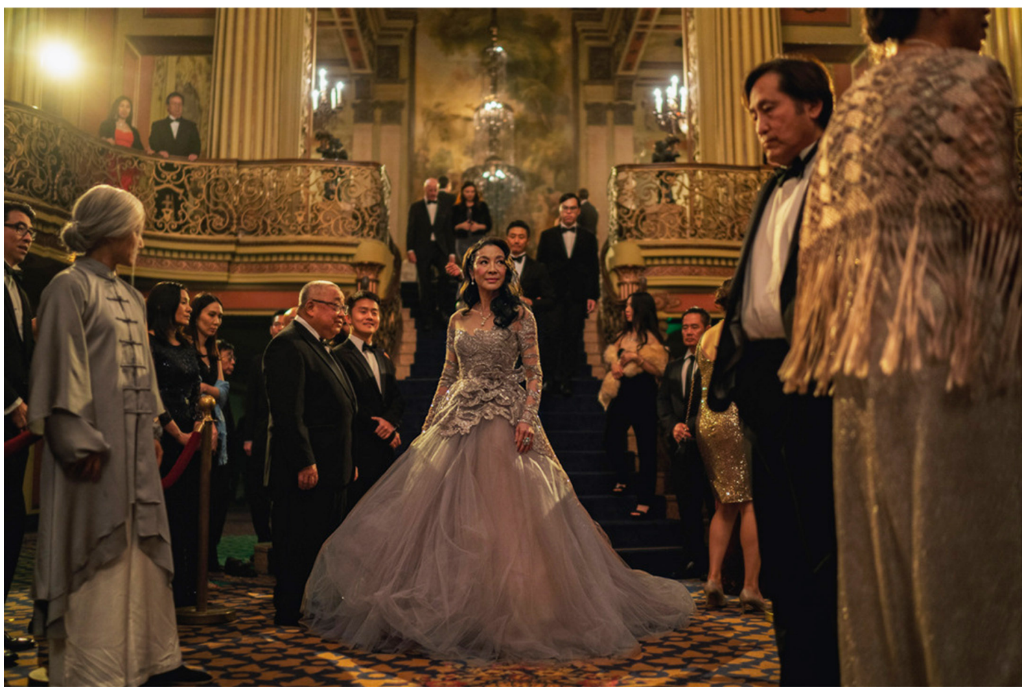
《奇异女侠玩救宇宙》剧照。

相较其他更工整作品，《妈的多重宇宙》更多是用视觉和想象力遮盖了剧本和逻辑上的诸多问题？