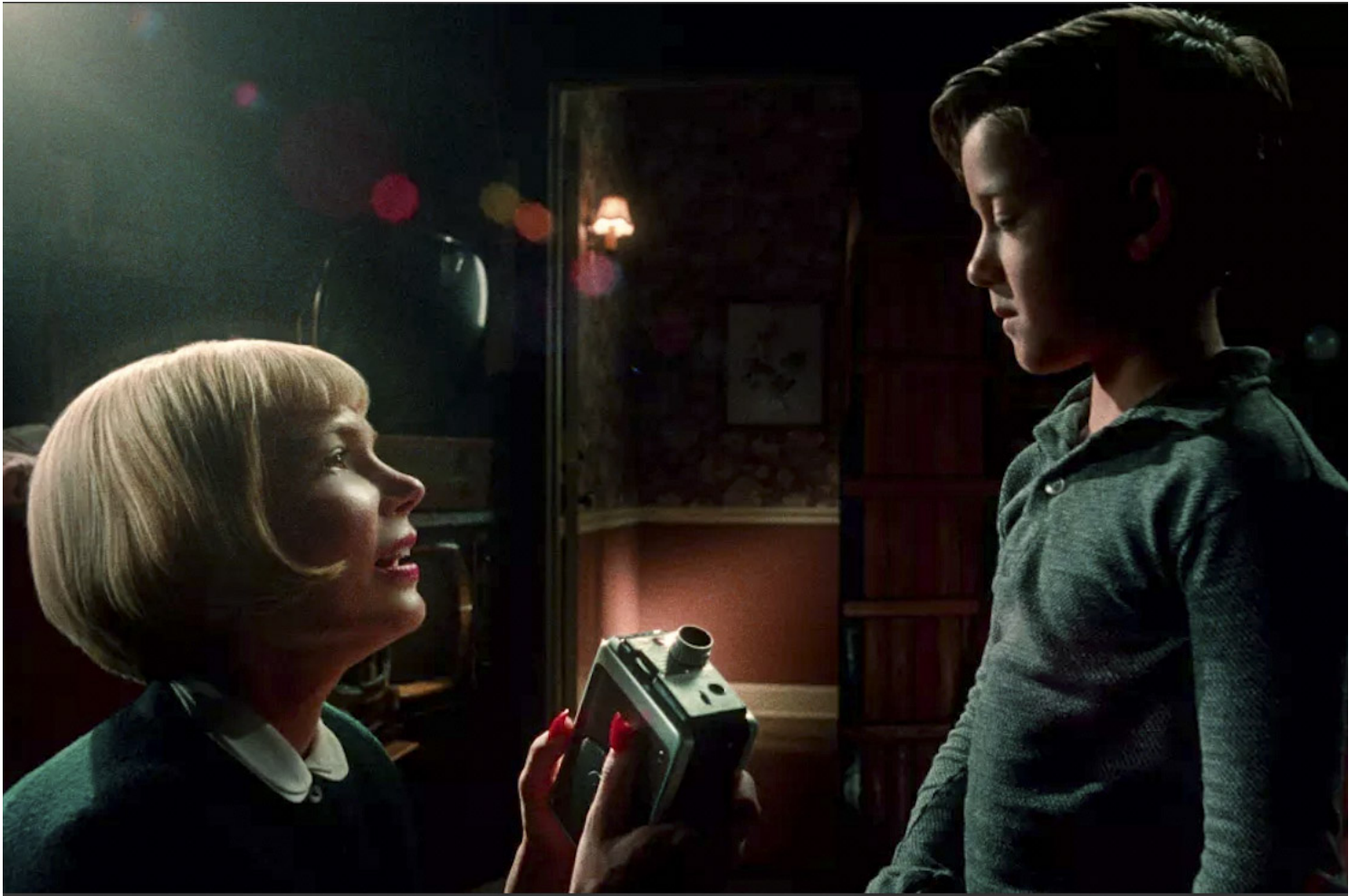
《法贝曼：造梦大师》剧照。

此外，他们的导演风格以天马行空的想象和幽默恶搞为主题，在导演奖的评奖标准和通常注重严肃工整的学院派风格并不相符。总之应该是最佳影片的热门人选，但我认为还不足以扛起最佳导演这座奖杯。