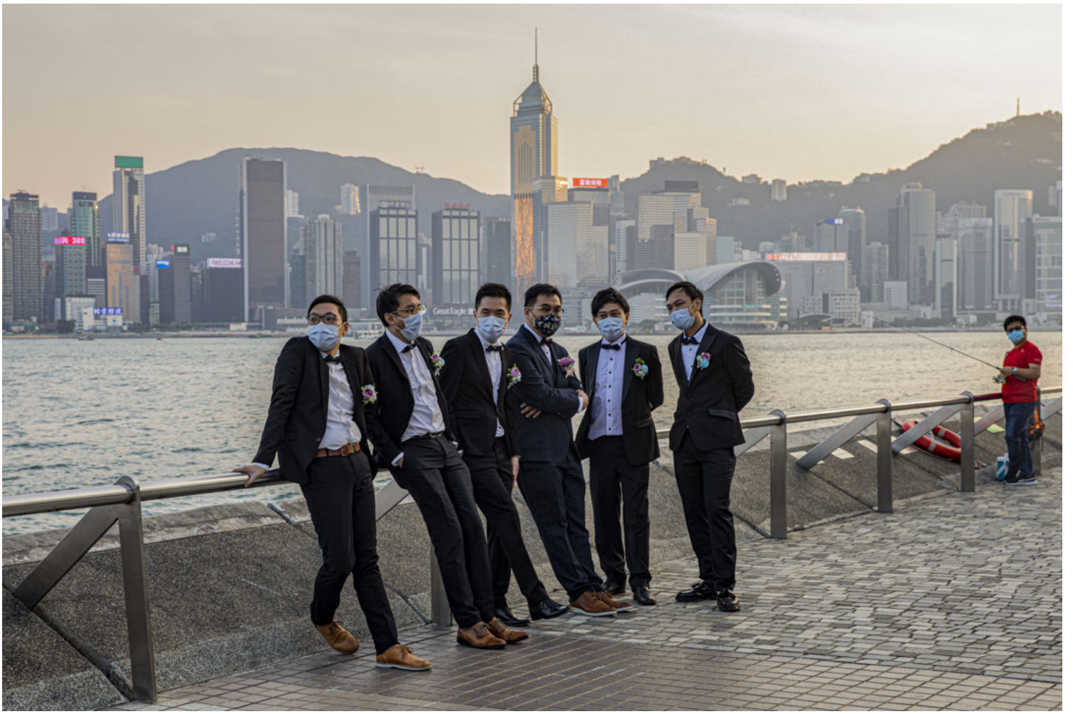
2020年11月1日，尖沙咀，新婚新郎和兄弟們戴著口罩在維多利亞港海旁等待拍照。