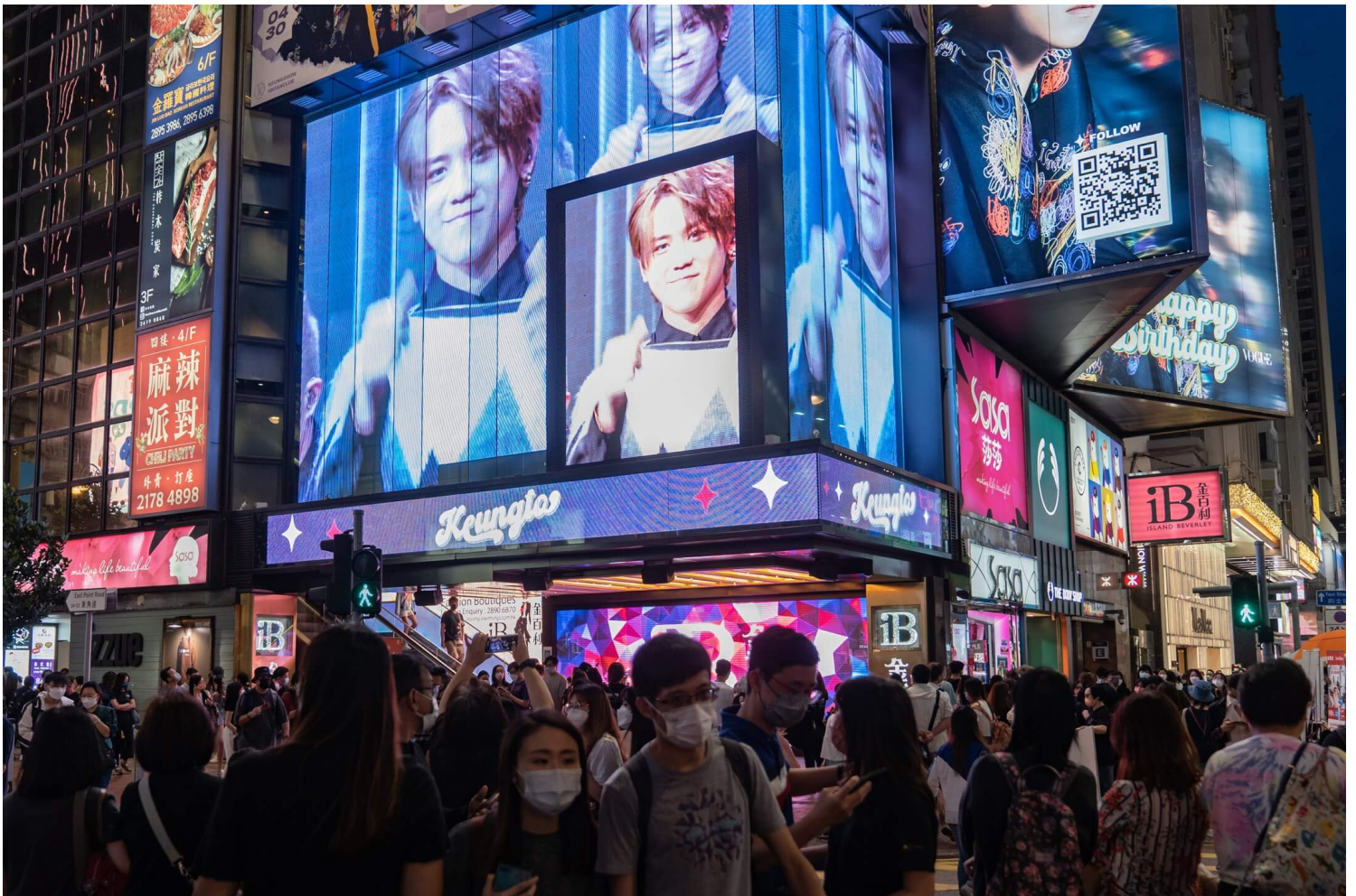
2022年4月30日，香港男團MIRROR成員姜濤生日，他的支持者在銅鑼灣買下多個廣告版為他慶祝，多人前往拍照留念。