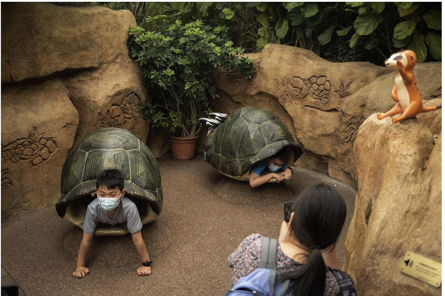
2021年4月1日，兒童戴著口罩遊海洋公園，其中走進龜殼的擺設內。