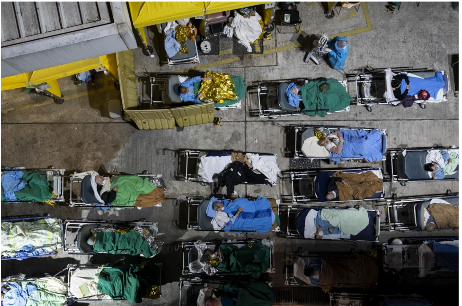
2022年2月16日，香港明愛醫院在急症室旁邊的露天空地設立隔離區，不少長者病人臥在病床上等待覆檢，其中有臥床的老人伸出手想觸碰對方。