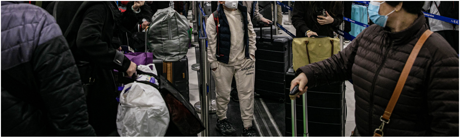
2023年1月8日，香港落馬洲口岸，大批市民於早上等待過關。