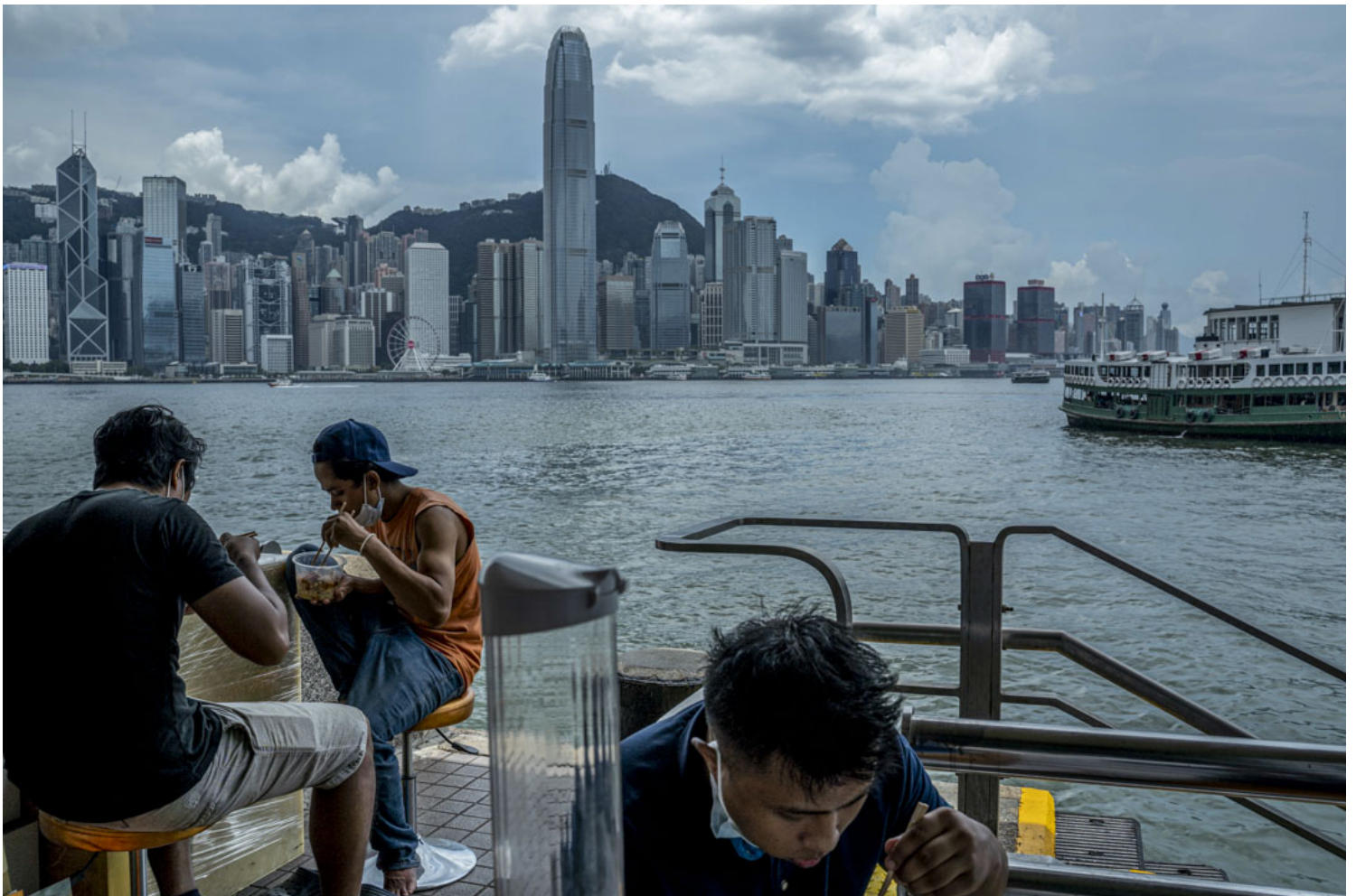
2020年7月29日，港府宣佈全日禁餐廳堂食，但並沒有規定強制居家工作，香港打工仔於午餐時分流離失所，拿著外賣食物到處找地方吃飯。尖沙咀海旁工人們於烈日在維港下吃午飯。