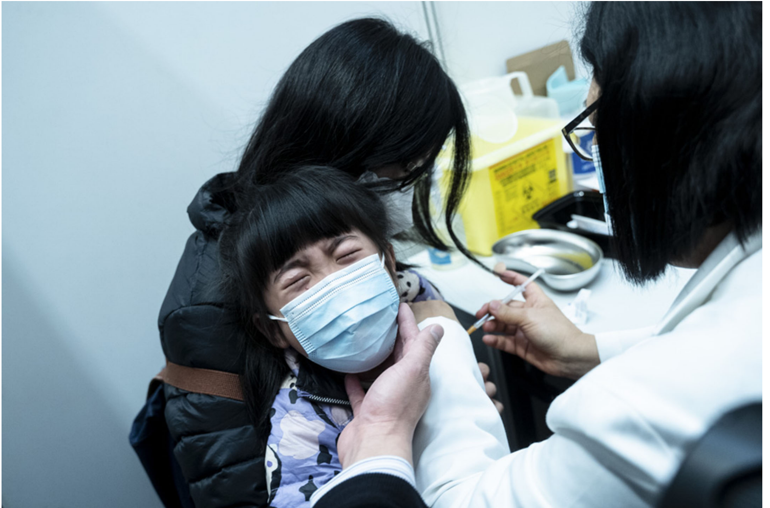
2022年2月25日，一名小朋友在社區中心接種疫苗。自香港疫苗通行證實施，所有無針者的學習和社交生活，無一不受限制。