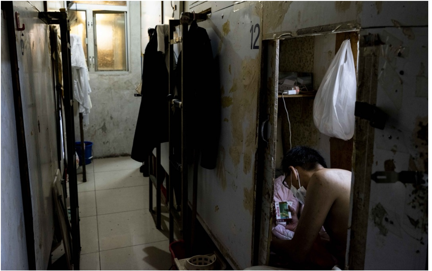
2022年6月23日，疫情期間，深水埗一間棺材房住戶正在查看連花清瘟膠囊。