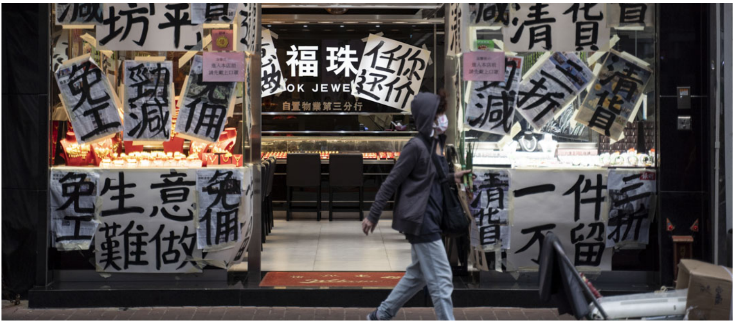
2020年4月16日，突如其來的疫情導致全球經濟停擺，各地封關，長期依靠旅客的本港零售業亦身受其害，大埔一間珠寶店生意慘淡，整間店貼滿減價標語。