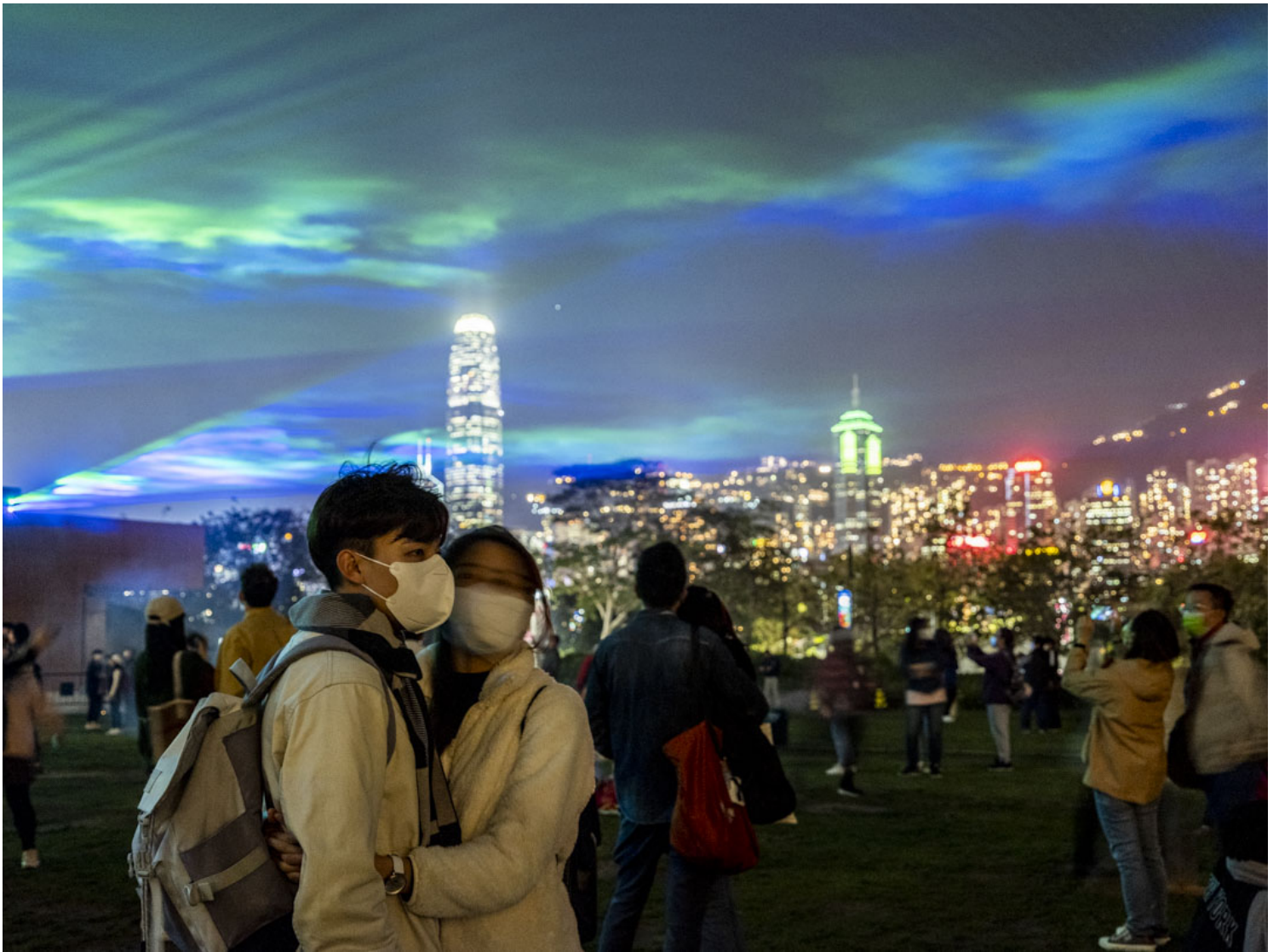
2023年2月28日，港府早上公布，於三月一日起將撤銷所有強制佩戴口罩的要求，讓社會全面復常，維持近千日的口罩令全面撤銷。28日的晚上，西九文化區的市民欣賞人造極光表演。