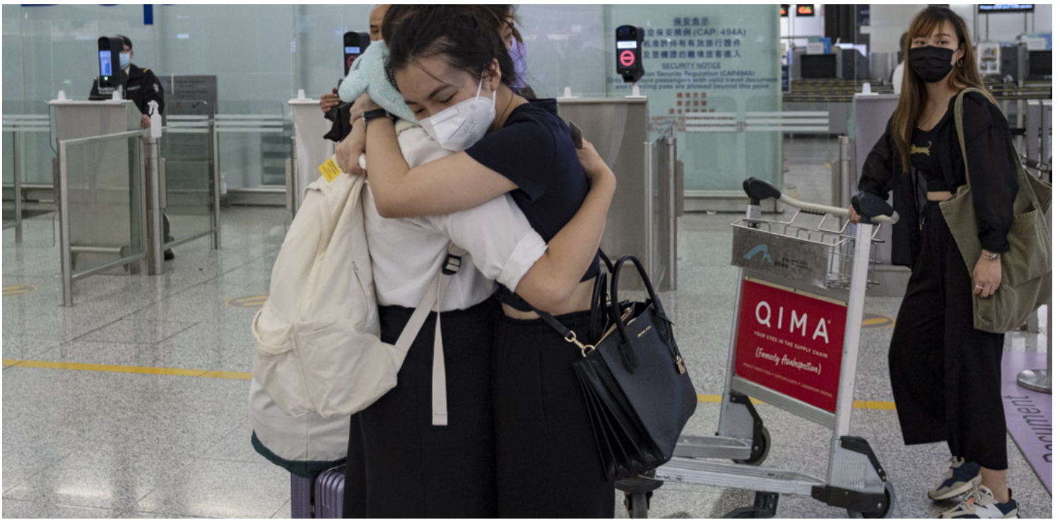
2021年6月30日，香港國際機場，市民在離境大堂相擁道別，準備登上前往英國的航機。