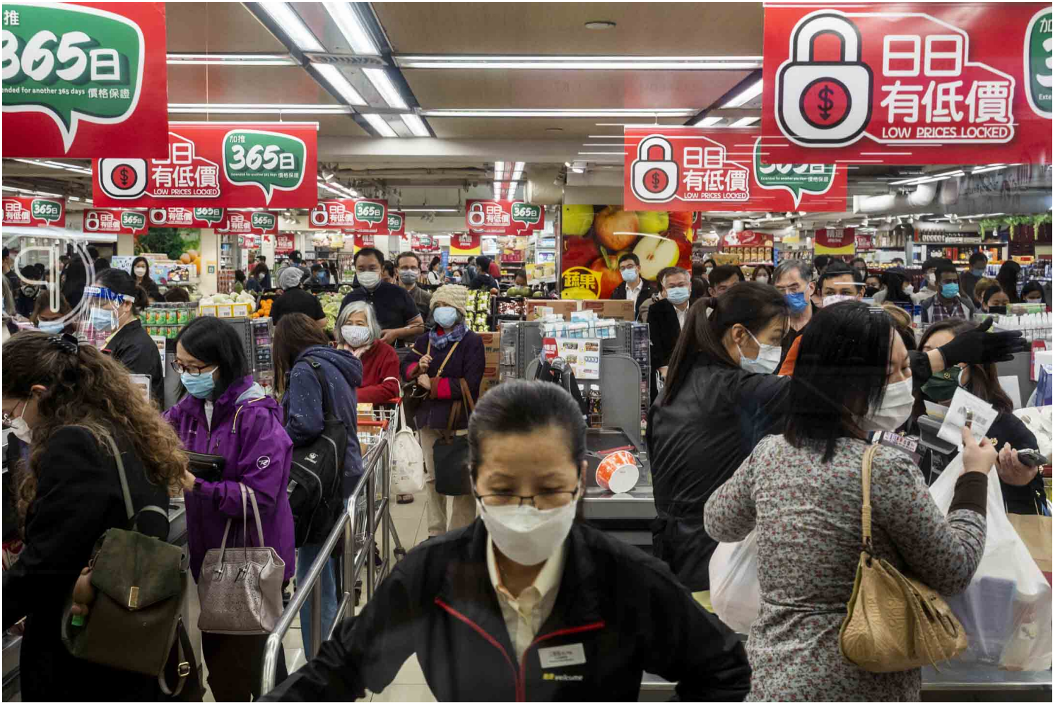
2022年3月1日，第五波疫情嚴峻，2月底特首林鄭月娥宣佈將舉行全民強制檢測，隨後一段有關禁足傳聞的錄音在市民間流傳，大批市民蜂湧至超市、百貨公司、街市等，搶購雜貨糧油。