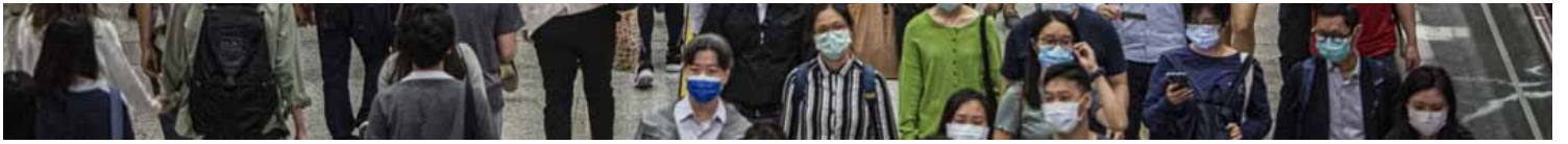
2020年11月5日，香港站下班時間的回家人潮，所以市民都是戴上口罩。