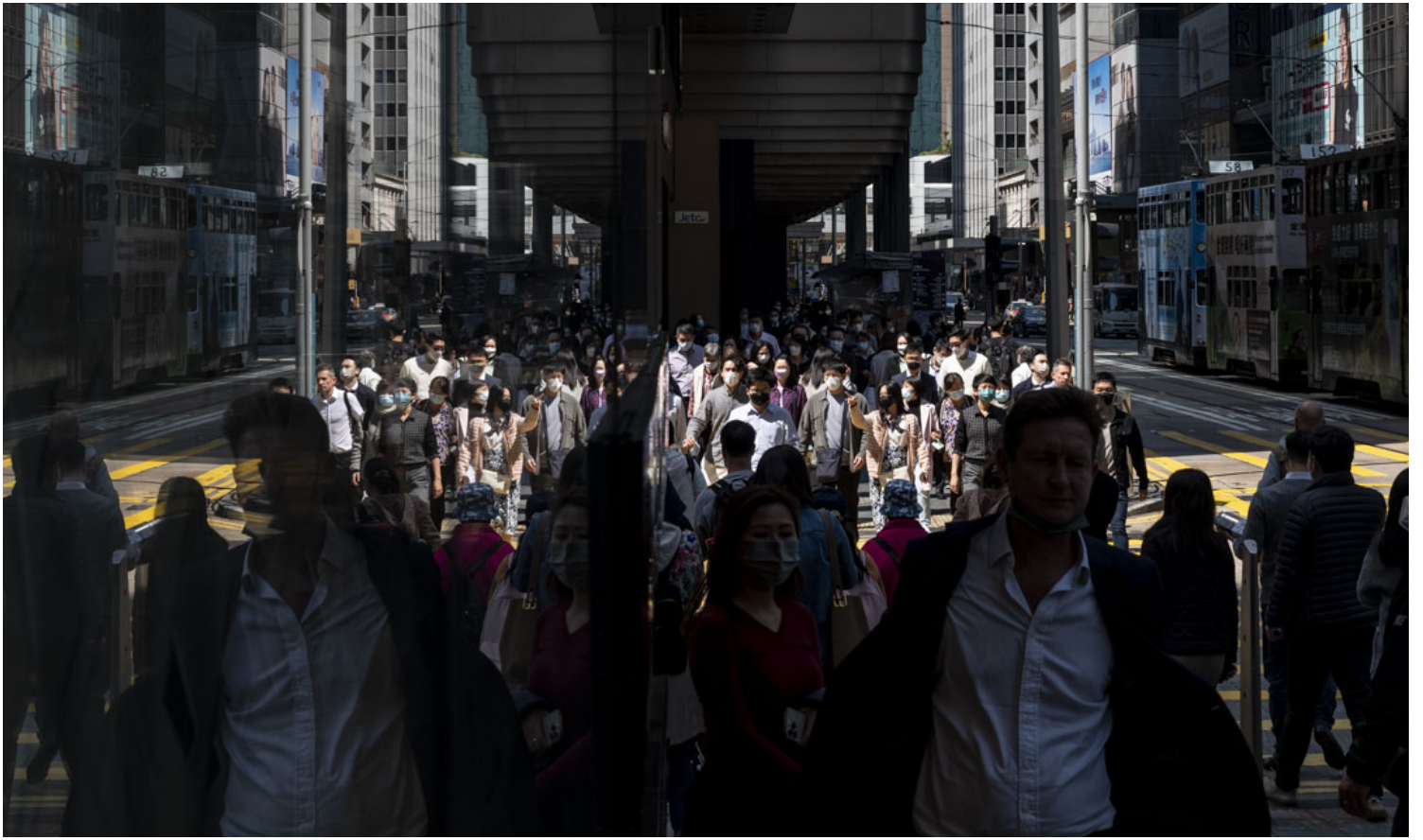
2023年2月28日，港府早上公布，於三月一日起將撤銷所有強制佩戴口罩的要求，讓社會全面復常，維持近千日的口罩令全面撤銷。28日的中環中午，市民戴上口罩外出午膳。