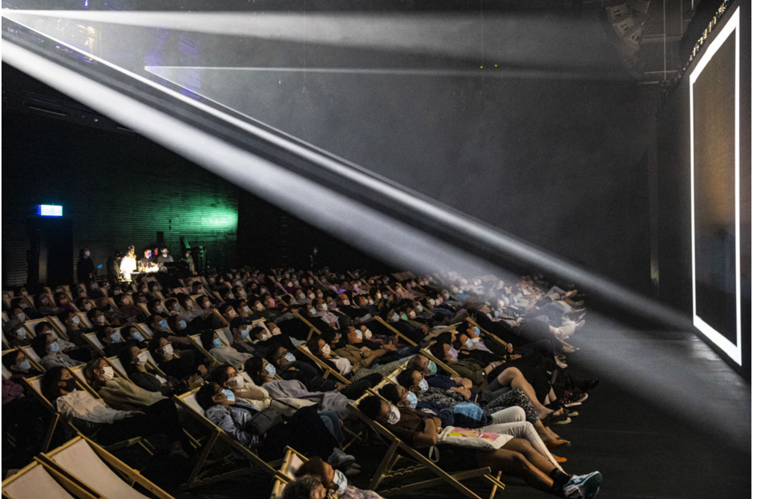
2020年11月7日，疫情期間，戴上口罩的市民在西九龍文化區欣賞自由爵士音樂節的表演。