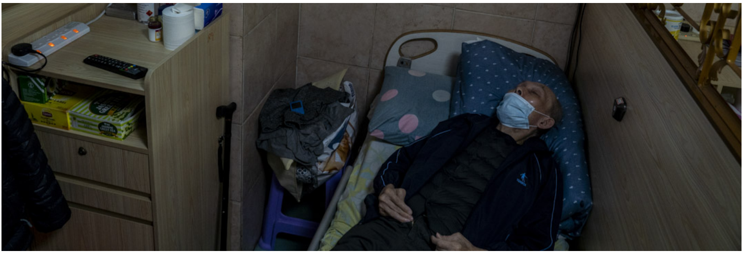
2022年3月10日，安老院的長者房間，房內的電視播放著特首林鄭月娥的疫情記者會新聞片段。