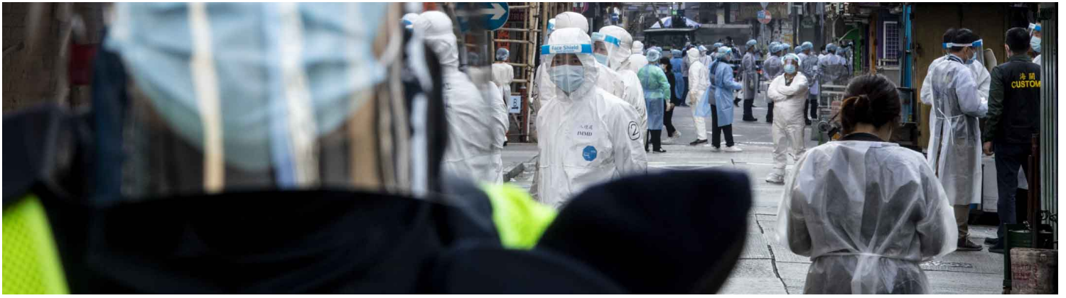
2021年1月23日，香港政府宣布以疫情原因，圍封九龍佐敦的部分指定區域，禁止居民外出，是香港首次以封區作為檢疫的措施。佐敦「受限區域」由警員把守出入口，內有大量穿上保護衣的工作人員安排區內人士強制檢測。