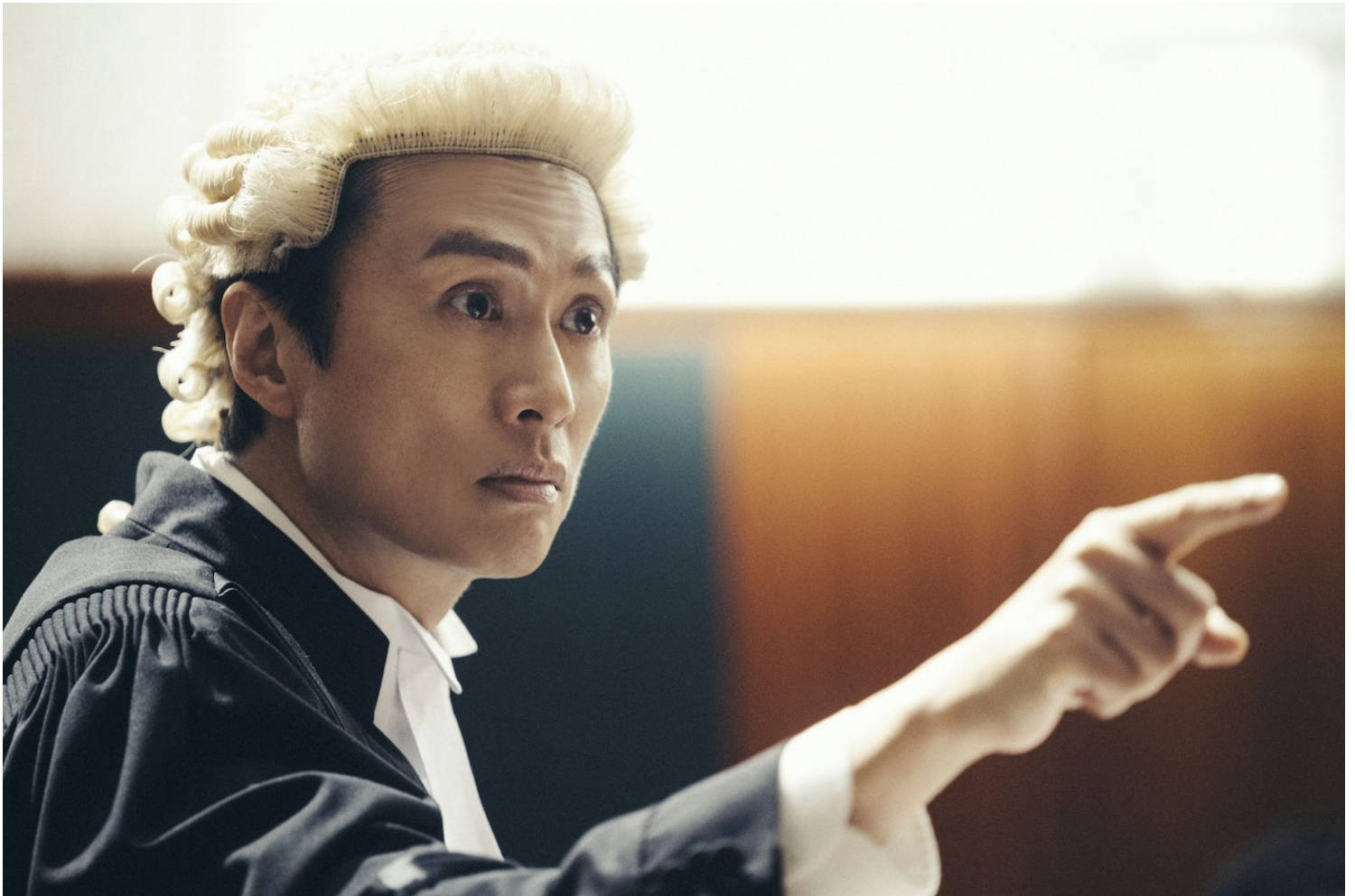
《毒舌大狀》劇照。

這可能是一部兩敗、甚至三敗俱傷——導演、受訪者、觀眾——的失敗紀錄片，但也可能是一場更真實的見證。在紀錄片所窺看的十年裡，那幾個女生一直被定義了她們如何「反叛」和「成長」。但她們真正的成長，不在電影裡，是在電影完成直到上映的過程裡。