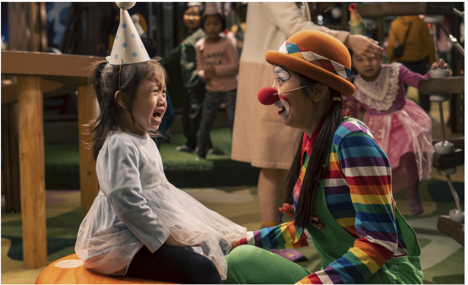
《1人婚禮》劇照。

而所謂的社運光環也更不存在，特別在本地電影動輒都賺上好幾千萬票房的港片「小陽春」時段。按今年三部賀歲片，另外兩部票房均有佳績，惟《1人婚禮》反應冷淡，至今尚未超過 300萬港元。影片既未掀起「盲撐」景象，更因評價不似預期反惹批鬥抗拒，這或許關乎部分觀眾將過多的情緒押在周冠威及其電影作品上，亦太期待他會一直留在社運抗爭路上。儘管周冠威本人雖是虔誠信徒，但電影畢竟是藝術創作，而非人們內心政治鬱結的告解。