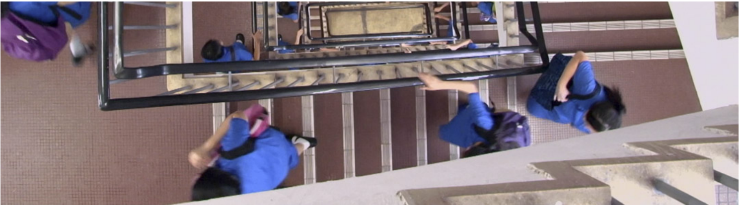
《給十九歲的我》劇照。

置身政治噤聲的去勢狀態，電影作品有時扮演著稻草人的公共角色，畢竟它是這裡僅存的仍有一定創作自由、也有表達批評自由的特殊場域。