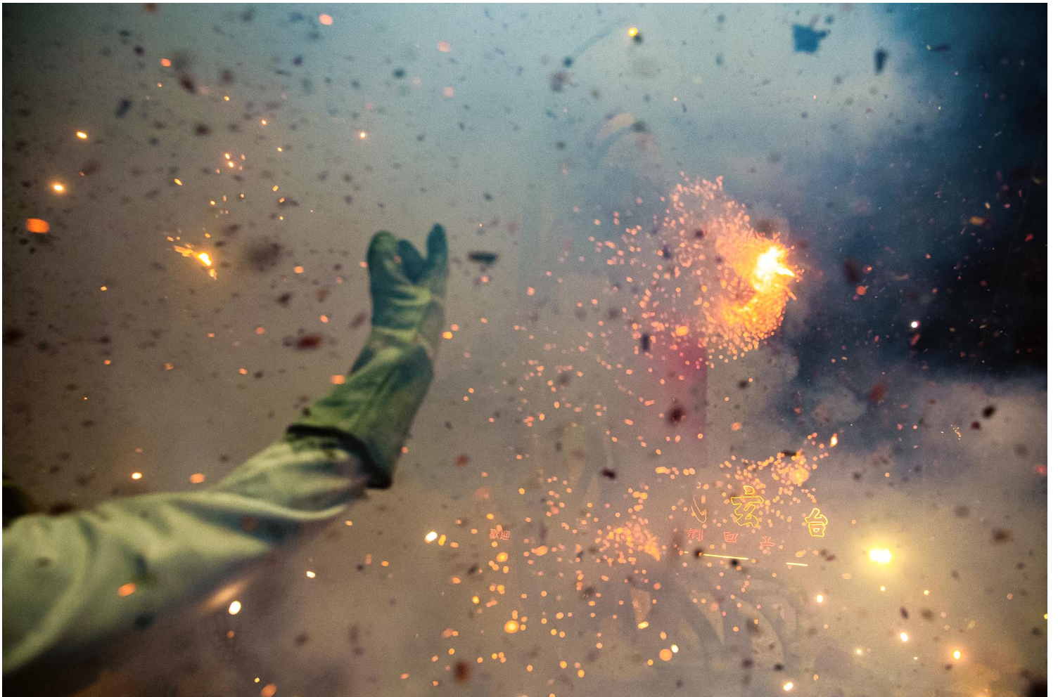
2023年2月5日，台東炸寒單。