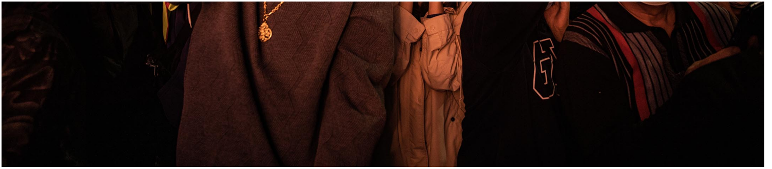
2023年2月5日，台東炸寒單。