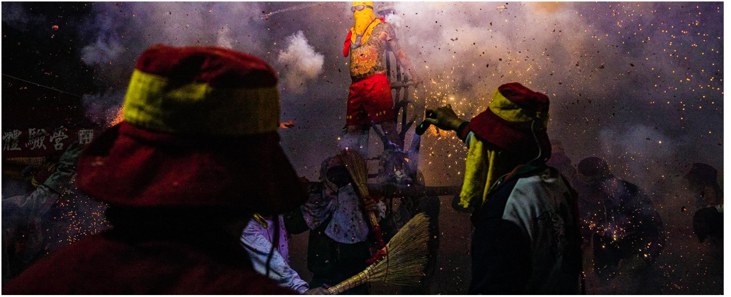
2023年2月5日，台東炸寒單。