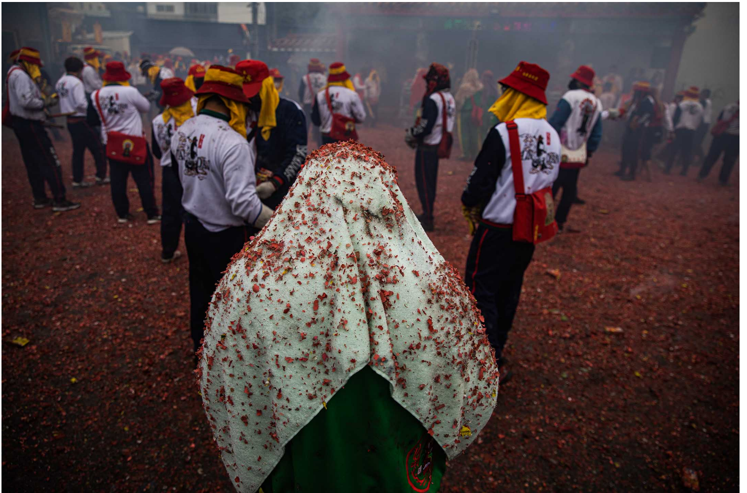
2023年2月5日，台東炸寒單。