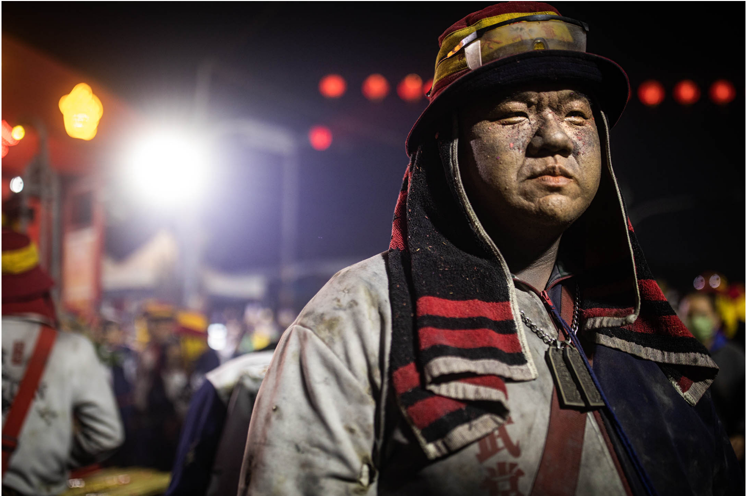
2023年2月5日，台東炸寒單。