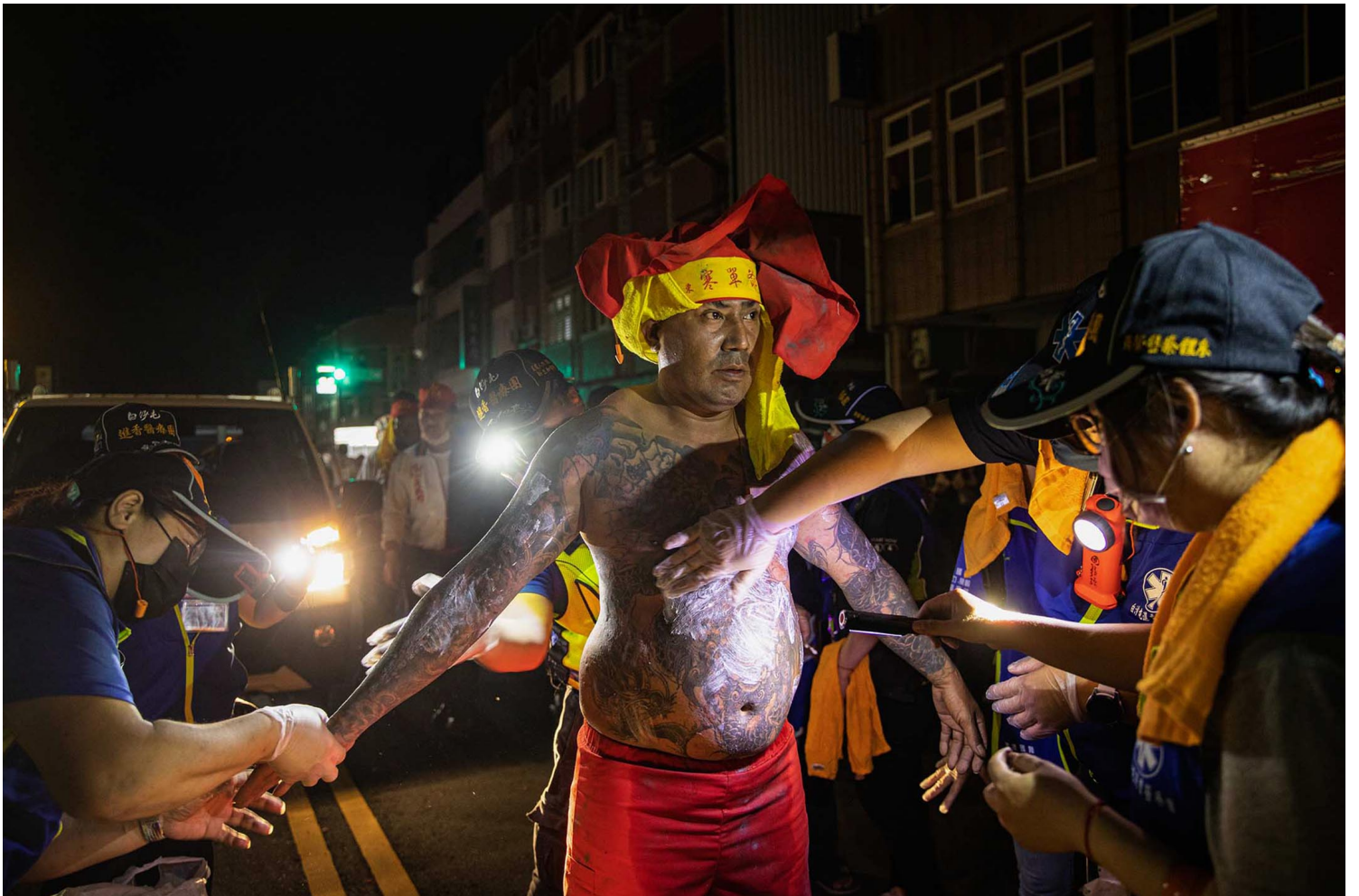
2023年2月5日，台東炸寒單。為數人目為一夕內身寒單瘡傷。