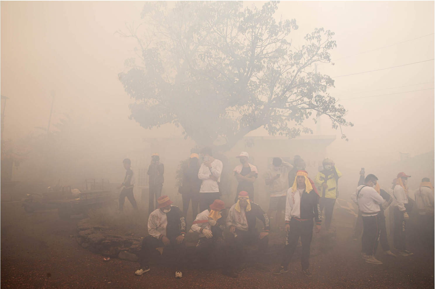
2023年2月5日，台東炸寒單，民眾被煙霧籠罩。