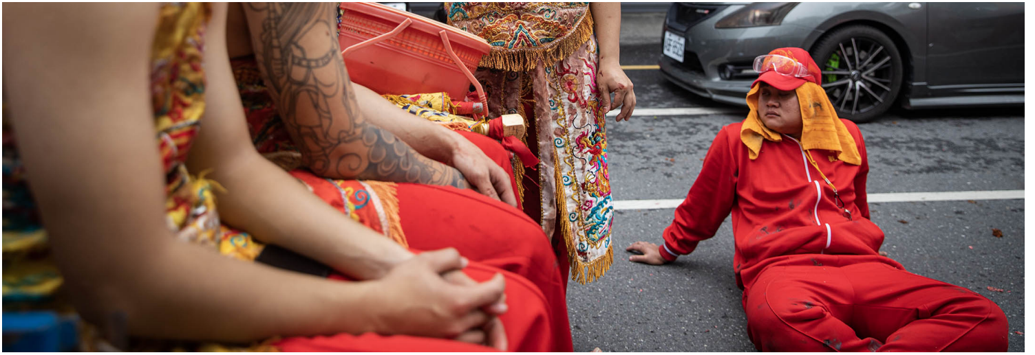
2023年2月5日，台東元宵炸寒單遶境活動。