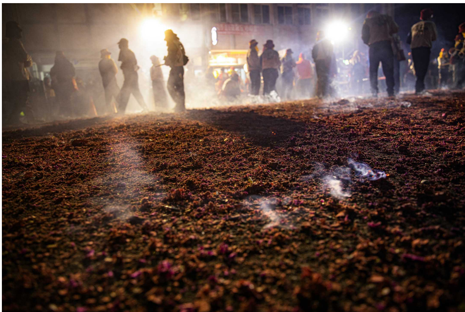
2023年2月5日，台東炸寒單。