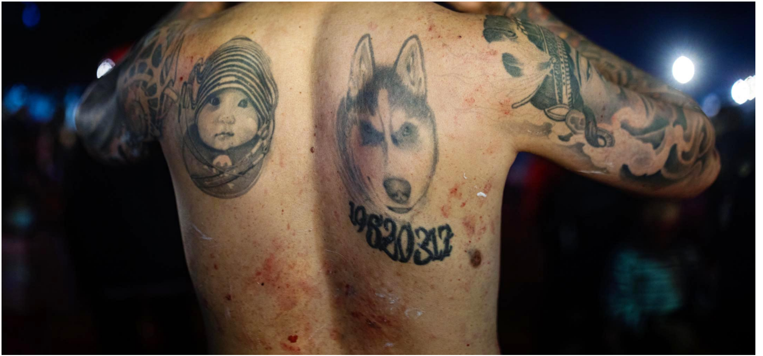
2023年2月5日，台東，一名肉身寒單背上佈滿傷痕。