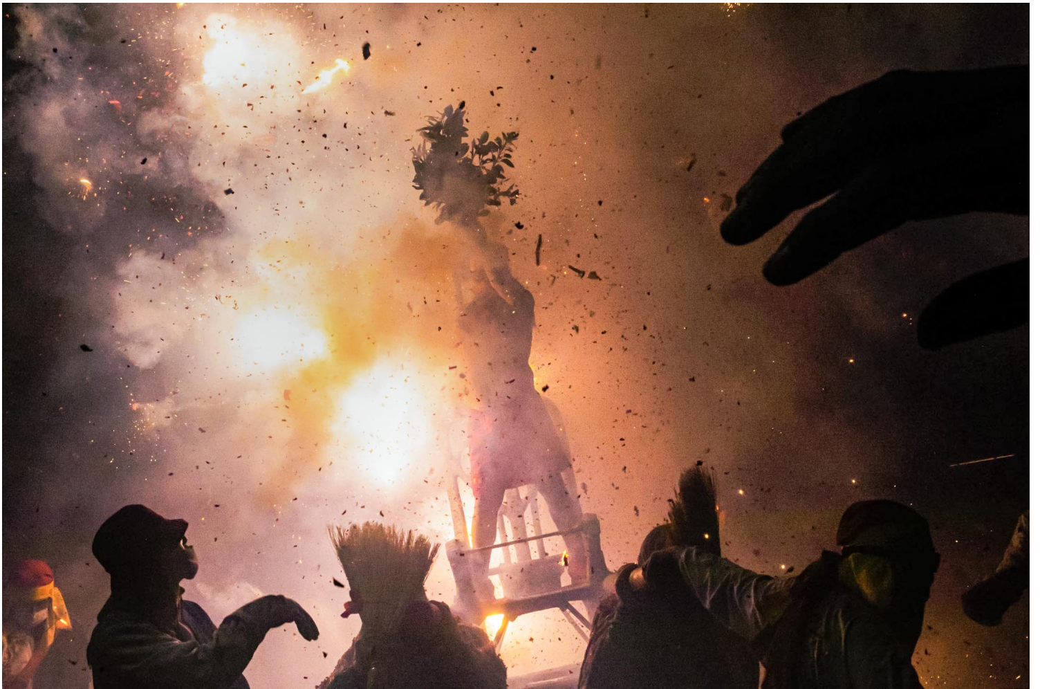
2023年2月5日，台東炸寒單。