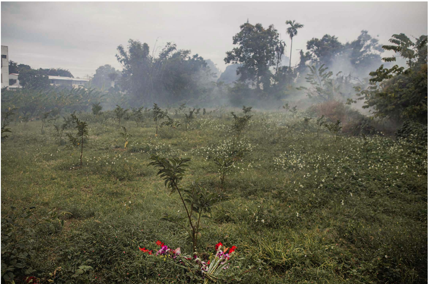
2023年2月5日，台東，炸寒單後煙霧籠罩郊野。