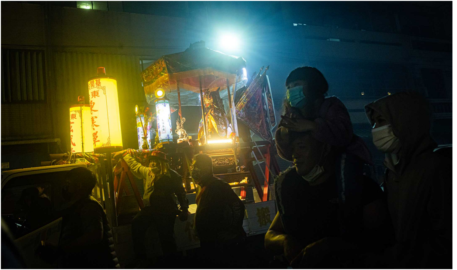
2023年2月5日，台東炸寒單。