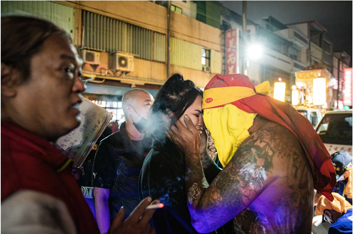
2023年2月5日，台東炸寒單活動期間，一名父親安慰女兒。