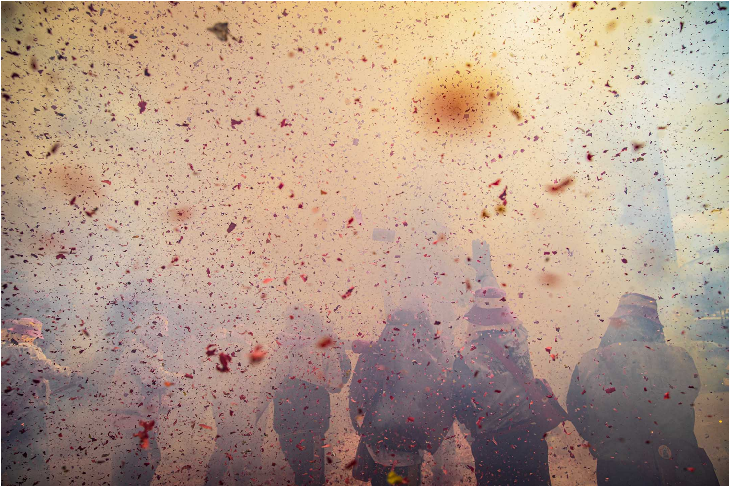
2023年2月5日，台東炸寒單。