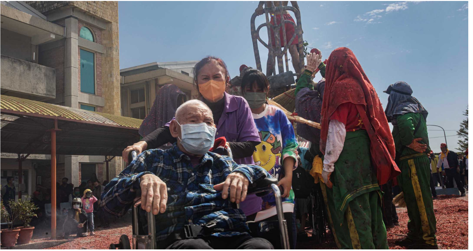
2023年2月6日，台東一間護老院，老人鑽轎腳祈福。