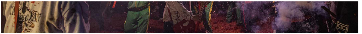
2023年2月5日，台東炸寒單。