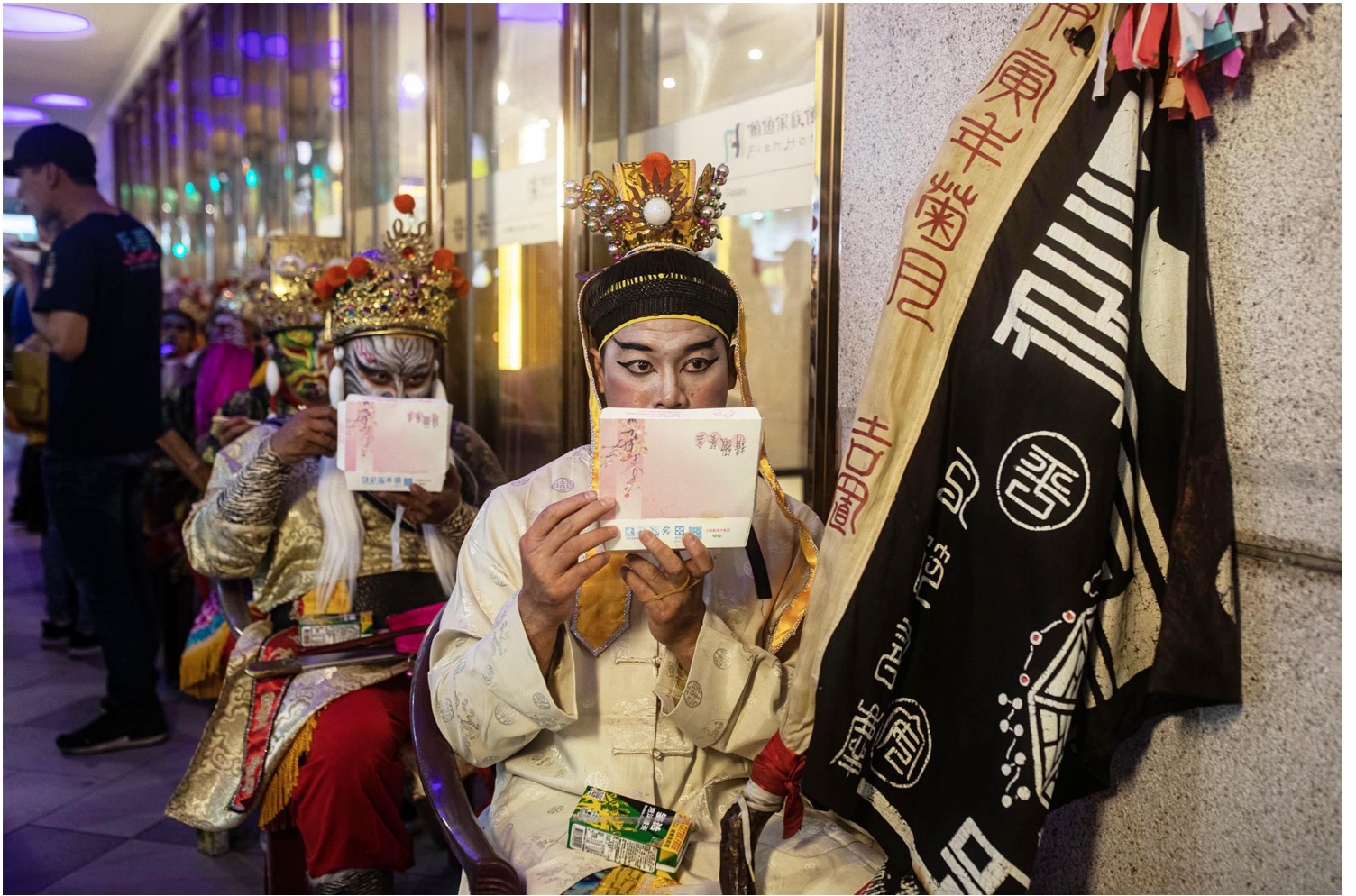
2023年2月5日，台東元宵炸寒單遶境活動。