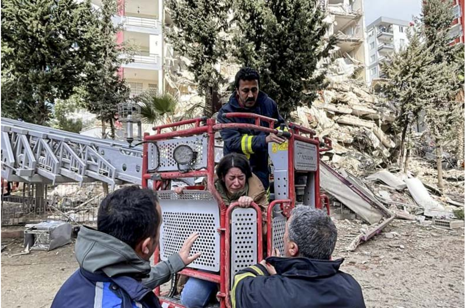
2023年2月6日，土耳其阿達納的地震災場，消防員營救被困在 13 樓建築物的住客。