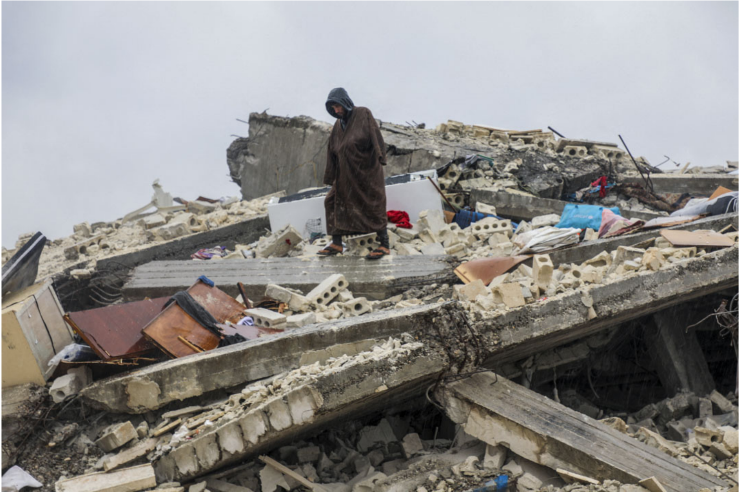
2023年2月6日，敘利亞發生地震後，一名男子站在廢墟上。

佈消息，中國國家主席習近平已經分別致電慰問土耳其總統埃爾多安和敘利亞總統巴沙爾。