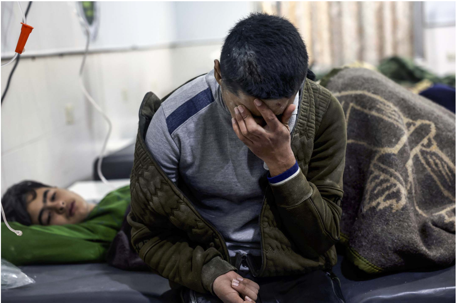
2023年2月6日，地震傷者在敘利亞北部伊德利卜省達爾庫什鎮的醫院接受治療。

截稿時，兩國已有超過2000人喪生、10000人受傷。歐盟以及台灣和日本亦都派出搜救隊或提供物資以支援災區。據BBC報道，世衛組織指出隨著搜救繼續，死傷數字可能會增加八倍之多，並大雪天氣會令安置災民出現困難。而也有報道指天然氣管道被破壞，引致火災，增加搜救難度。