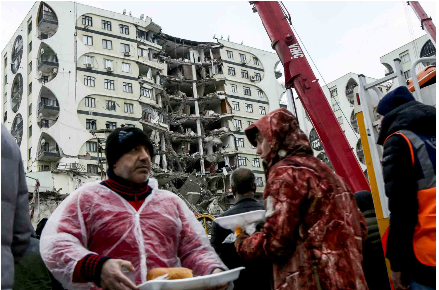
2023年2月6日，土耳其迪亞巴克爾發生地震後，人們在受損建築物附近等待接收食物。

根據現代地震學家使用的，非線性的矩震級表（非黎克特制），每上升一級就代表釋放出32倍的能量。土耳其東南部通常只發生5級地震，而今次的7.8級地震，實際上比平時的5級地震釋放出大約6000倍的能量。