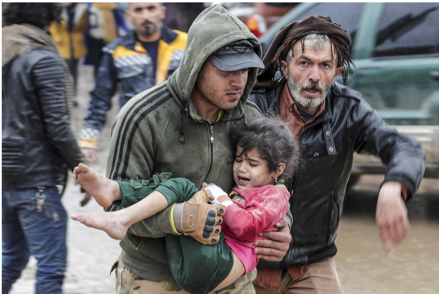
2023年2月6日，敘利亞發生地震後，一名男士手抱女孩離開災場。

位處兩國邊境地帶的加濟安泰普成爲許多難民的居留地。這個戰前只有160萬人的城市現已成爲約46萬敘利亞難民的安身之所，是土國安置敘利亞難民第二多的城市，僅次于擁有1700多萬人口的全國第一大城伊斯坦布爾。相比起許多收容敘利亞難民的國家，土耳其給予難民相對高的自由度，許多敘利亞人已經在加濟安泰普做起生意，敘利亞內戰期間，加濟安泰普至敘利亞的出口從2011年的1億美元，上升至2015年的4億美元。而難民也填補了土耳其東南部對低技術勞工的需求，不少來到該地區的難民都找得到工作。