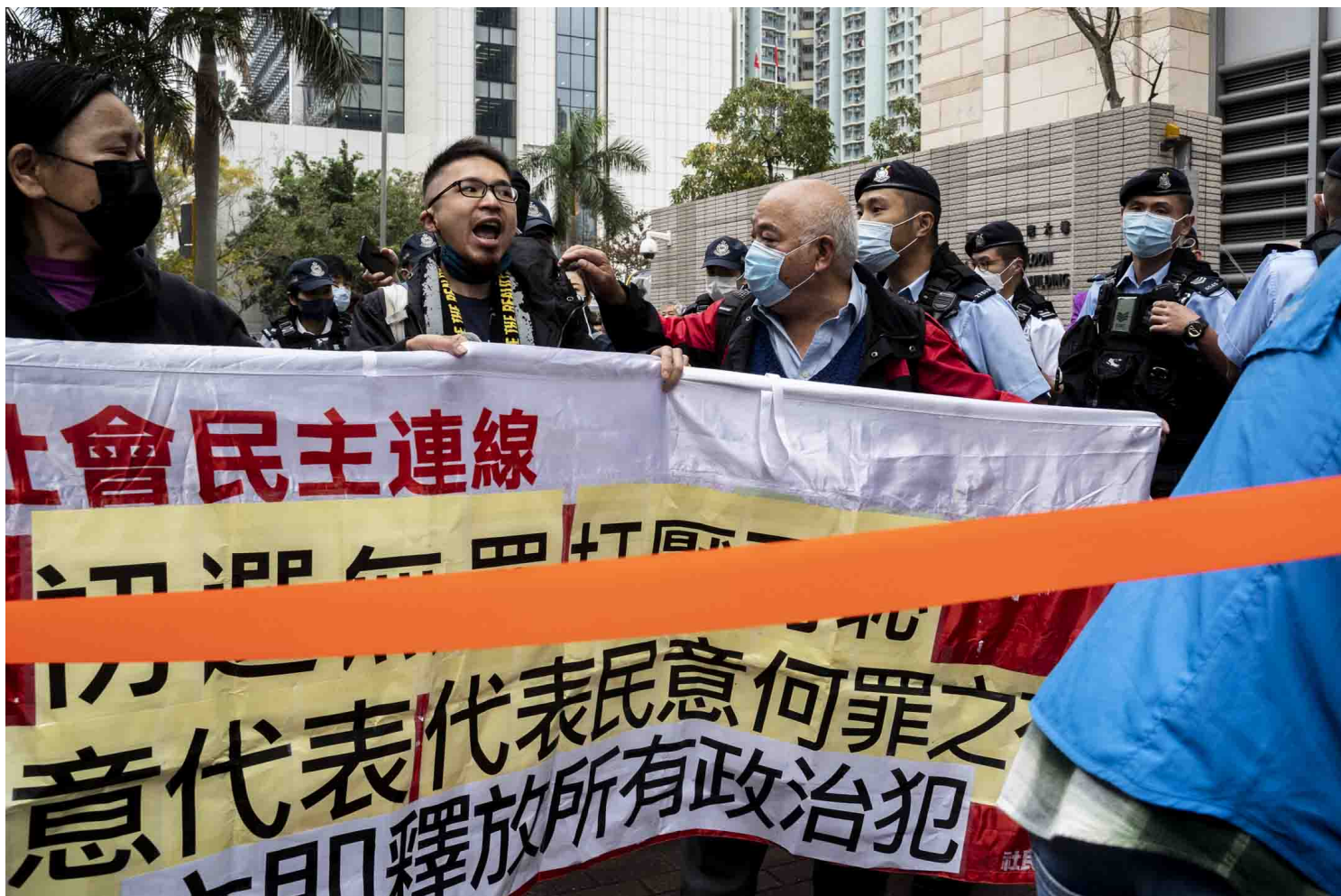
2023年2月6日，47人初選案開審，社民連在西九龍法院外請願，表達初選無罪，要求釋放政治犯。

早在2021年9月，即尚未撤銷87A報導限制之時，親中媒體《大公報》曾引述消息報導，至少2名獲准保釋的被告會配合警方，提供污點證人書面口供，以換取減刑期。