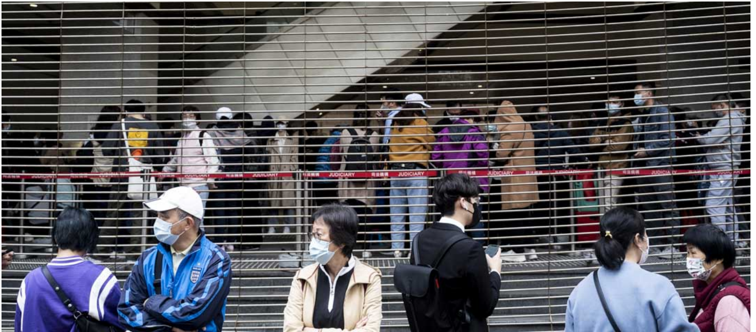
2023年2月6日，47人初選案開審，法庭外有不少市民提早排隊取籌聽審。