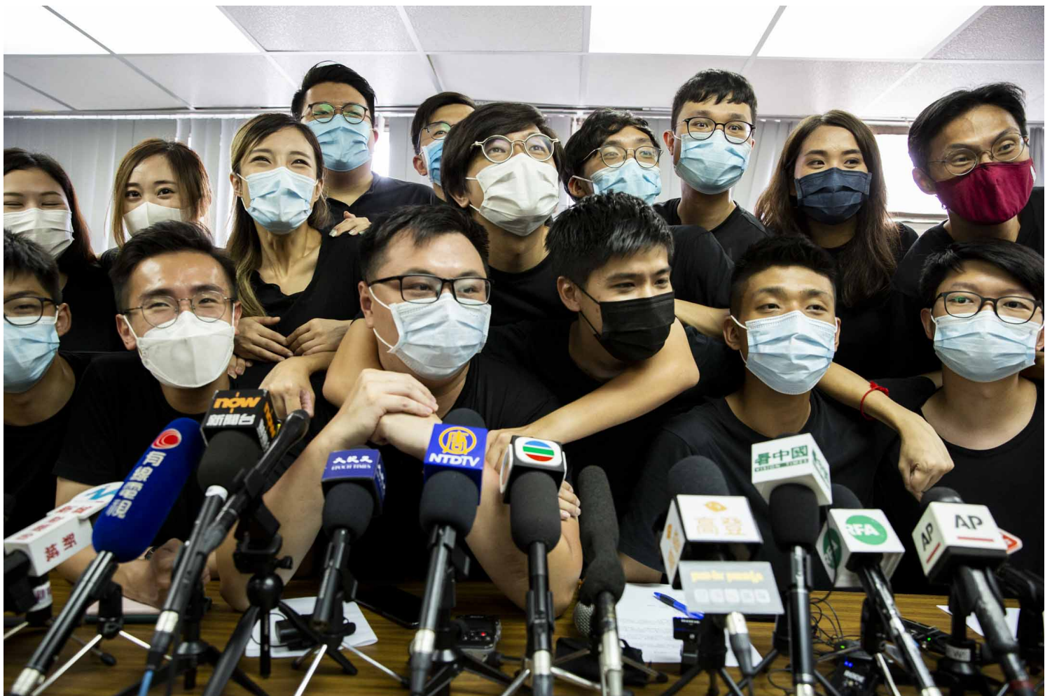
2020年7月15日，16名抗爭派初選勝出的民主派參選人士舉行記者會。

至2022年，先後再有3名被告曾向法庭申請向法庭申請放寬或解除9P條限制，均被拒絕。「47人初選案」中共6次就9P條的報導限制解除申請均以失敗告終。