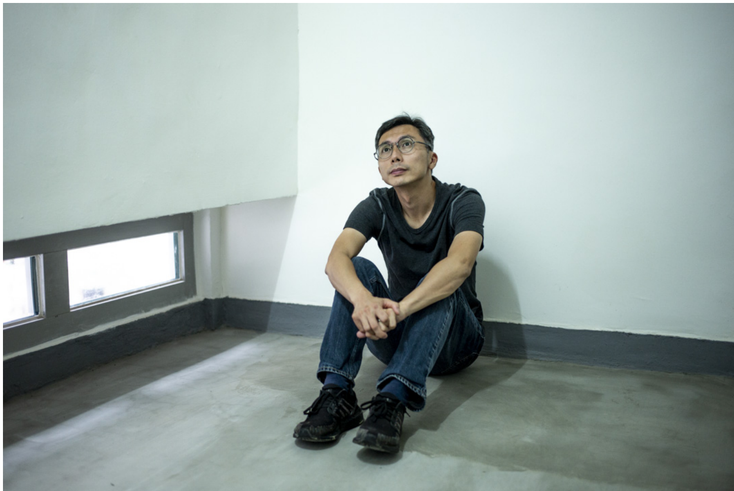
导演周冠威。

不论是创作抑或生命本身，“过了一关，人好像更有勇气了。我会再贪心点行前一步。”他说，“世界很多不正常，所以如果你要说新出路，还原正常就可以了。”