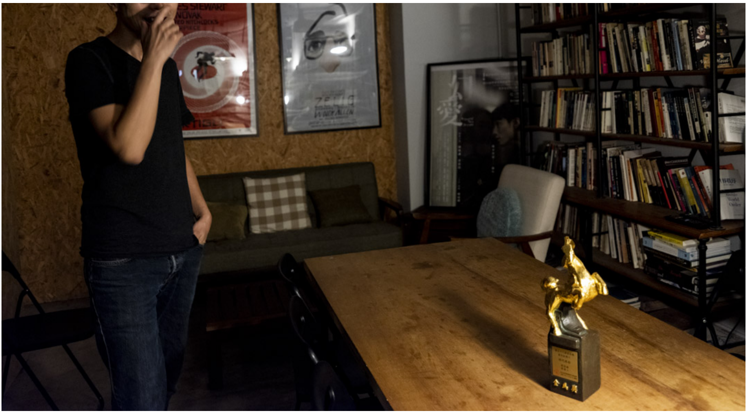
周冠威执导的纪录片《时代革命》曾夺得金马奖最佳纪录片。