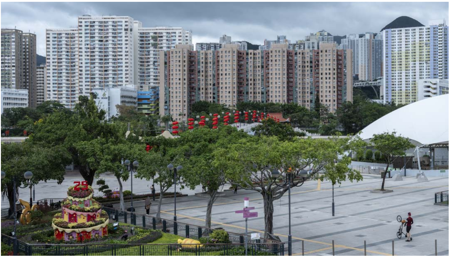
沙田中央公园。