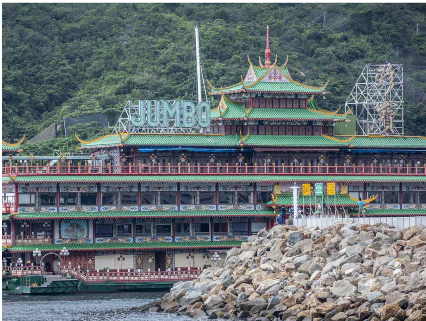
珍宝海鲜舫由多艘护航船拖离开香港仔。

他提起社交媒体热议被拖走而最后沉没的珍宝海鲜舫。“香港仔的珍宝海鲜舫和茶楼船不同，珍宝海鲜舫要你庆祝升班、考完试才有得去。我最后一次去是为一位来港的日本艺术家洗尘，他的行李滞留在机场，连一条底裤也没有。我安慰说，来，我们去珍宝海鲜舫洗尘！”