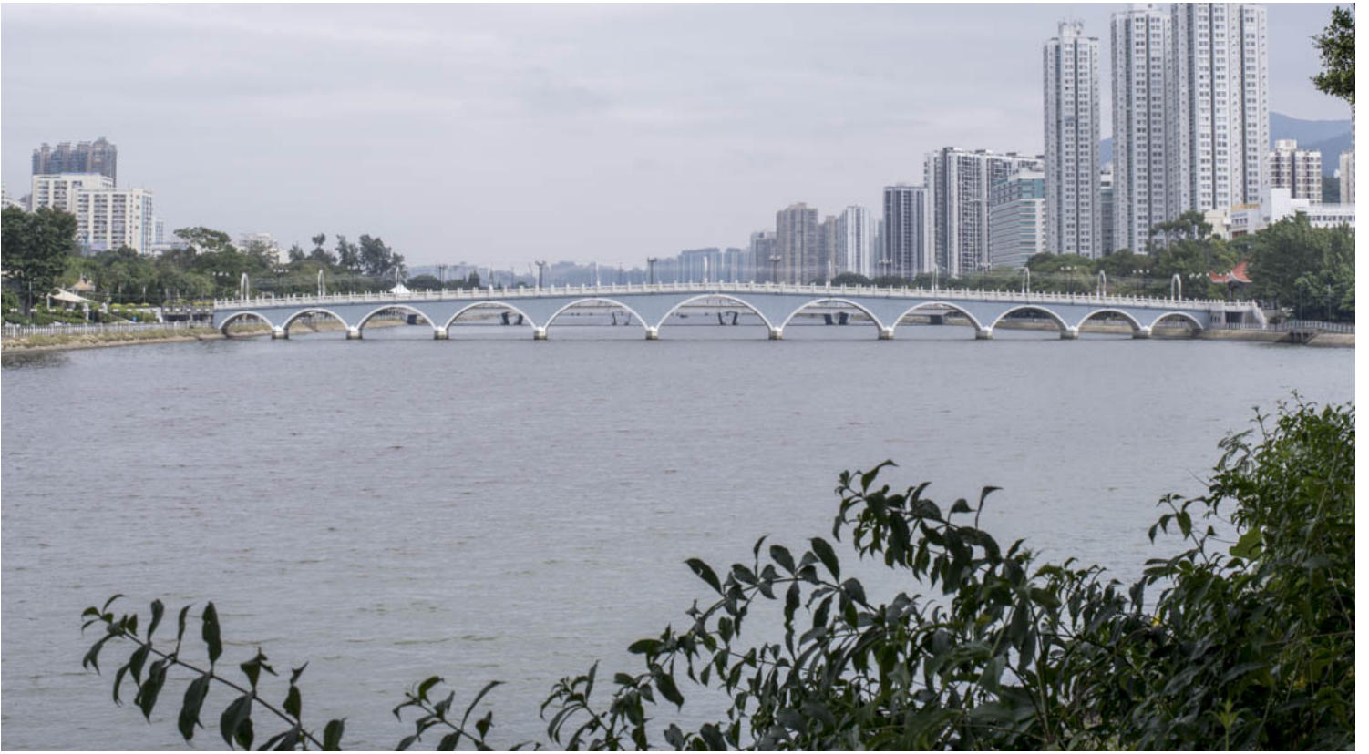
沙田城门河。

荣仔是“怀疑人生就去__”成员，艺术家，巴士迷，也是城市的研究者。早年他已作过很多有趣的日常倡议，如制作《巴士内功心法》，鼓励人结合步行和巴士，走出士的路线，鼓励人探索港铁以外的交通模式；另外他曾经办步行展览“11号全日游街”，记录他多次在香港跨区的长途步行，根本也是个“城市漫游者”。