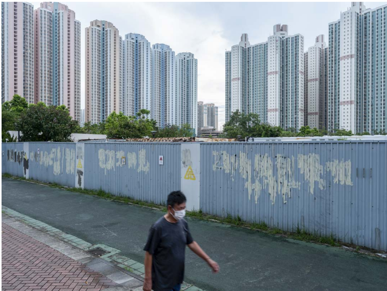
天水围的公共屋邨。

好像我小时候在天水围经常去的玩具店，什么痕迹也没有留下，记忆像虚幻的而你找不到存在的证明。很难受，也很不真实。我自己因为做了这个专页，过去两年，食过很多未食过的食物，入过很多未入过的店舖，和很多根本不会聊天的人聊天。