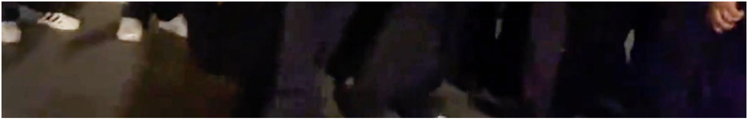
2022年11月27日，成都街道上有警察驻守。