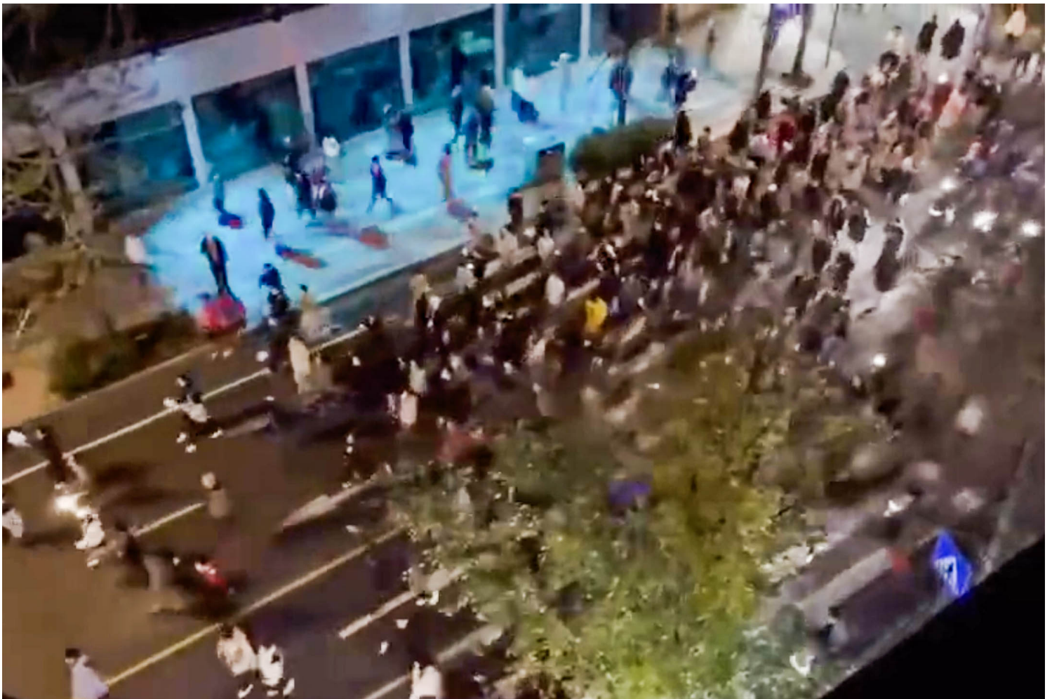
2022年11月27日，成都大批民众走上街头示威。