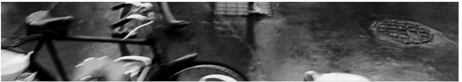
1992年，上海的街头。