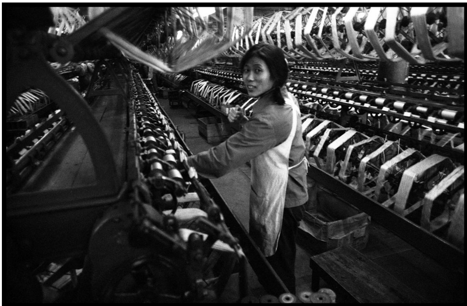
1981年，上海丝绸厂从事纺纱工作的妇女。

上世纪八十年代的中国进入所谓“改革开放”时期，但文革造成的文化疮痍，是每个从中成长过来而又希望为历史的曲折寻找解释、为民族与个人的心灵寻找寄托的人，从荒原走出来后所要面对的另一片废墟。