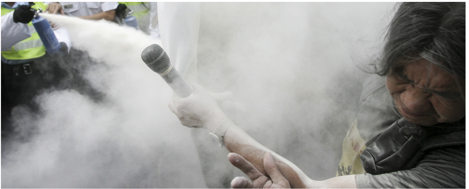
2007年7月1日，香港示威者焚烧人形玩偶，被警方使用灭火粉扑熄。

天空和道路不可置信，却可一再发生，重点在于怎样聚合介入的力度，以先于未来抵达现实背面。同样在2004年，孟浪写了一首〈无题（或一个笔误：2104）〉，塑造了一个深渊，但人类却不是坠落进去，而是亲手筑路进去。在这个版本的现实里，“他们在快车道上／急急地运送慢”，病人们在建造医院，贫弱的医生却让白床单覆盖大地，最终“慢，就这么走著／走向一列列的停”，四周黑得只剩月亮“可以用来擦拭你的血手”。每次前赴极地，都被诗人铭刻为记忆，犹如孩子在虚无上的图画：