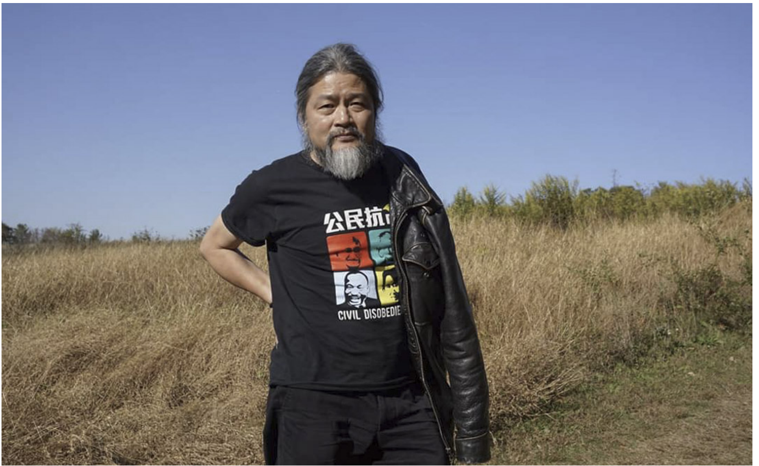
已故诗人孟浪。