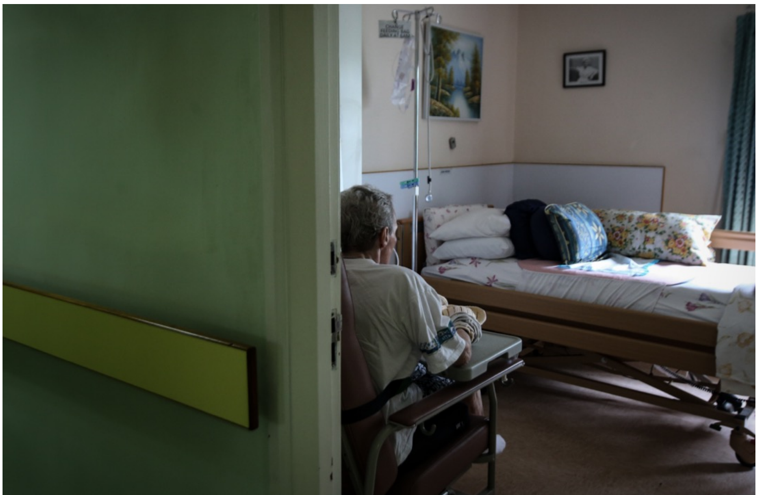
香港，九龙区一家护老院，一名长者坐在房间里。

他曾经写过3封遗书，打算杀妻后自杀，但最后还是决定负责。他说，“心甘情愿抵，我还有什么呢？”