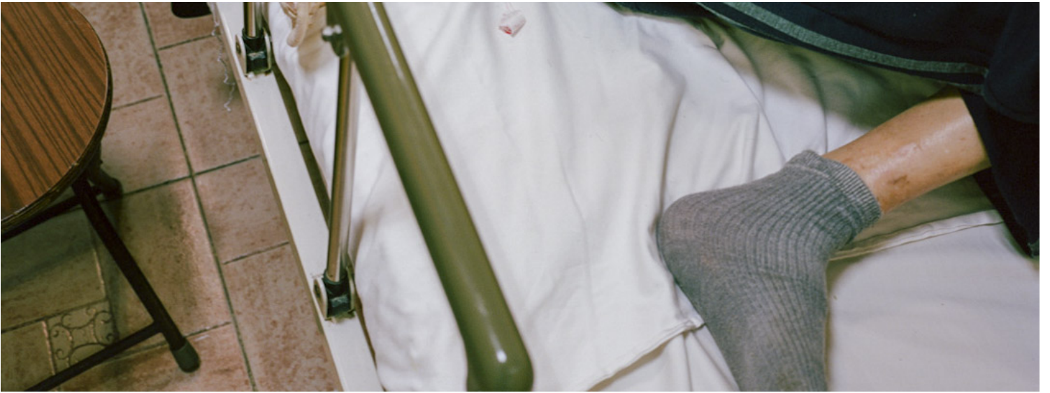
香港，九龙区一家护老院，长者躺在床上。