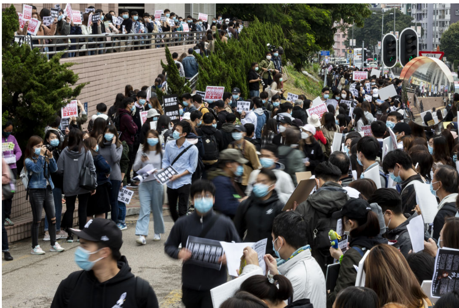
2020年2月4日，医管局员工阵线宣布进入第二阶段罢工，多个工会到医管局大楼发起请愿活动，以“一人一信”方式要求医管局向港府施压全面封关。

“第五波疫情发生时，作为一个医护工会，应该是要讲得更多，争取得更多，但当时我们是Do nothing（没有做什么）。”有话而不敢说，是因为国安法，更是因为恐惧。有工会理事声称被跟踪，由下班到回家都被监视。“理事之间的矛盾，（就第五波疫情）有人想讲，有人不想讲，令我们无法走下去。我觉得我们是有能力做得更多的。就算我们不能再号召行动，但至少可以做一点事让人们看见。”