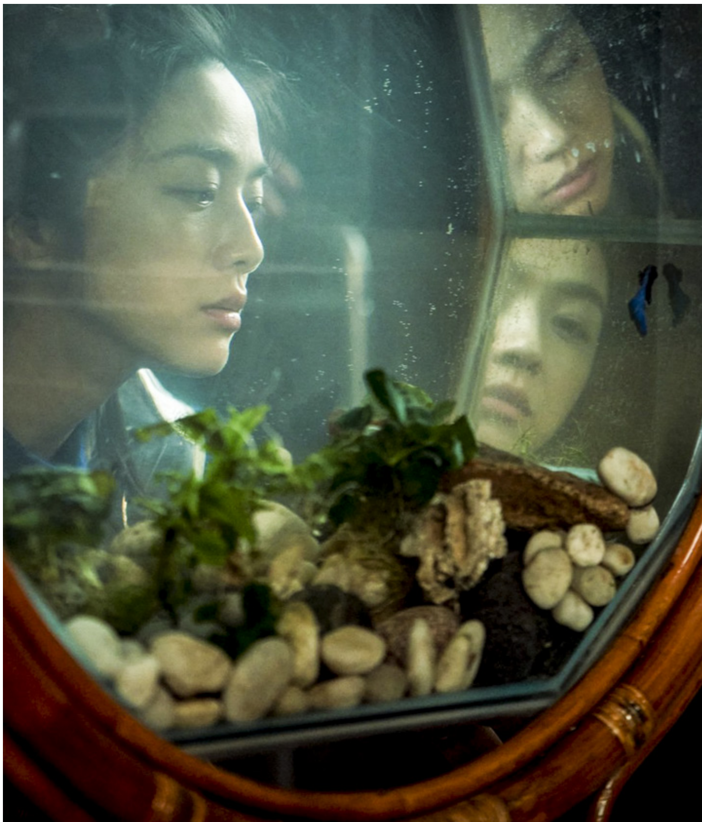
《分手的决心》剧照。网上图片