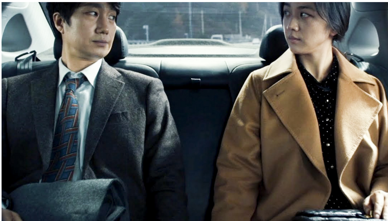
《分手的决心》剧照。网上图片