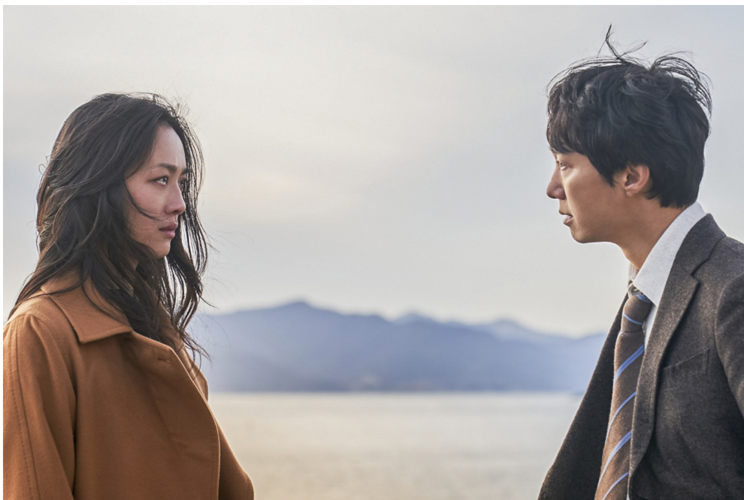
《分手的决心》剧照。