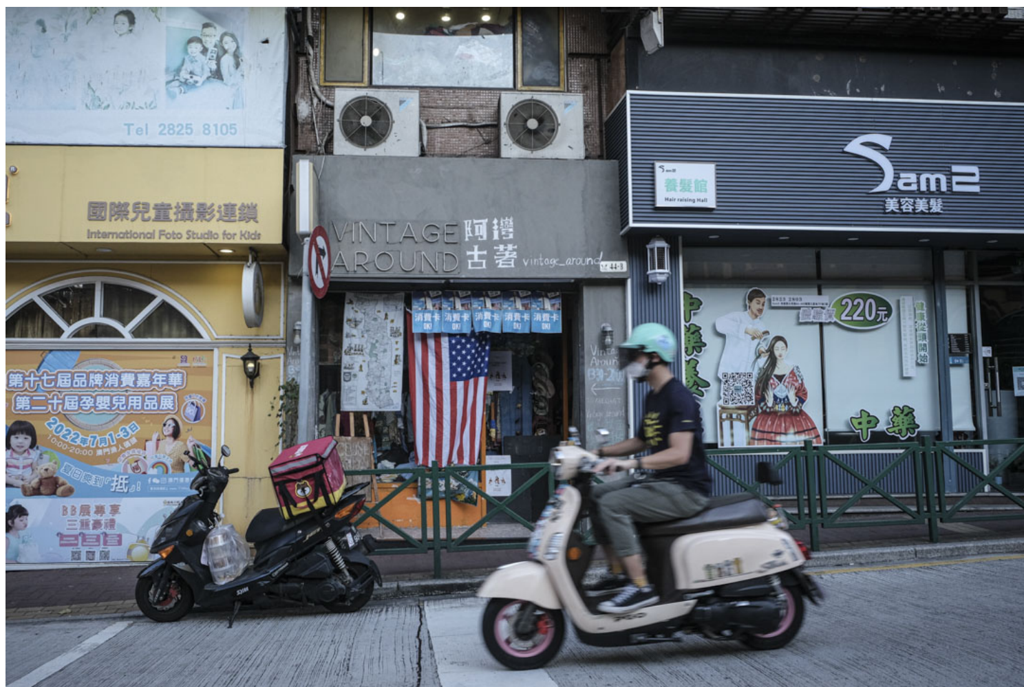
荷兰园马路。