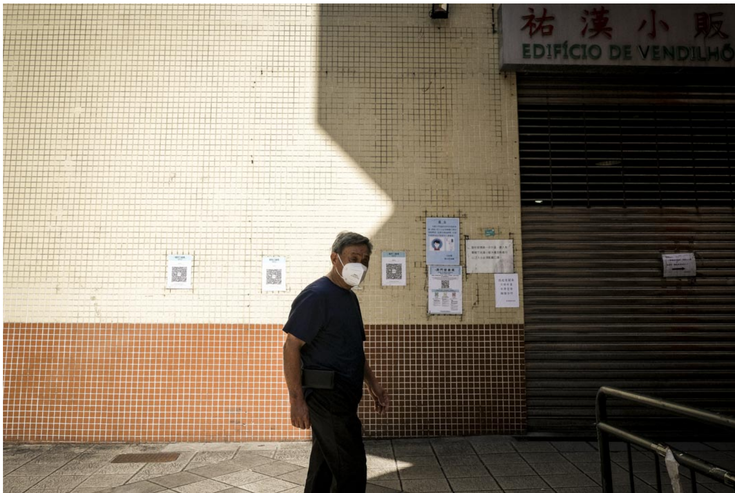
祐漢街市。