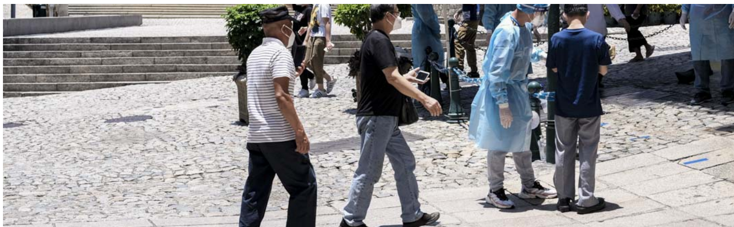
利玛窦中学核酸检测站（大三巴）。

早在2020年5月，澳门卫生局便推出健康码系统，予市民用于出入境和进入本地场所。当中绿码表示与肺炎个案无关；黄码指自我声明中出现症状、需要自我健康管理的人士；而红码则为确诊肺炎人士、密切接触者、或近期曾到过高风险地方的人士，不可外出。随后，当局亦加设金框、银框、紫框于健康码外，代表已接种疫苗的剂数。