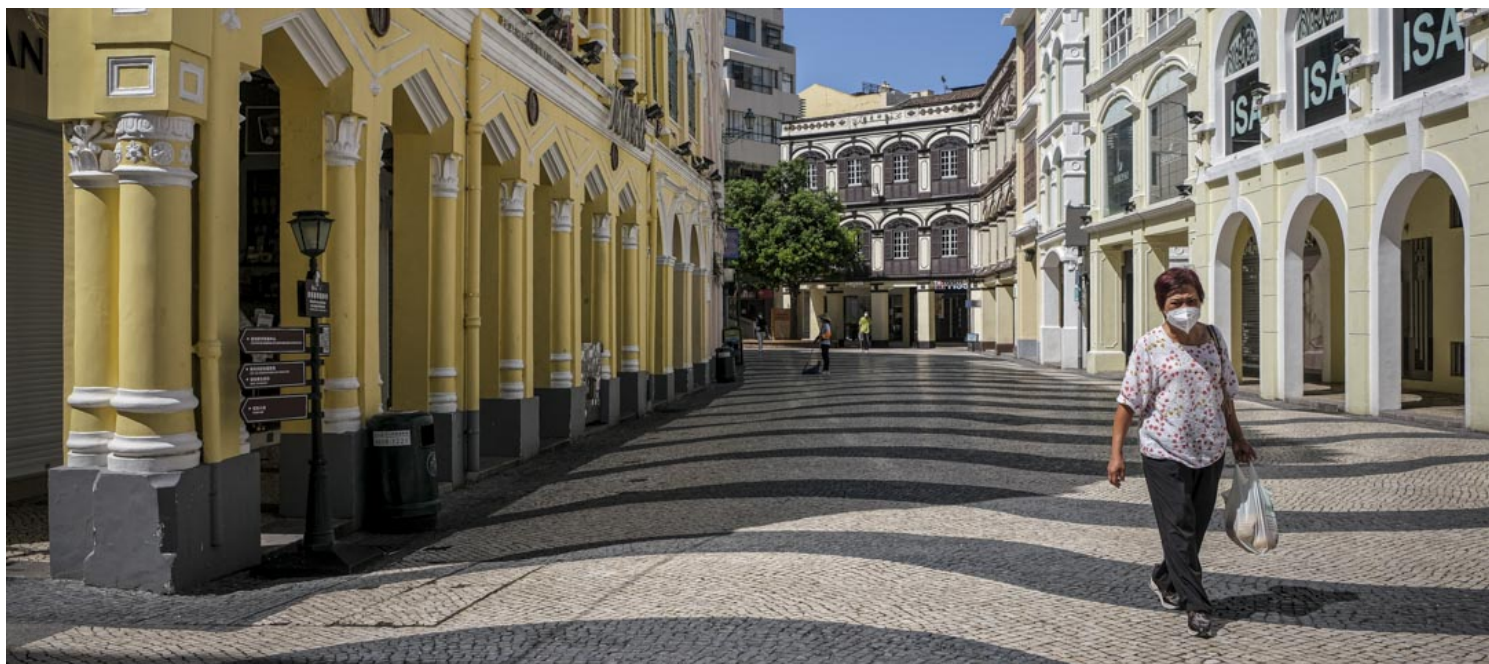
议事亭前地。