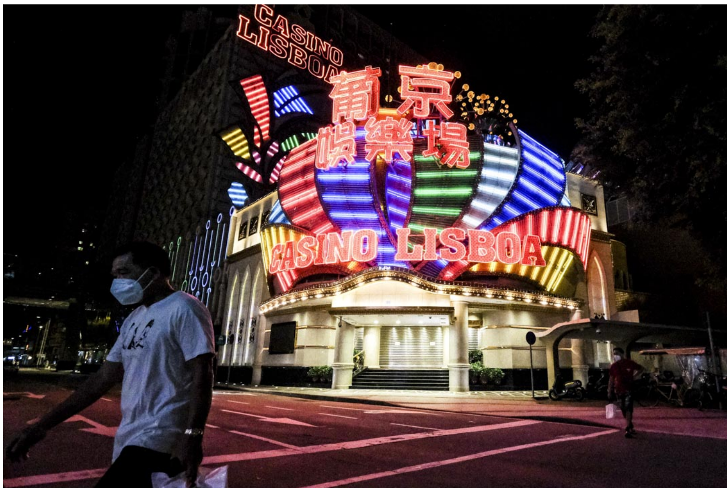
葡京酒店。

“相对静止”实行前一天，市民于超市排队大量购买生活所需。街上亦涌现人流，呼吸着“静止”前最后一口“自由的空气”。