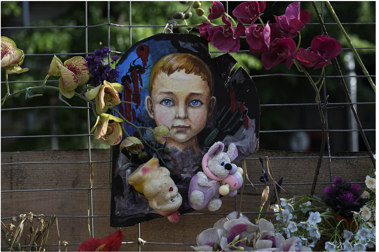
利沃夫市区，一面醒目的花墙上，纪念著死去的军人和平民。

从受训新兵到负伤老兵，从少女女孩到七旬奶奶，尽管精神压力或创伤巨大，但他们，都不允许自己展现脆弱。