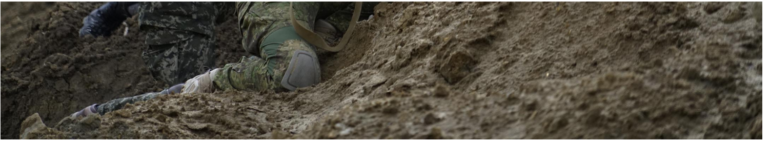
“圣母峰”训练营的实战射击场，年轻新兵，有男有女，持枪练习团体埋伏与围攻。

这个新兵训练营的代号是“圣母峰”（Everest），位于利沃夫近郊仍有工厂运作之处；训练营在2月24日俄国全面入侵乌克兰后成立，由乌克兰国防部批准，自发带领训练的，则是一群战斗经验丰富的军人。资金和训练器材主要来自个人和民间团体，他们要替国家在短时间内，训练更多有能力承受战争前线压力的新兵。