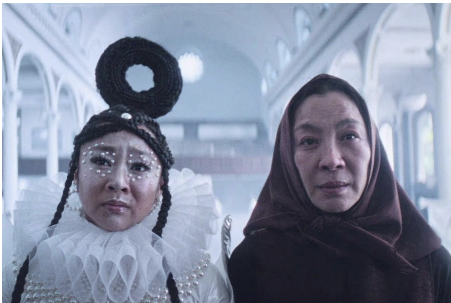
《妈的多重宇宙》（Everything Everywhere All at Once）剧照。