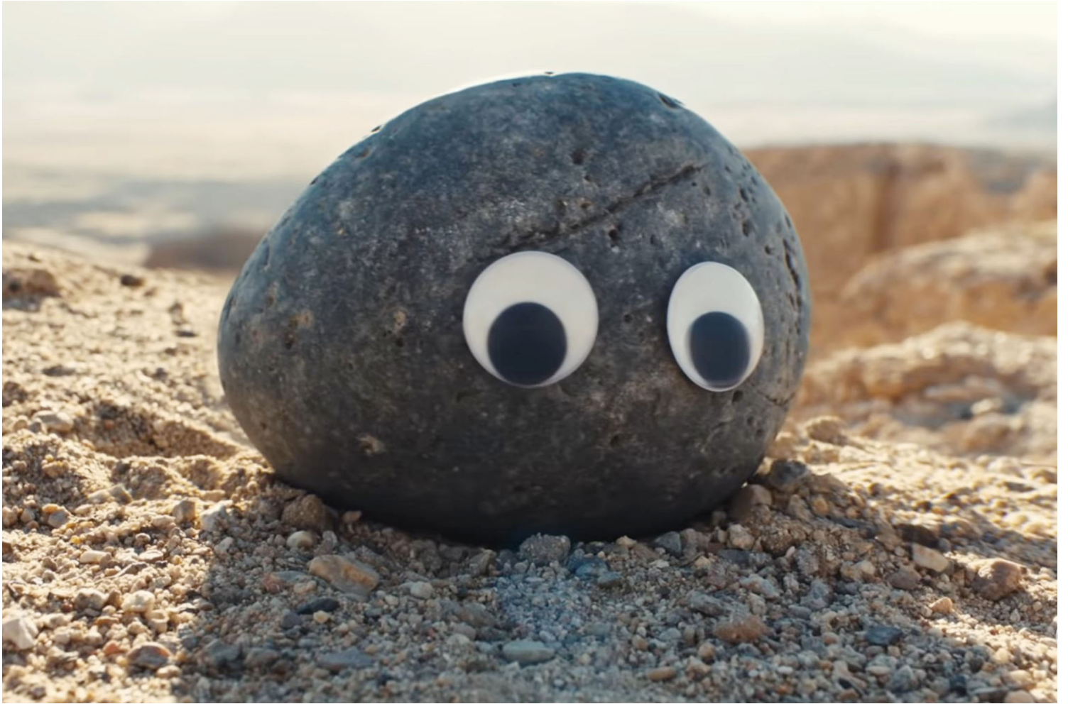
《妈的多重宇宙》(Everything Everywhere All at Once) 剧照。网上图片