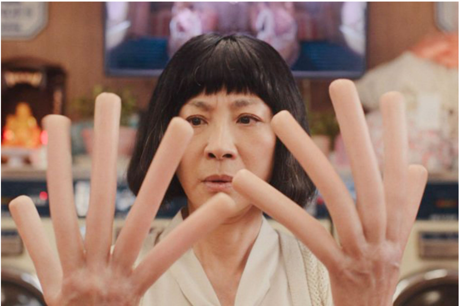
《妈的多重宇宙》（Everything Everywhere All at Once）剧照。

所以说这个电影我觉得很棒的就是，它用一种科幻的技巧，然后把移民应该拥有的这种多重世界跟不同的选择放在一起，而且有一种修复的功能。