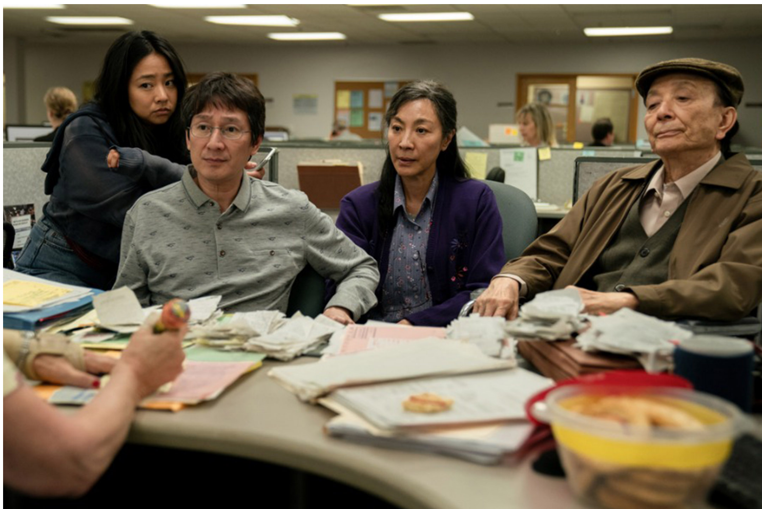
《妈的多重宇宙》(Everything Everywhere All at Once) 剧照。

但《妈》这个电影我是觉得很Asian American，因为他还是回到一个生长在美国的少数族群文化下所面对的议题，而也没有放弃去处理在亚洲多样性的议题，所以可能像近年有一些电影，像韩裔美国人那个叫Minari，《浓情家园》，台湾翻《梦想之地》，我觉得它的叙事线就没有像妈的多重宇宙这么样的，对于Asian American两个叙事线都有融合。