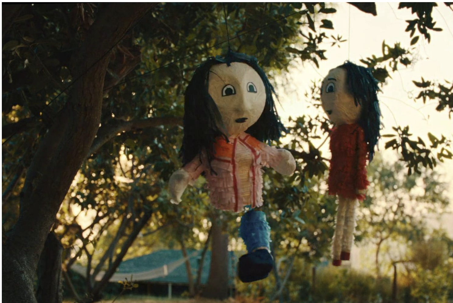
《妈的多重宇宙》（Everything Everywhere All at Once）剧照。

第二个就是那个贝果的宇宙。因为他把很多新世代（new age）的，又要吃素啊、又要修练啊、又要吃那些吃不饱的贝果的新生代的梗都玩了。结果Joy就变成一个大魔王，然后她就像Lady Gaga一样在那边讲很多事情，而那个贝果（的意义）是很深刻。所以我就没有再管人类。