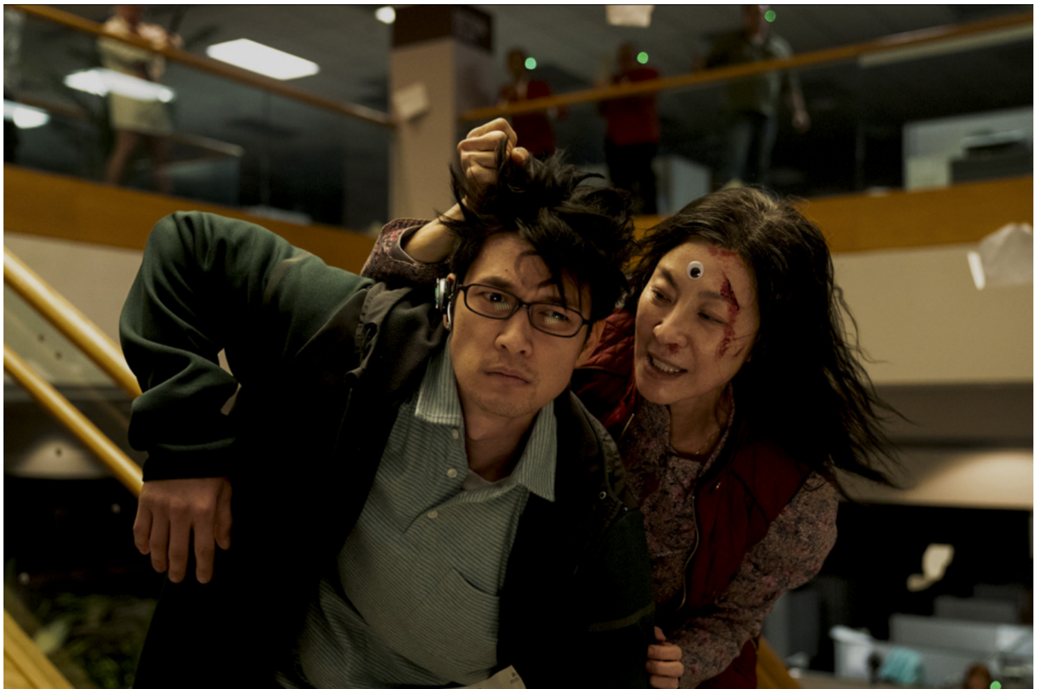
《妈的多重宇宙》（Everything Everywhere All at Once）剧照。

刘文： 对，如果要被美国大众理解，她不会是一个很含蓄（subtle）的眼神或拥抱，她一定要“讲出来”，就是我的女儿是lesbian，对不对？要有一个宣称，她才可以被理解，噢对，这个母亲她接受了女儿的性向，才能够到达那个地方。