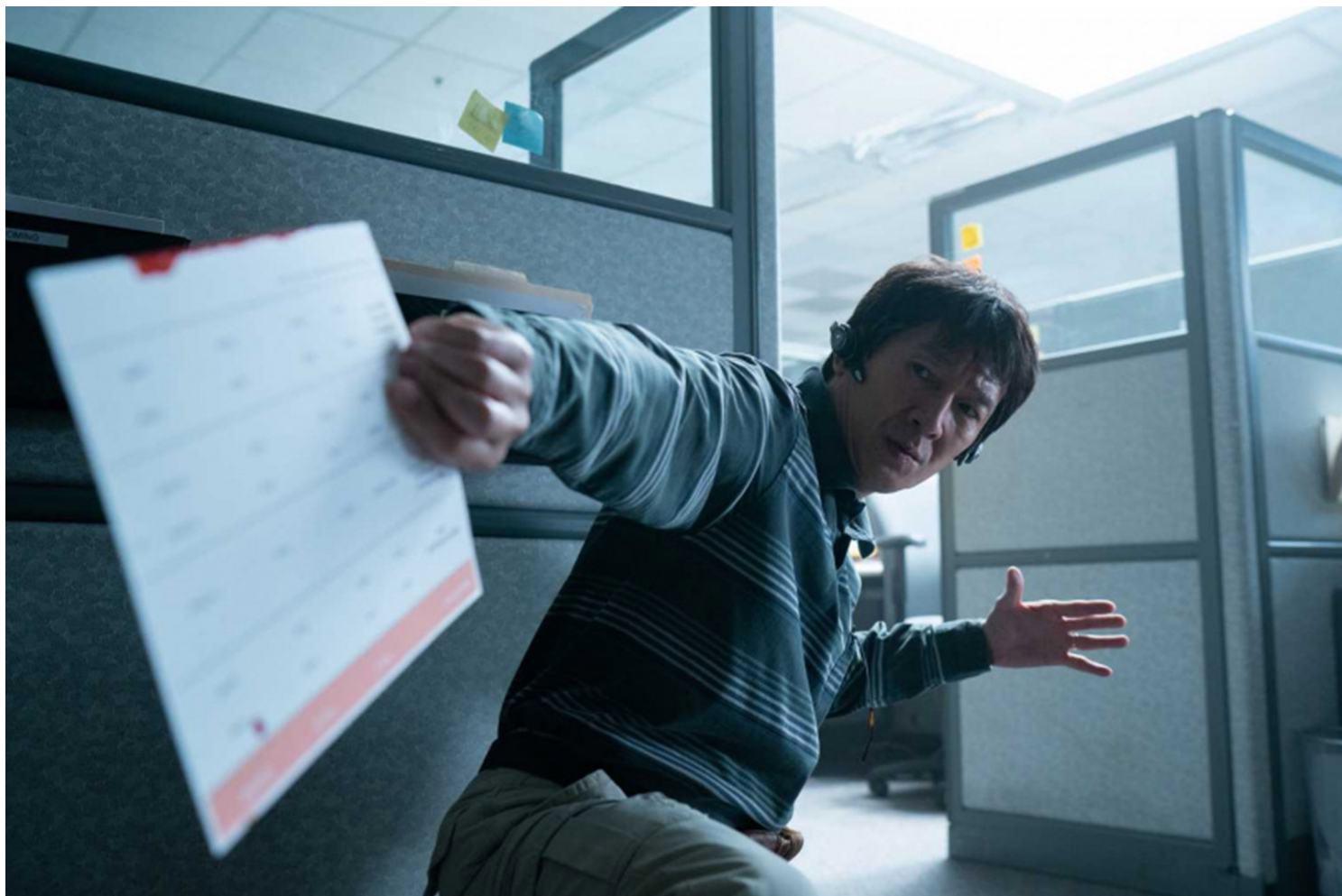
《妈的多重宇宙》（Everything Everywhere All at Once）剧照。

取后者的归属是一个多力的、可能是以网织有可能走互相的考量过来的，以及观众的需要，对米玛的电影法则里面，观众最后的情绪归属是一个电影能不能成功的一个很重要的东西。那在他们的这个思考里面，他的落点就是最后母女还是相爱著，就这样。