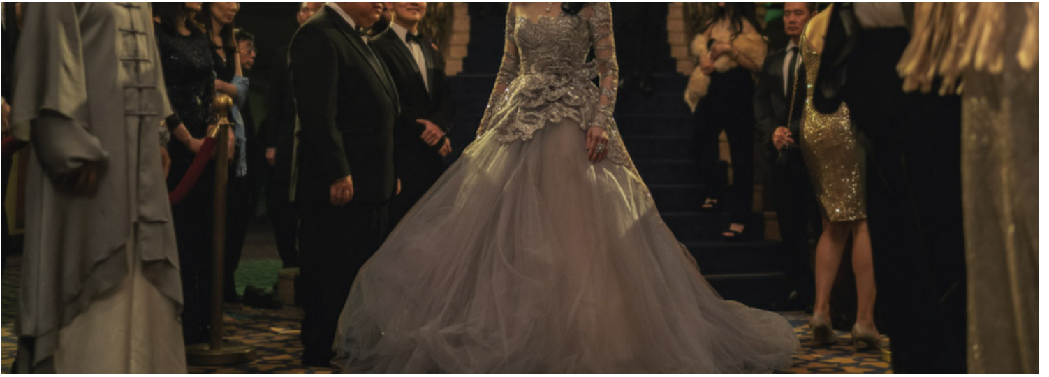
《妈的多重宇宙》(Everything Everywhere All at Once) 剧照。网上图片