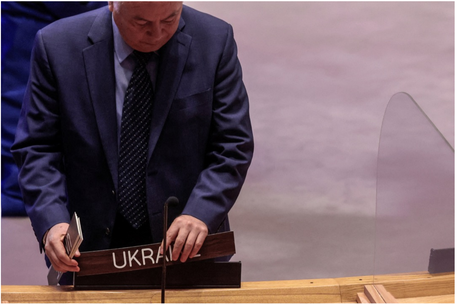
2022年4月11日，美国纽约市联合国总部大楼，一名职员将“乌克兰”的名牌放在会议枱上。

如此说来，假设拜登如他希望效仿的罗斯福总统那样改变国际体系，那么就至少必须成功地解决三个政治问题：第一，得到一个绝大多数国家，尤其是大部分常任理事国都不反对的新常任理事国名单；第二，在联合国大会上得到足够多的国家——意味着尤其是亚洲非洲和拉丁美洲国家——的支持；第三，把可能形成反对的常任理事国在道德和投票上都逼到边缘。