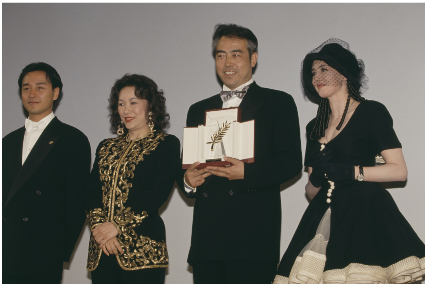
中国导演陈凯歌凭电影《霸王别姬》获得第46届戛纳影展金棕榈奖。