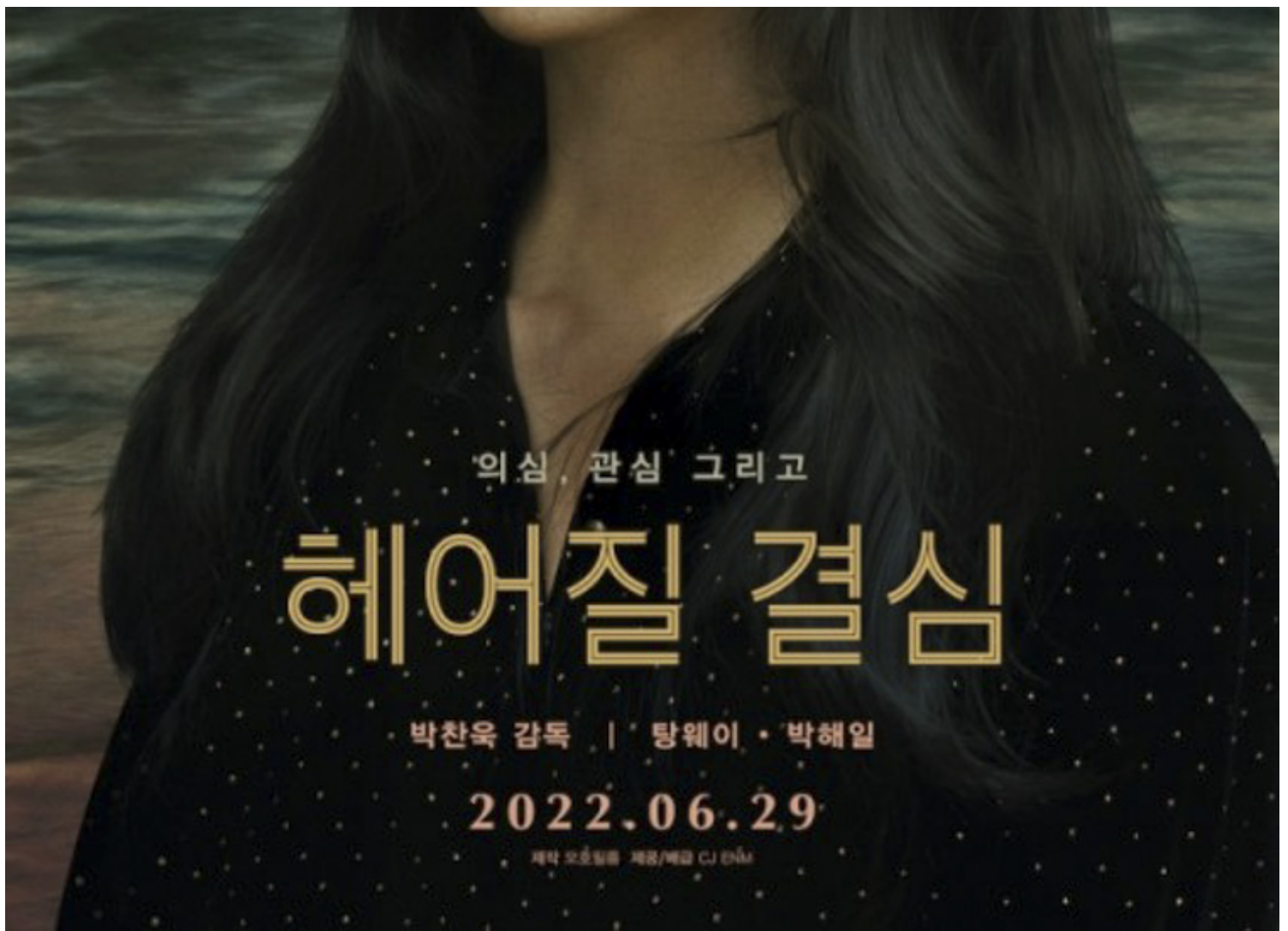
《分手的决心》电影海报。