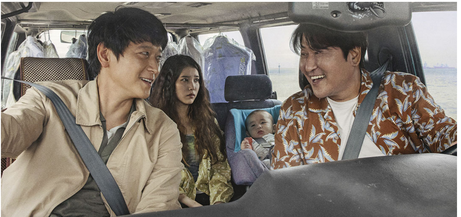
《掳客》电影剧照。