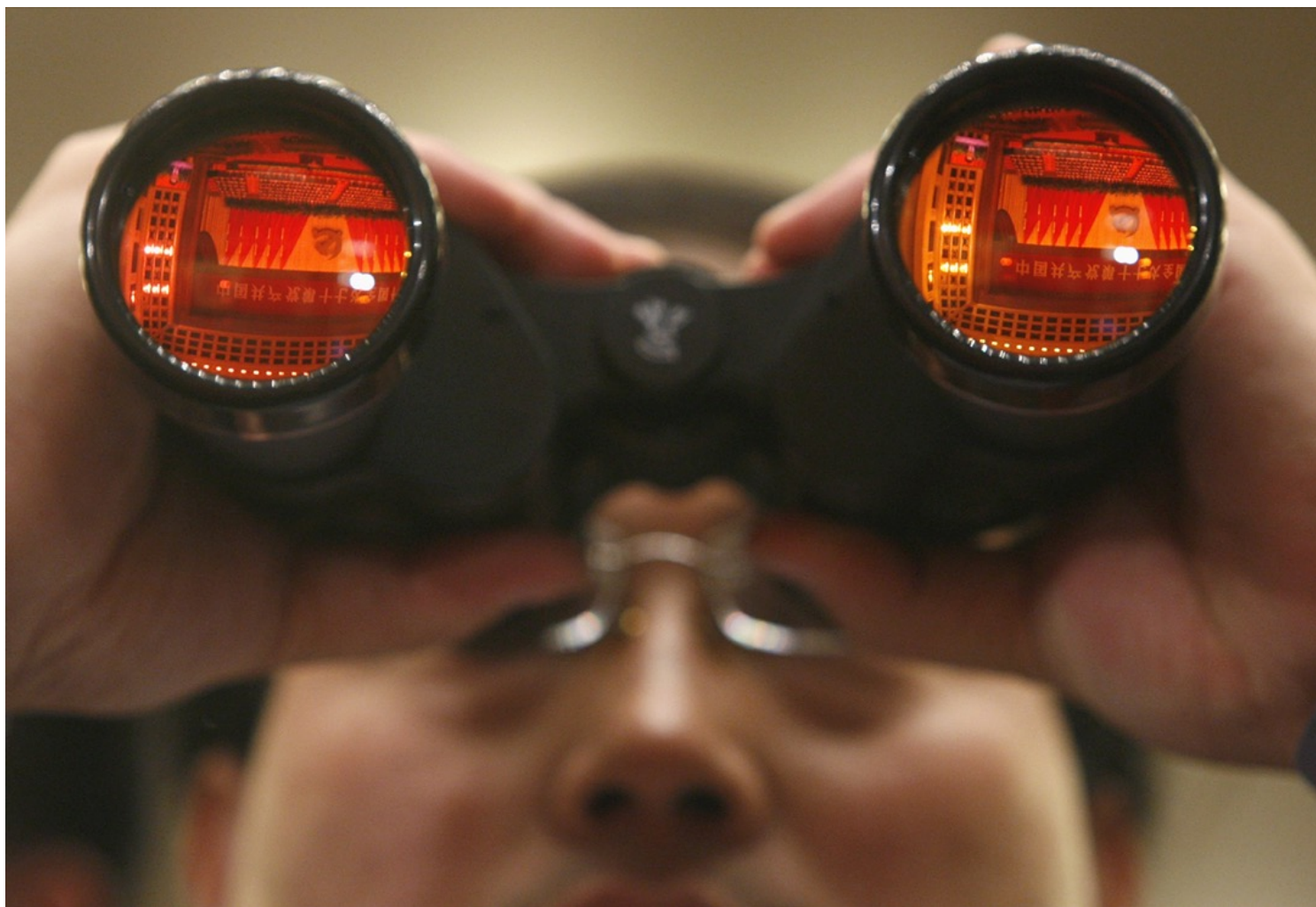
2007年10月15日，北京人民大会堂，中共十七大开幕，一名记者透过望远镜观看台上状况。

毋庸置疑的是，在这样的游戏当中，也有一些质量很高的自媒体账号获得了关注度、流量和很好的收入，比如“六神磊磊读金庸”。但是，这样的账号只是自媒体生态中的少数。从数据上看，自媒体的主流是“占豪”、“视觉志”，以及很多你根本叫不上名字但流量巨大的账号。几年前，一个在山东农村里面出现的“农妇自媒体”公司，就组织了一大批农妇，为各大平台生产了大量内容，并赚取了不少的流量广告分成。虽然这家公司已经停业，但类似的内容工厂依然在全国各地不断生产质量可疑的内容。