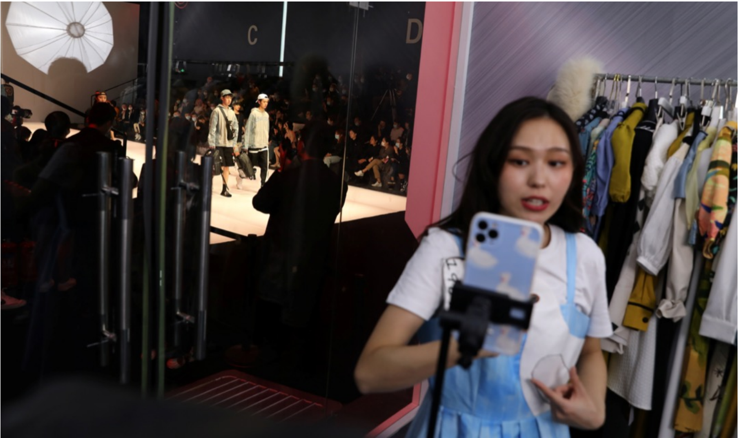
2021年3月31日，一名播主在北京一个时装展进行直播。

但是另一方面，自媒体行业的边界是具备高度限制性的——在这些文本中，没有任何人提到自媒体对于提升社会公义、促进政治参与等方面的作用，尽管这才是吉尔默提出“we media”的初心。那些尝试利用自媒体发起网络行动、推进公民参与社会议题的做法，在这个行业的从业者眼中更多是可能会耽误了自己挣钱的捣乱分子。