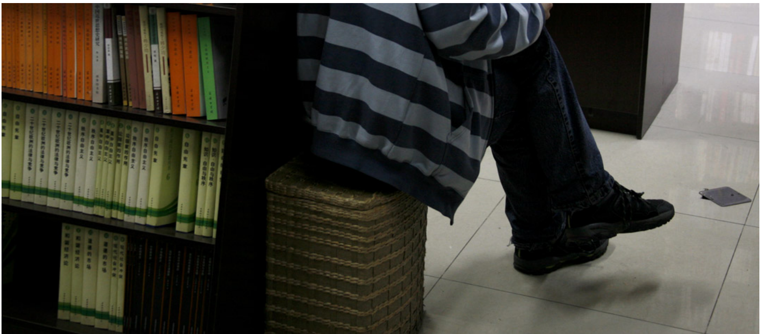
2009年3月25日，男子在北京一间书店看书。

去年的一天，快闭店时，一位经常给我送快递的中通快递员进来，让我给他推荐关于朝鲜战争的书。我说没有，但有类似的关于战争的书。我给他推荐了《国家记忆》《没有回家的士兵》《长沙会战》，但他都不太感兴趣。最后，他是真的认认真真的在店里看了很久，自己选中了一本《大唐狄公案》。结账时，我问他会有空看书吗，他回答说，没有也要挤出一点时间来。