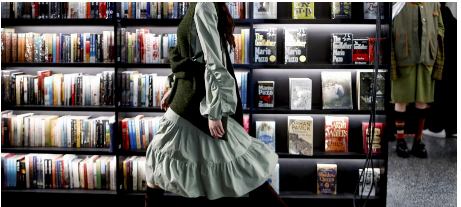
2020年5月6日，北京一间书店举行的时装秀。

去年，店里卖的最好的是杨本芬的《秋园》和《浮木》。它们也是位于我阅读清单上的两本书。在《秋园》中，80岁的女儿用非常平实的语言写了自己和妈妈的一生，有个人在动荡时代身不由己的荒诞，也有作为女人的身份被迫承受的双重苦难史。而我，仿佛在其中看到了自己的姥姥和妈妈。