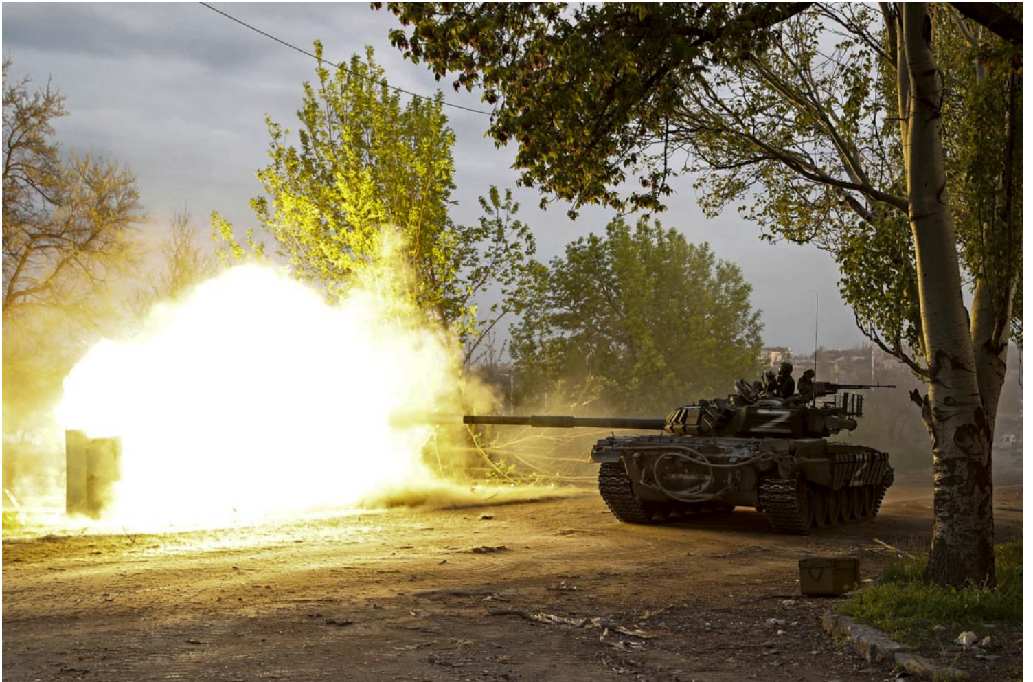
2022年5月5日，乌克兰马里乌波尔的亚速钢铁厂附近的冲突中，亲俄军队的服役人员从坦克上开火。