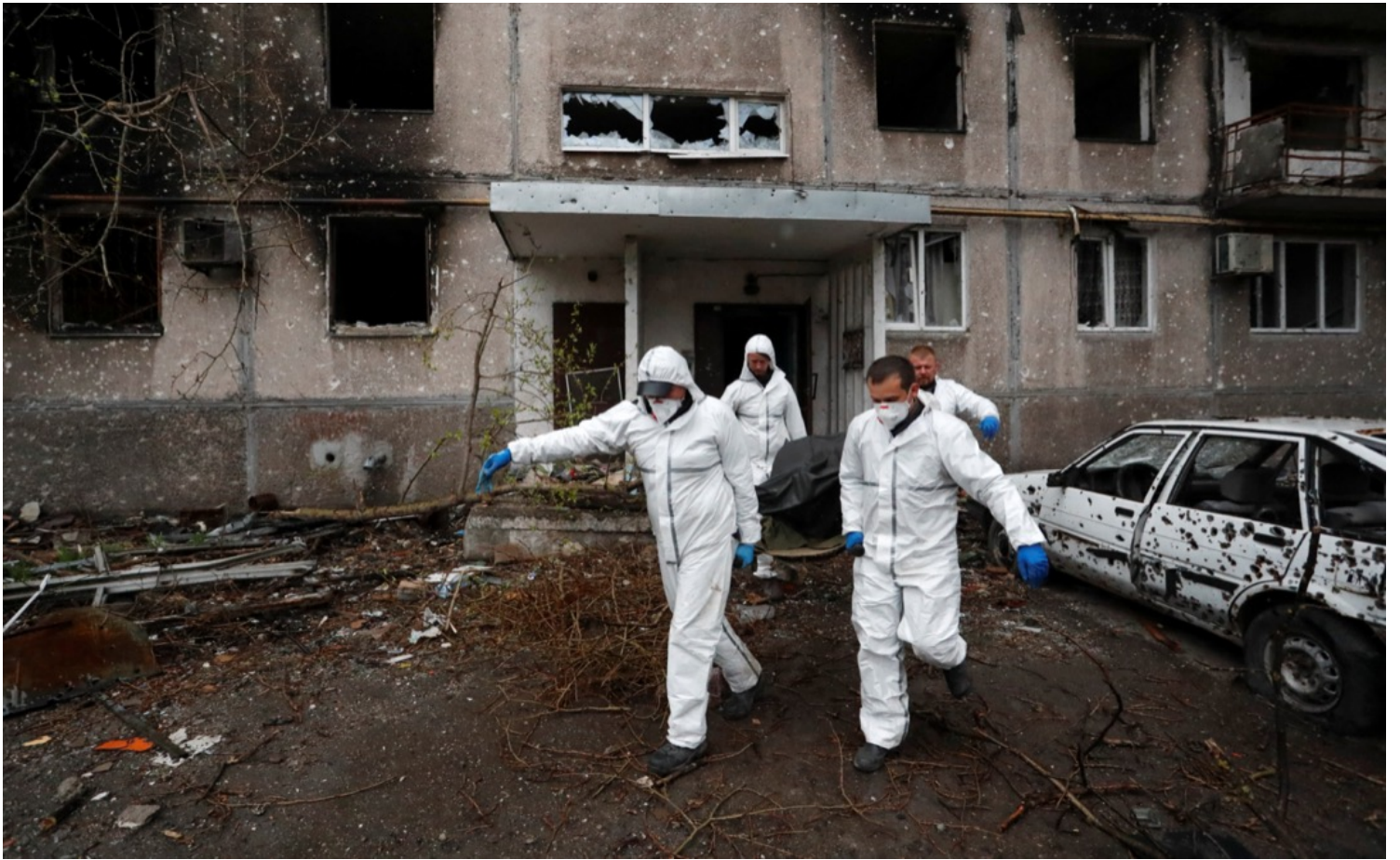
2022年4月21日，乌克兰城市马里乌波尔，数名遗体处理员在一座被俄军轰炸的民居内抬出一具居民的尸体。