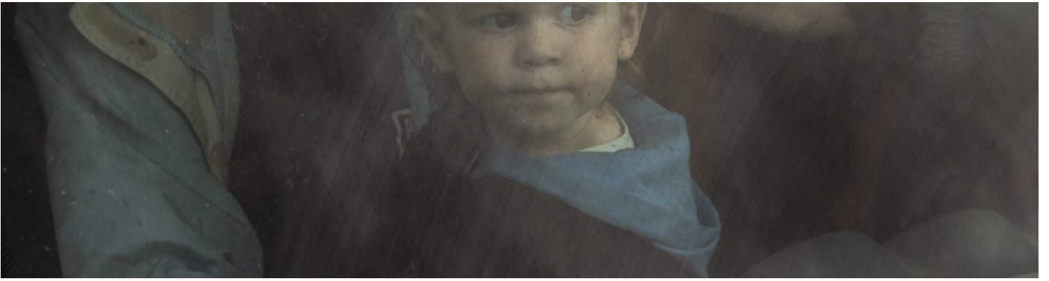
2022年4月23日，乌克兰城市扎波罗热，一个刚逃离马里乌波尔的家庭在扎波罗热市一个难民集合点等候登记。