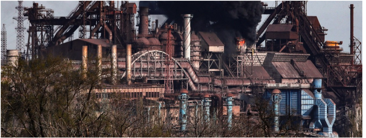
2022年4月25日，乌克兰城市马里乌波尔，持续被俄军轰炸的亚速钢铁厂冒出黑烟。