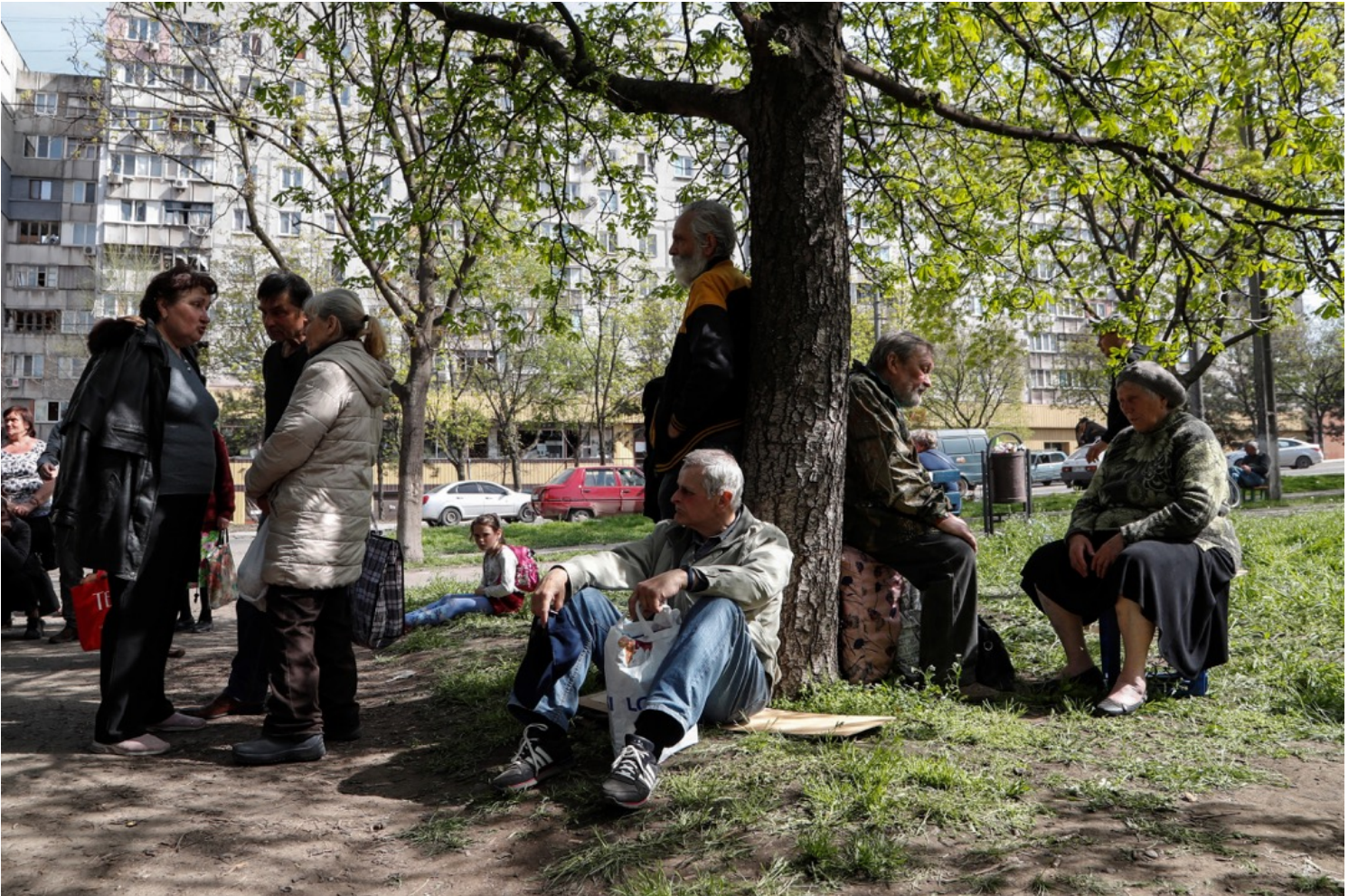
2022年4月26日，乌克兰城市马里乌波尔，市民到市内轮候登记申请援助金。