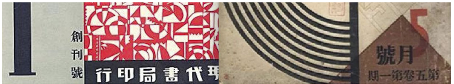
《现代》杂志。网上图片

这些仅仅存在于过去的世界，藉文字抵达我们，我们或摹仿，或批判，或颠覆，或遗忘，或在某个时刻蓦然想起。《现代》的存在，是我们作为中文写作者的种种幸运之一。而在大海另一边，日治下的台湾作家，也并未缺席《现代》这场短暂却豪华的盛宴。