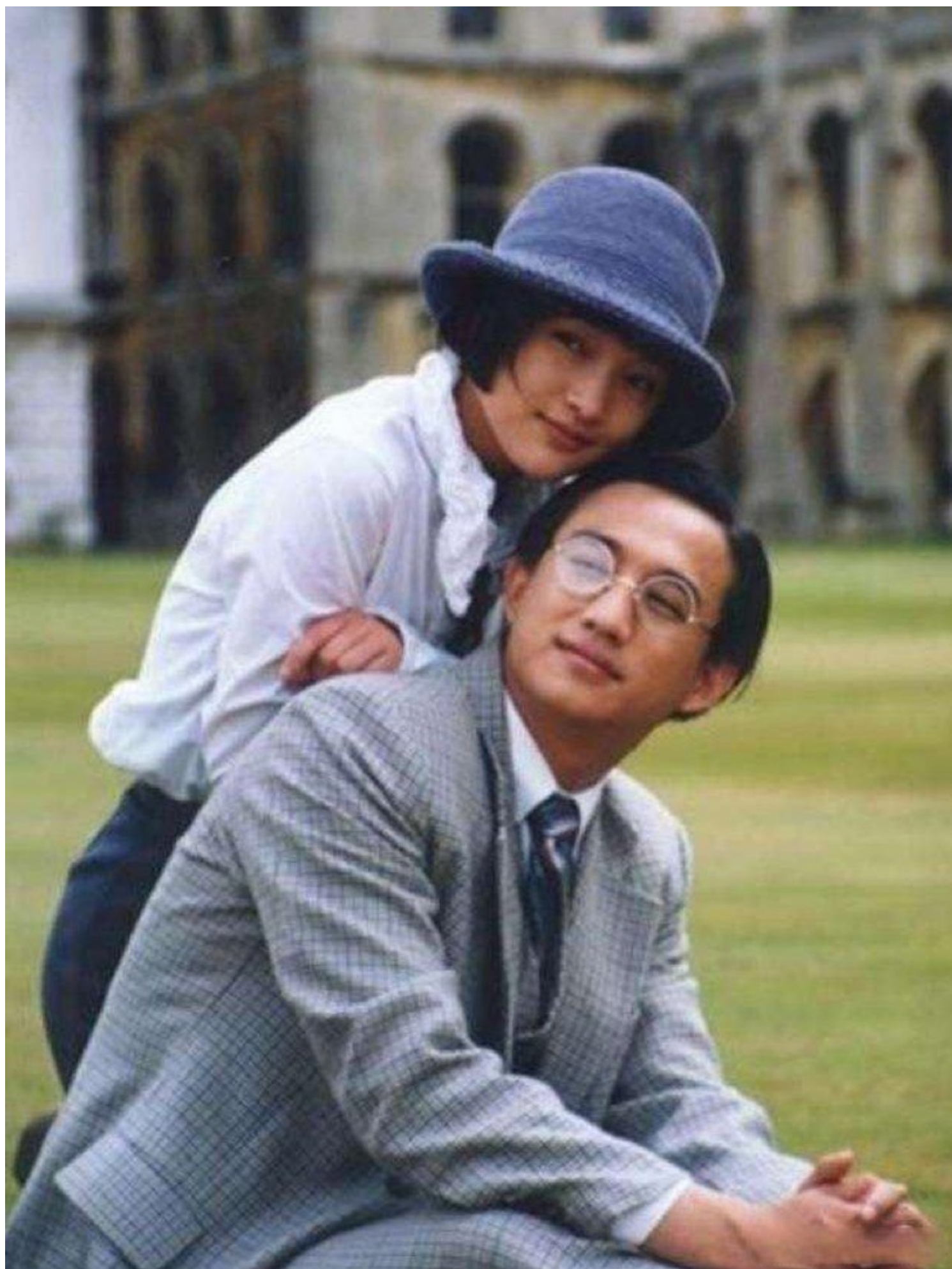
电视剧《人间四月天》剧照。