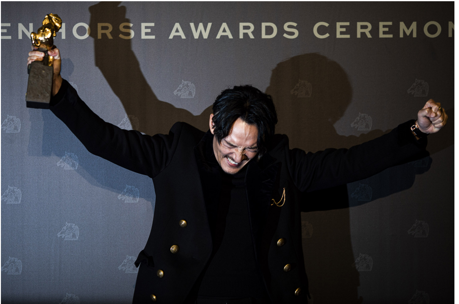
2021年11月27日台北金马奖颁奖礼，张震等待30年，以“缉魂”四度入围并摘下第58届金马影帝。