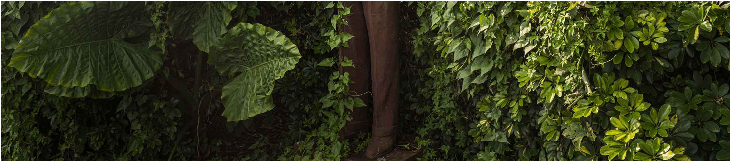
2021年9月19日桃园慈湖，一尊蒋介石像被山上的植物包围，转型正义在台湾实行，不少蒋介石像遭移走，一部分安置在慈湖的公园。