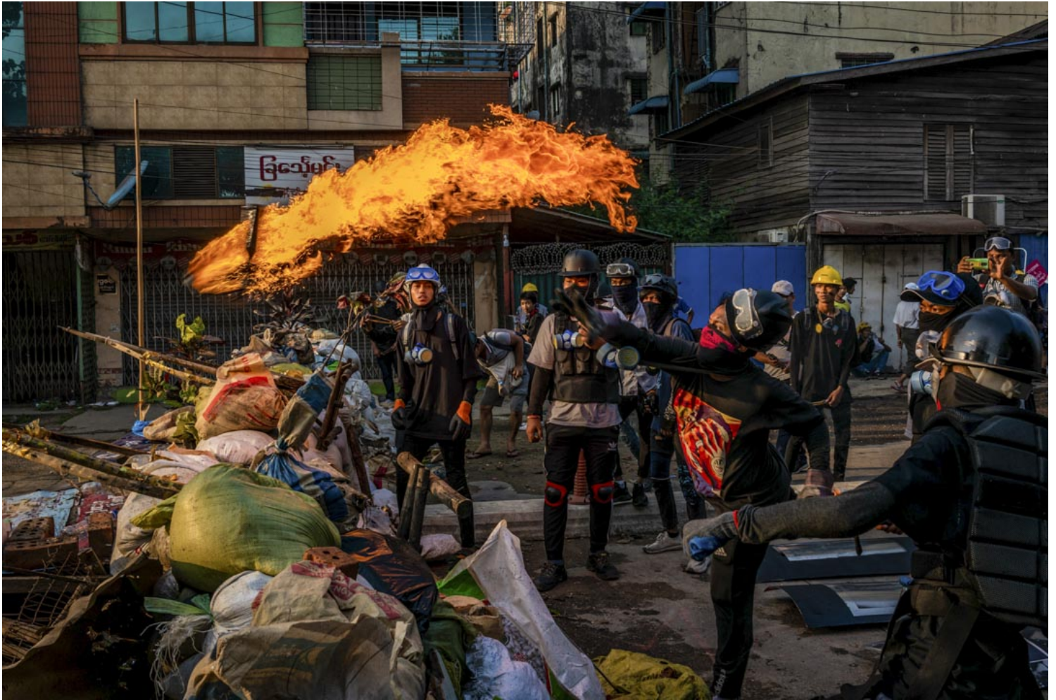
2021年3月16日，示威者在缅甸仰光一次冲突中投掷气油弹。