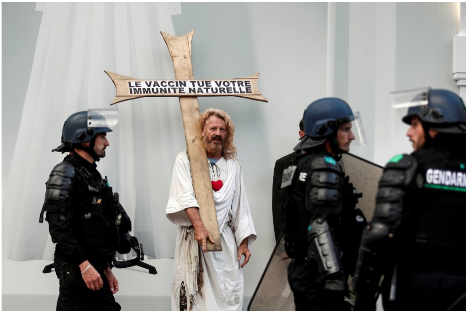
2021年7月24日，法国首都巴黎，一名打扮成耶稣的反疫苗通行证的示威者。

然而，在法国公共卫生法制上，以往其他强制接种的实施并非一定要配上〈通行证〉措施；在小城市，市民接种后会获得针咭，但这只作记录用途，而在大城市，强制接种记录被数据化，政府可用短讯等方法提醒市民续打防疫针，也可从数据库中得知谁人尚未接种。在强制接种实施下，〈通行证〉措施犹如多此一举，但偏偏马克龙在新冠疫情上就是不实施强制接种，而采用了将〈通行证〉立法以达至强制接种这暧昧手段；加上政府曾指有可能允许餐厅或公共场所保安检查市民的身份证明文件和〈疫苗通行证〉，再度引起公众恐慌和哗然，有评论更认为这会酿成「全民监控」的极权式统治状态。最终，总理卡斯泰出来澄清「只有在极度怀疑〈通行证〉为伪造的情况下才能要求出示身份证」。而更讽刺的是，〈疫苗通行证〉在立法通过和真正实施不到数星期后，马克龙在本年三月三日宣佈参选时，也同时宣佈取消大部份〈疫苗通行证〉措施内容，解除了为期两年的锁国封城状态。可是，这些措施而造成的社会撕裂始终没法填补。