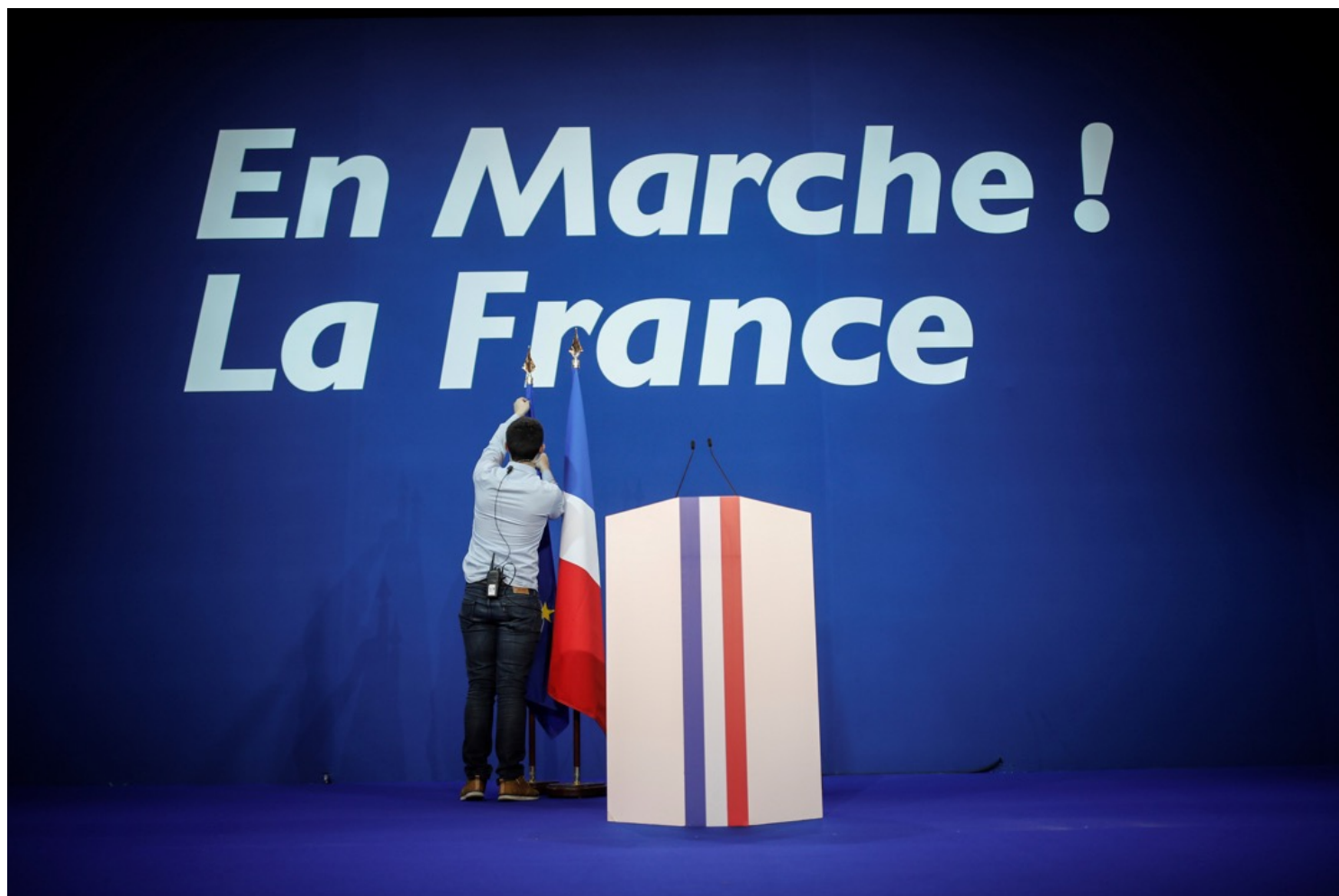
2017年4月23日，法国总统大选，候选人马克龙预备在首都巴黎一个会议展览中心举行造势大会，以「前进！」为竞选口号。

沙德和皮尔克勒指出，马克龙希望参照柏拉图《理想国》下所描绘的「哲学家王者」（philosopher king），既不拘泥于财富、名誉，亦不需在乎俗世眼光和诉求，以精英王者之态实现通向理想国度的改革。法国知名记者多米纳克（Nicolas Domenach）和史沙芬兰（Maurice Szafran）也在其著作《马克龙为何引来如此多的仇恨？》中提到，法国人骨子裡还是有嚮往明君的因子，因此早年对马克龙的「哲学家王者」形象颇为受落，认为他是政界清泉，并能一洗法国社会的政治歪风。马克龙上任初期积极鼓励文化多元（multiculturalism），并批评法国于阿尔及利亚的殖民历史，又走访贫民区和公屋区，与非洲新移民以「yo」字手势合照，一系列的革新举动引来保守派猛烈评击，并指他损害了总统高贵形象。