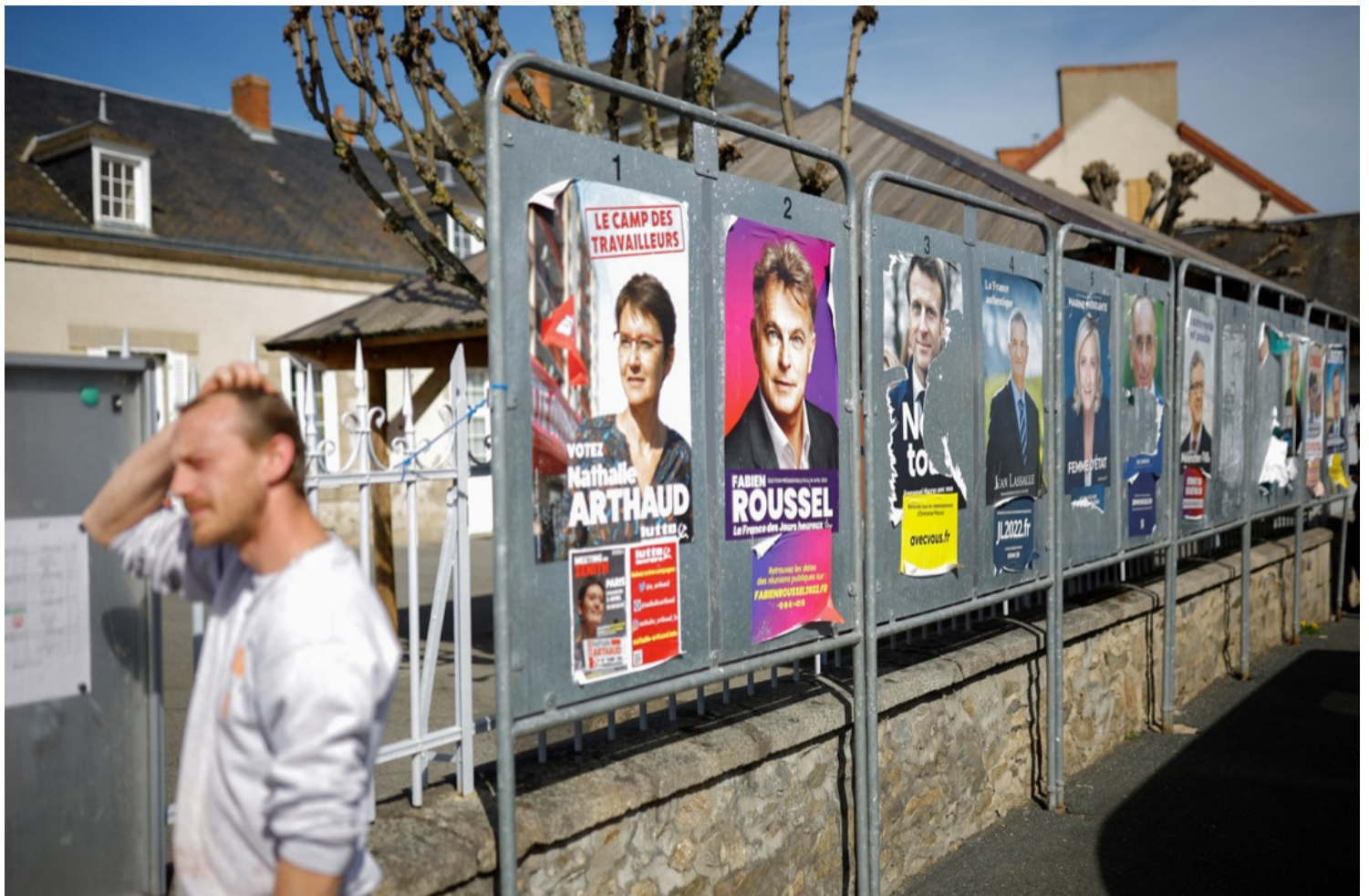
2022年4月11日，法国总统大选首轮投票翌日，法国中部城镇古宗（Gouzon），一名当地居民走过一块贴满候选人海报的告示板。

第二，左翼内部分裂以致众多左翼候选人都显得毫不吸引，由于候选人选择太多，而他们的政纲内容又极为相近，加上部份参选人缺乏个人魅力，导致每个候选人能进入到第二轮大选的机率极微。这样一来，左翼选民就没有意思去动员配票了。第三，前社会党总统奥朗德在上任前许下一大堆承诺，不但没有兑现，更是走上相反方向。以「社会公义」为先的社会党竟牵头私有化公共业务，放宽对市场的规管，甚至粗暴地立法削弱劳工权益，种种施政皆让左翼选民对社会党失去信任。此外，警暴问题在奥朗德任期中有恶化趋势，而由于2015年的恐怖袭击，奥朗德更实施了近两年的〈紧急法〉（état d'urgence）治国，对于左翼支持者来说，这无疑酿成一定程度的宪政危机。而最后一个解释是，法国左翼选民茶馀饭后都会提及「抵制极右」的策略；因此，为了对抗勒庞和泽穆尔（Éric Zemmour），不少左翼选民便会票投马克龙，以牵制极右势力，保存现状。