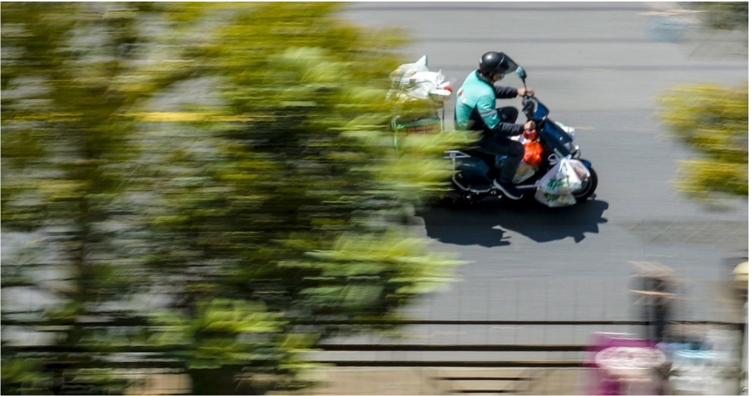
2022年4月3日，上海第二阶段封城期间，一名送货员在街上骑摩托车送货。

亲历隔离困境的上海人，在病例居高的情况下，更多务实的意见起码在不少朋友圈中形成主流：是时候调整抗疫政策。不是被动的躺平不顾，而是在持续低重症及死亡率的情况下，按实际的分层次应付。无症状或轻症者居家隔离，以免出现如现况一样，无症状者在隔离地方生龙活虎，医护人员却疲于奔命的反差。让资源重新调配，那意味可大幅集中重症的资源，以及维护非新冠病以外其他疾病医治资源，不致再出现因人手资源不够而致失救的人道悲剧。