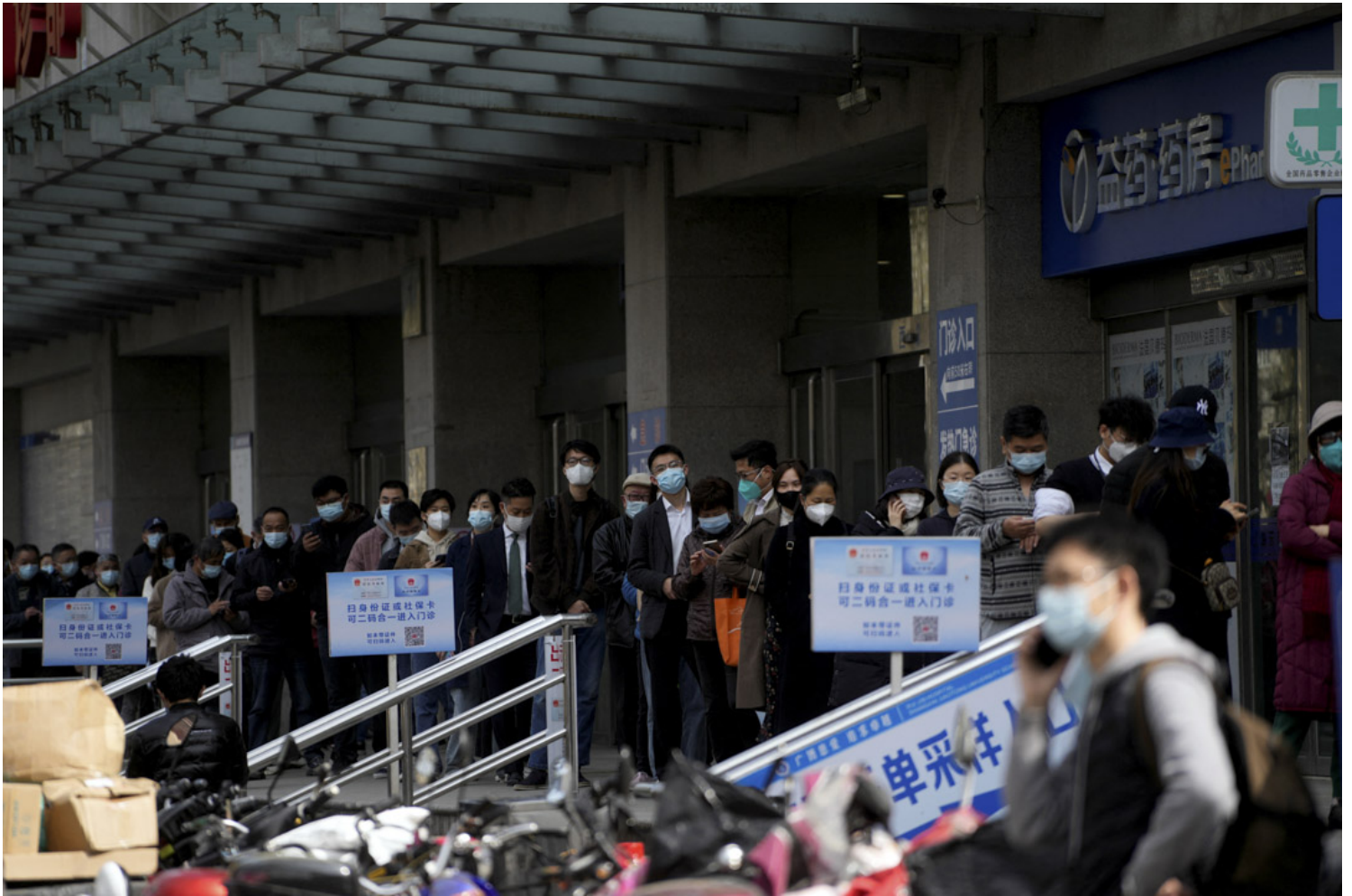
2022年3月30日，上海爆发COVID-19后，戴著口罩的人在医院外排队接受核酸检测。

而且稍为通情达理的人，当应有足够宽的视野，知道那时装秀并不代表上海众生。哗众的东西，只不过被无限放大。如果回到现实，我们不会看不见那些因没有核酸证明、而不被容许返群租房、而被迫露宿街头的打工阿姨，那些在旧区还要共用厨房而引至的高危交叉感染。