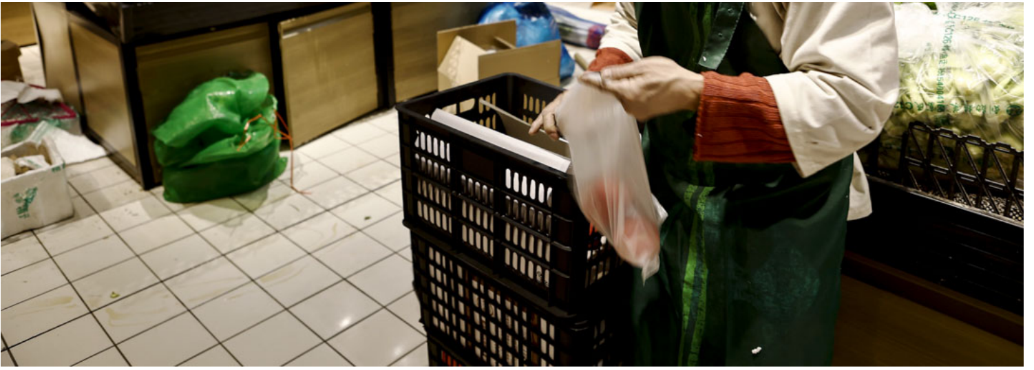
2022年4月1日，上海实施全市封锁以阻止 COVID-19 传播，一名员工在家乐福超市打包客户订单。