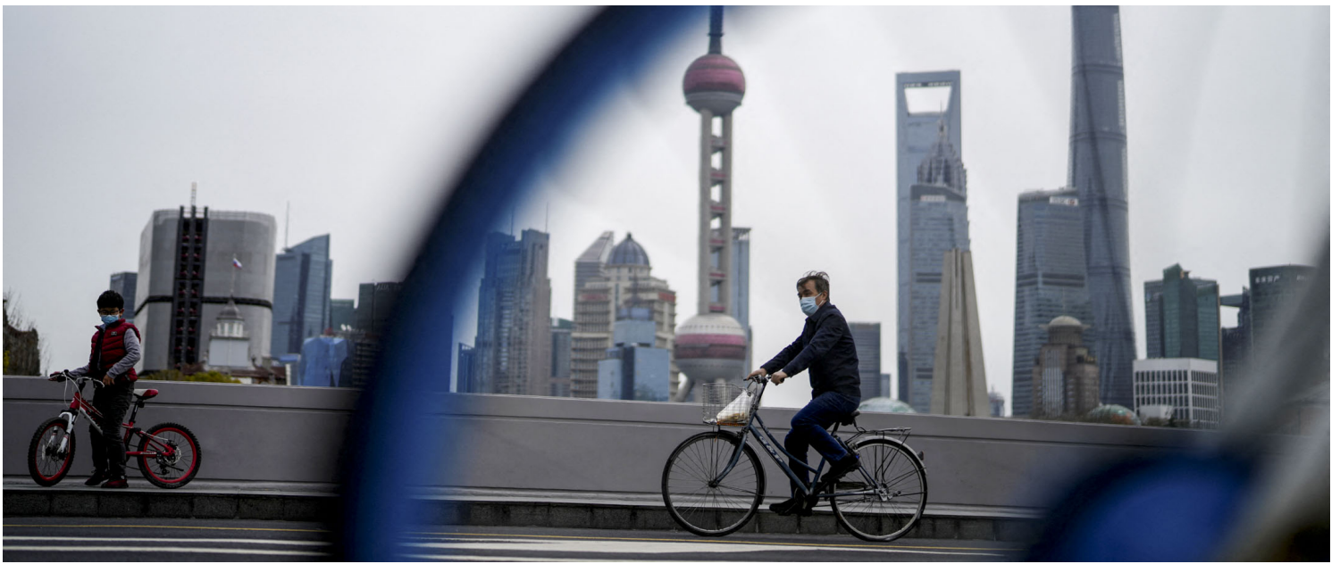
2022年3月28日，上海一名戴著口罩的男子在浦东地区前的一座桥上骑单车。