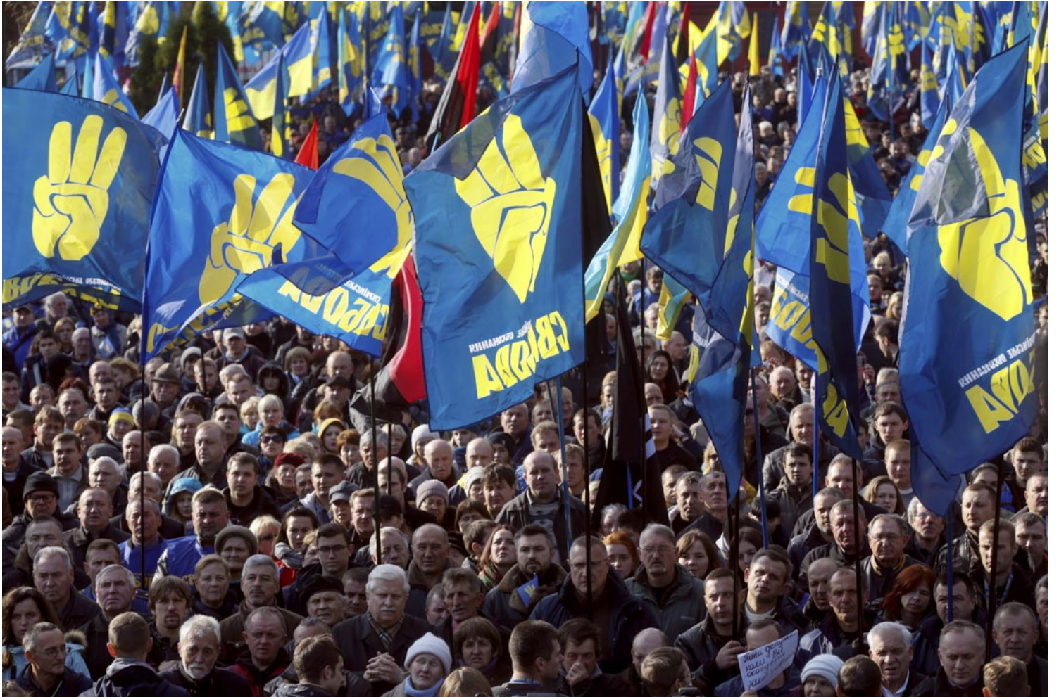
2016年10月14日，乌克兰基辅，全乌克兰联盟“自由”党举行集会，以纪念乌克兰保卫者日。

其中一位死硬派，乌克兰社会-国家党的奥列格·提亚尼波克，在2004年把社会-国家党改组为“全乌克兰联盟自由党”，并通过改变党徽、解散下属民兵组织“乌克兰爱国者”的方式，来显得自己更像一个温和的民族主义政党。然而自由党的主张一直有强烈的新纳粹倾向，他们不承认班德拉犯下种族屠杀，甚至会用暴力冲击和威胁来对付任何强调班德拉派反抗军是法西斯性质的活动。此外，他们还号称乌克兰是“白人之根”。