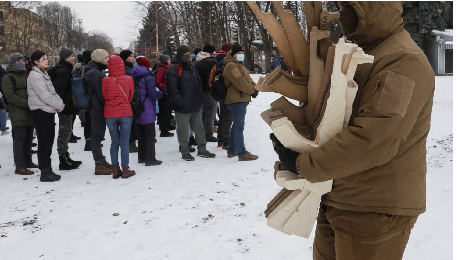
2022年2月6日，俄罗斯入侵的威胁下，乌克兰国民警卫队亚速营的一名退伍军人在基辅为平民进行军事演习。