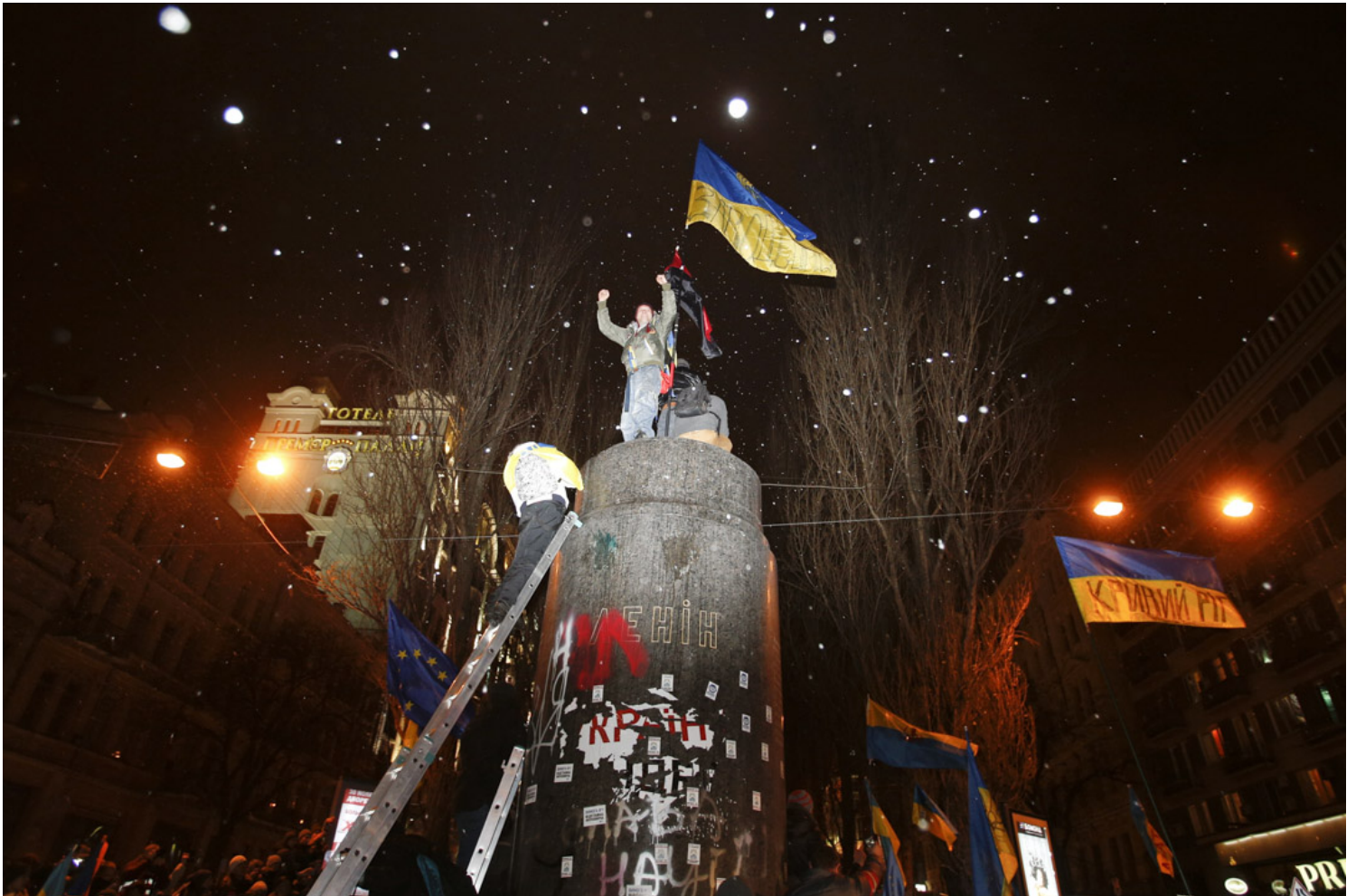
2013年12月8日，乌克兰广场革命，示威者推倒了前苏联领袖列宁的雕像并爬上了基座上。

这给了乌克兰足够的理由去憎恨苏联。体现在近年，广场革命中列宁雕像被拉倒，对苏联二战红军的纪念仪式也越来越淡化；2015年，乌克兰议会甚至直接将共产主义和纳粹主义并列为极端主义，并予以禁止展示相关符号。