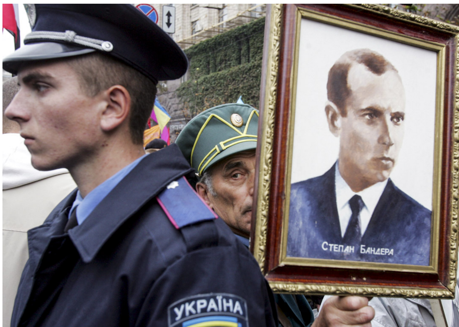
2005年10月15日，基辅市中心，集会期间爆发小规模冲突，战时乌克兰起义军 (UPA) 的一名老兵手持UPA领导人斯特潘·班德拉 (Stepan Bandera)的肖像，以纪念UPA成立63周年。

不过，也有几乎同样比例的人认为他是负面人物，亲俄的总统亚努科维奇也在2011年将其英雄称号取消。