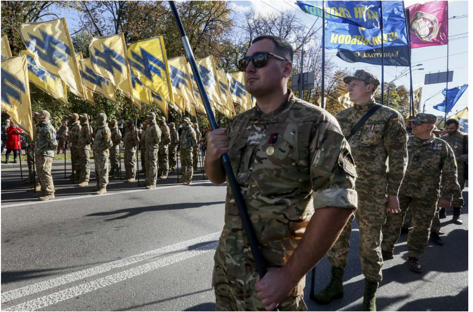
2020年10月14日，乌克兰基辅，乌克兰右翼“亚速”国民军，带著他们的旗帜参加乌克兰保卫者日集会。