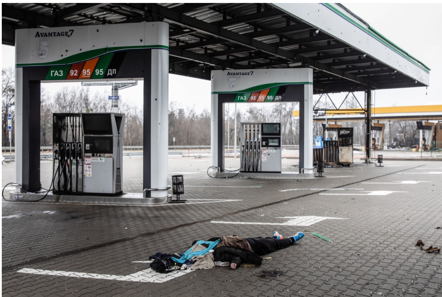
2022年4月2日，乌克兰城镇布查，一具尸体躺在公路旁的一个油站里。