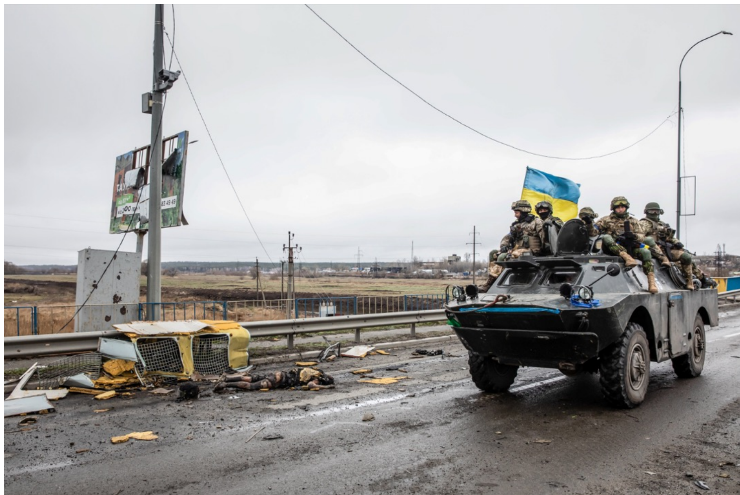
2022年4月2日，乌克兰城镇布查，一辆乌军装甲车在路上驶过，路旁躺著一具尸体。

人们先是在街道上发现散落的尸体，他们中的大多还维持著日常活动的状态：有的手里抓著购物袋，有的倒在自行车旁。也有相当一部分人双手被绑住，后脑勺中弹，似乎是被有组织的处决。完整的尸体表明，杀死这些人的不是炸弹，而是有意的枪击。倒在地上的他们，没有军装，没有武器，身著的是最普通的卫衣、夹克、运动鞋，与我们并无两样。