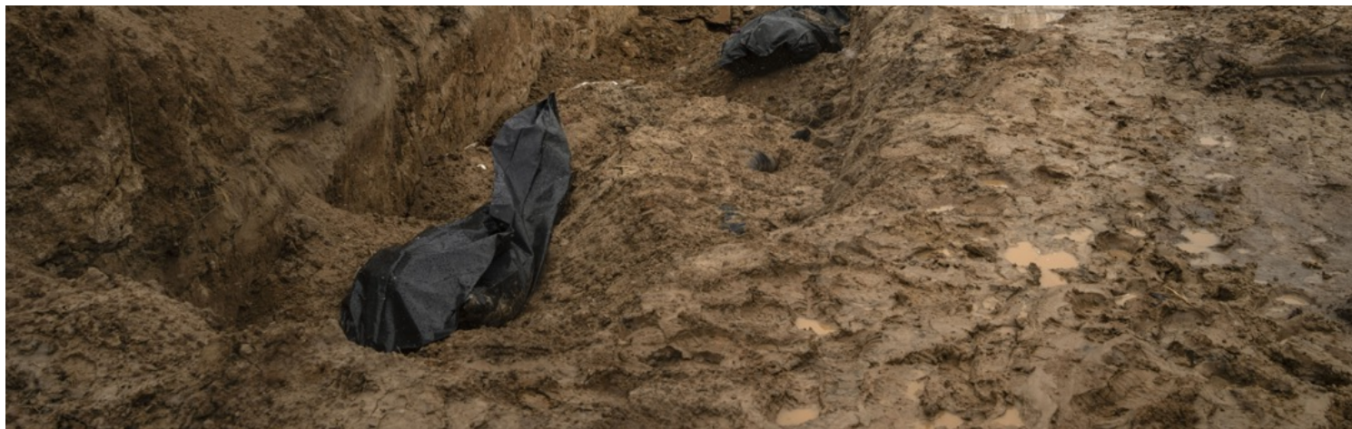
2022年4月3日，乌克兰城镇布查，一个乱葬岗里摆放著数具用黑色尸袋装起的遗体。