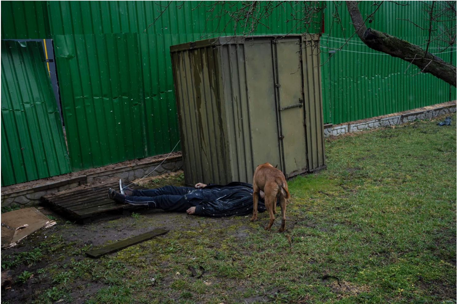
2022年4月3日，乌克兰城镇布查，一只狗走向一具躺在后院内的尸体。

进入布查，这些尸体皮肤呈淡蜡状，指甲深色，意味著应该无人处理很多天了。乌克兰总统泽伦斯基的顾问Oleksiy Arestovych说，这些街道看起来像是“恐怖电影中的场景”。与此同时，俄罗斯方面否认与布查的平民被杀案有关，并指责这是乌克兰在‘破坏和平谈判’。联合国秘书长古特雷斯发推表示对这些图片的震惊，并呼吁‘尽快进行独立调查’。或许，对于这些无法自愿选择结局，甚至没有办法好好安葬的平民来说，一份公平的调查结果是能对他们的最大慰藉了。