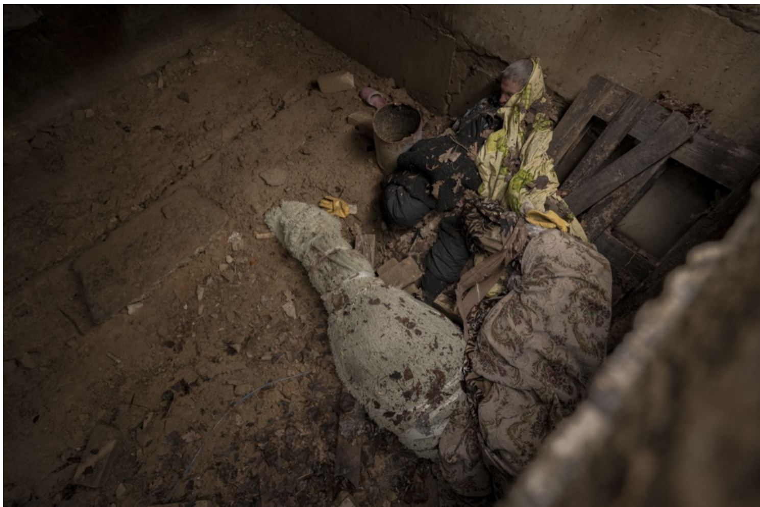
2022年4月3日，乌克兰城镇布查，被俄军杀害的平民的遗体被弃在一个地牢里。