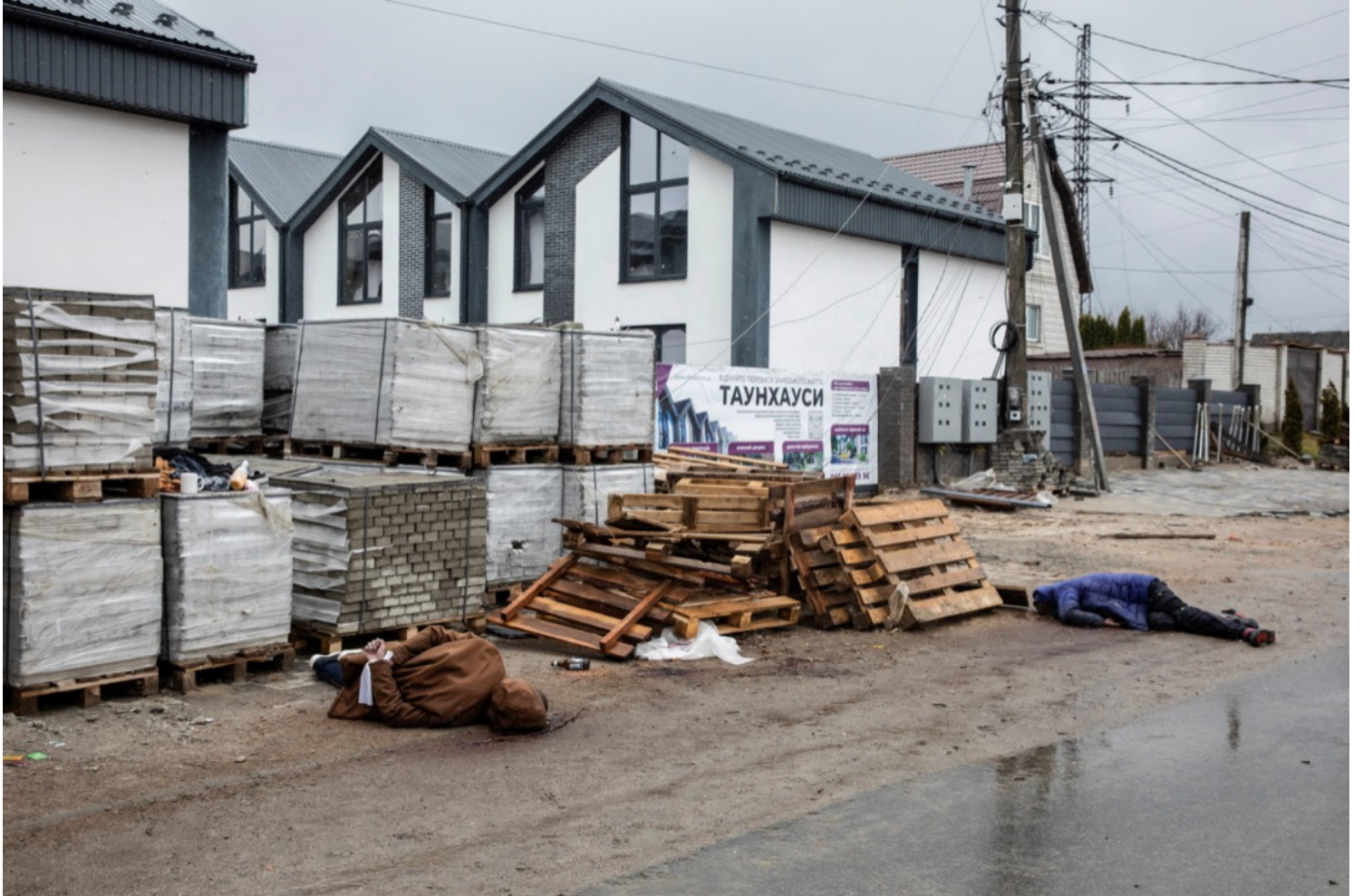
2022年4月3日，乌克兰城镇布查，两名被俄军射杀的乌克兰平民的遗体被弃在路旁，其中一人的双手被反绑在身后。