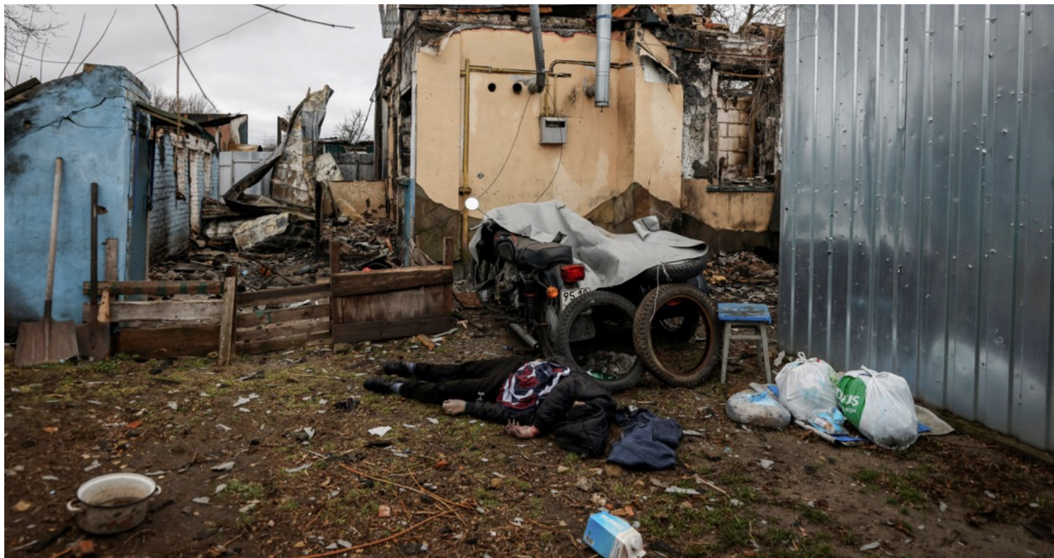
2022年4月2日，乌克兰城镇布查，镇内一所民居的后院内躺著一具尸体。