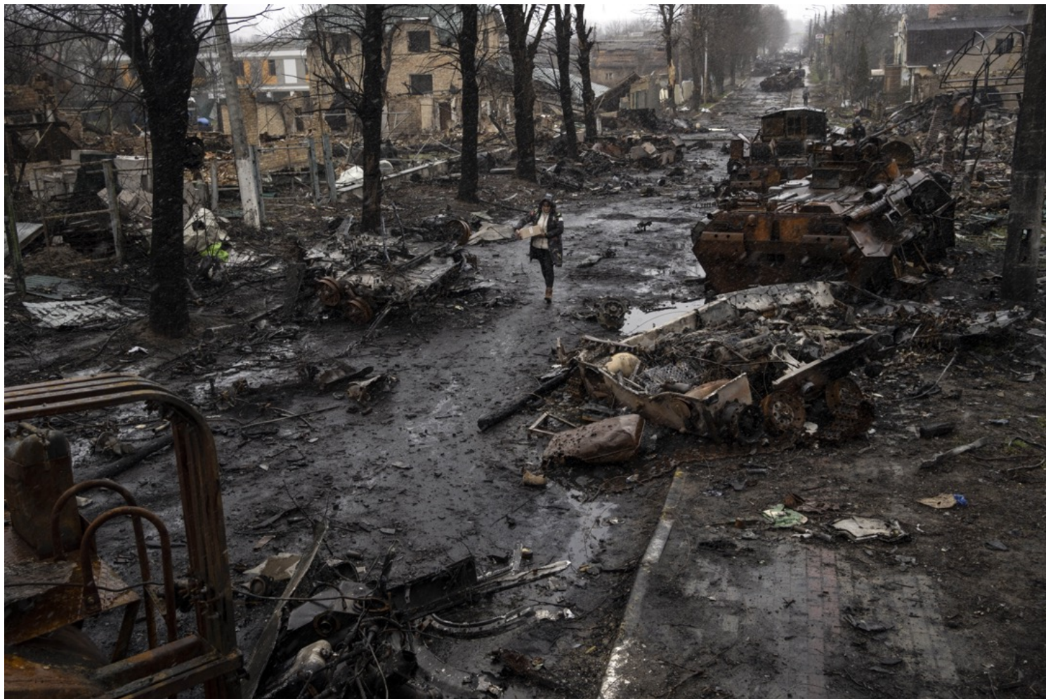
2022年4月2日，乌克兰城镇布查，一名女子在炸毁的坦克间走过。