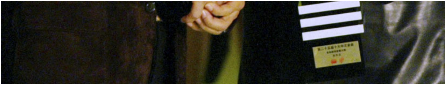
香港歌手张国荣与谭咏麟。

那位香港80年代的歌迷争风对手，今天变成一个糟老头。寻找寄情，我们只能寄托于早逝者的身上，至使我们不会被出卖。譬如家驹，譬如你，譬如梅姐。