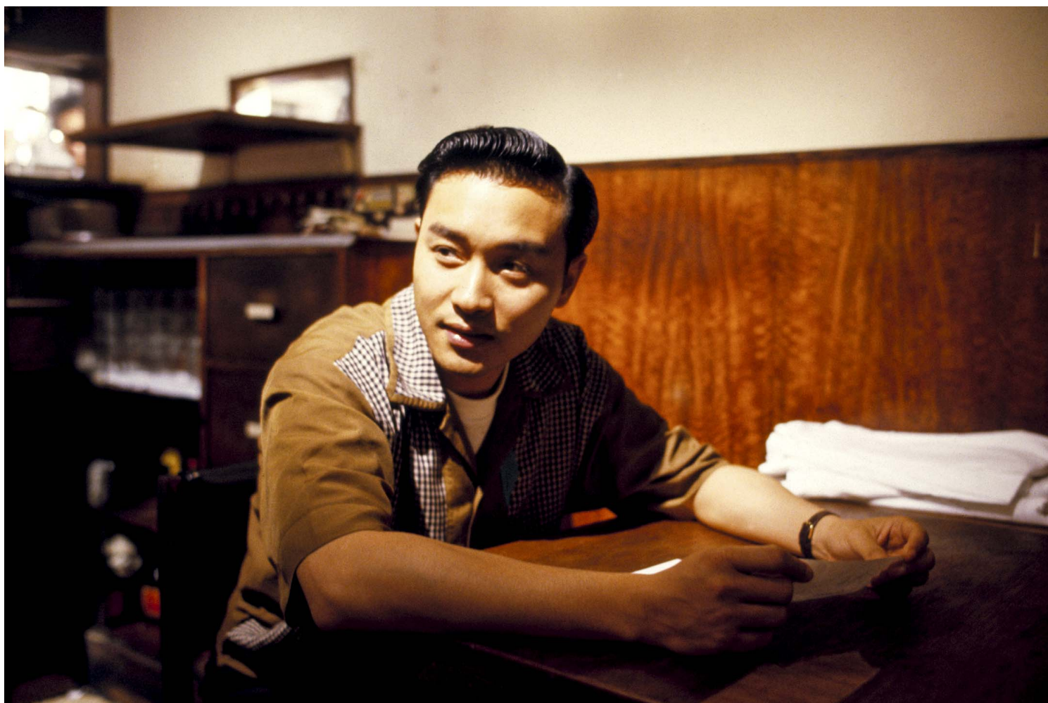
张国荣在电影《阿飞正传》的演出剧照。

那么多年后，红姑仍是那同代中保持得最美的女明星，不仅在外表，也在姿态。这个年头，谁还敢轻易的亲近旧日的金燕子，那怕曾经一起走过多少路。为何旧知己到最后变不到老友。