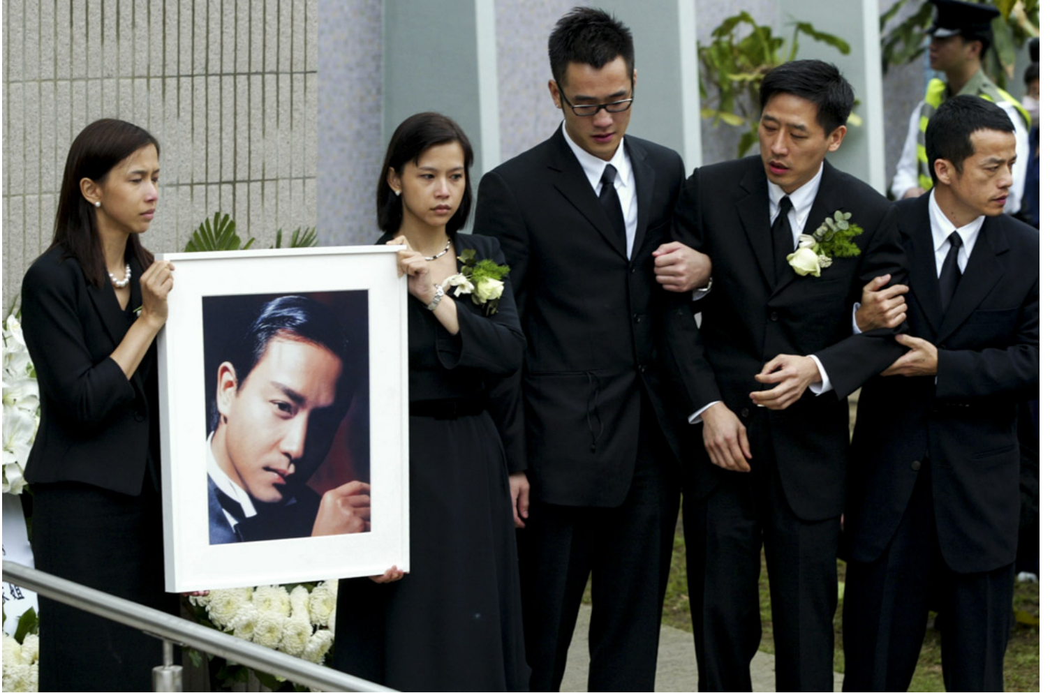
2003年4月8日，张国荣葬礼现场，家人捧著张国荣的遗照，送别哥哥。