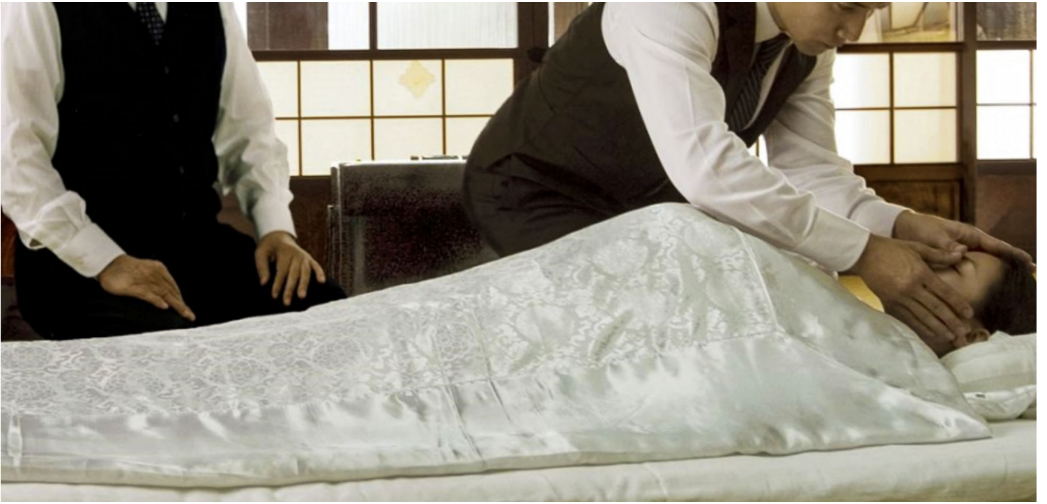
《送行者：礼仪师的乐章》剧照。