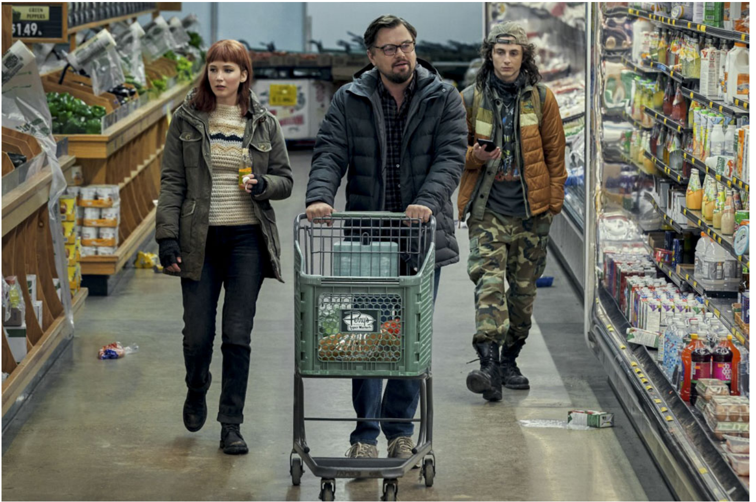
《千万别抬头》（Don't Look Up）电影剧照。网上图片