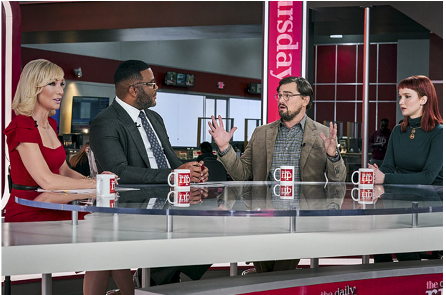
《千萬別抬頭》（Don't Look Up）電影劇照。

中心，給其他疫情進程滯後的地方提供了應對經驗；給予恐懼中的民眾心安的聲音，是來自福奇醫生這樣經歷了醫學界最精英機構培養和多年考驗的專業人士；國會中兩黨中間派在白宮完全喪失執政能力和誠意的情况下協商出了向民眾發放急需緊急救濟的方案：數款醫學史上最高效、安全，且研發速度創紀錄的疫苗更是政府和大醫藥企業間完美分工合作的成果。