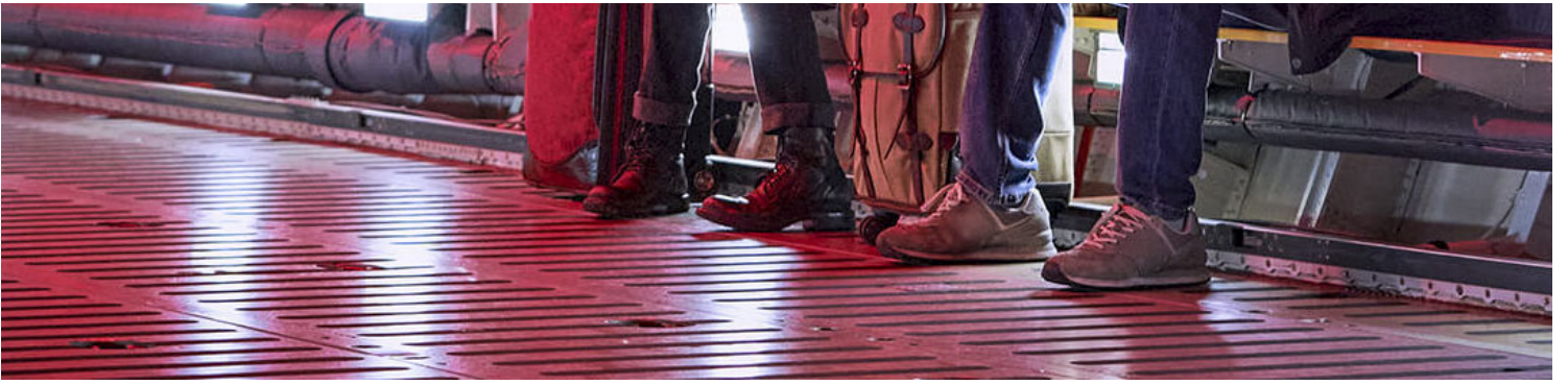
《千萬別抬頭》(Don't Look Up) 電影劇照。

且不說這種心態究竟有多強的正當性，它對實現創作者希望實現的目標顯然只能起到反作用：2016年大選已經讓我們看到，「雙方都一樣糟糕」的消息何以在俄羅斯假新聞機器和第三方候選人攪局者的共同推動下，讓美國史上最危險、對進步政策甚至民主制度最無敬意的人贏得白宮；在今天共和黨不僅在氣候、疫情等方面向反科學的方向一去不返，甚至已經不承認在對內和對外政策中有必要維護美國民主制度這一基本共識的情況下，11月份的中期選舉可以說是美國近年來最為重要的一次，而人們已經能看到相似的犬儒心態所帶來的危險：由於以民主黨對參議院的控制優勢過於微弱為主的自身無力控制的因素，拜登政府至今沒能成功推行許多選民所希望的如減免學貸、改革醫保、改革能源結構、針對警察暴力立法等更加大膽的進步主義政策，這讓其支持率在民主黨選民中也持續走低至不足半數，從社交媒體到左派政治人物也時有對拜登「溫和派執政者」定位不滿的表態，有些論調甚至危險地接近了類似「選哪一方都沒有區別」的聲音，而這種心態是可以輕易傳導至中期選舉民主黨選民積極性上的——去年維珍尼亞/維吉尼亞的州長選舉中，民主黨候選人輸掉了這個拜登領先超過十個百分點的州，如果類似結果在全國許多搖擺選取複製，那麼包括應對氣候危機在內許多重要政策議題的命運在今年11月以後將會是災難性的。因此，作為一部在熱心政治的群體中達到現象級、並希望以此推動實質性進步的電影，《千萬別抬頭》卻有意無意地為最危險、最應避免的情緒之一又加上了幾個砝碼。