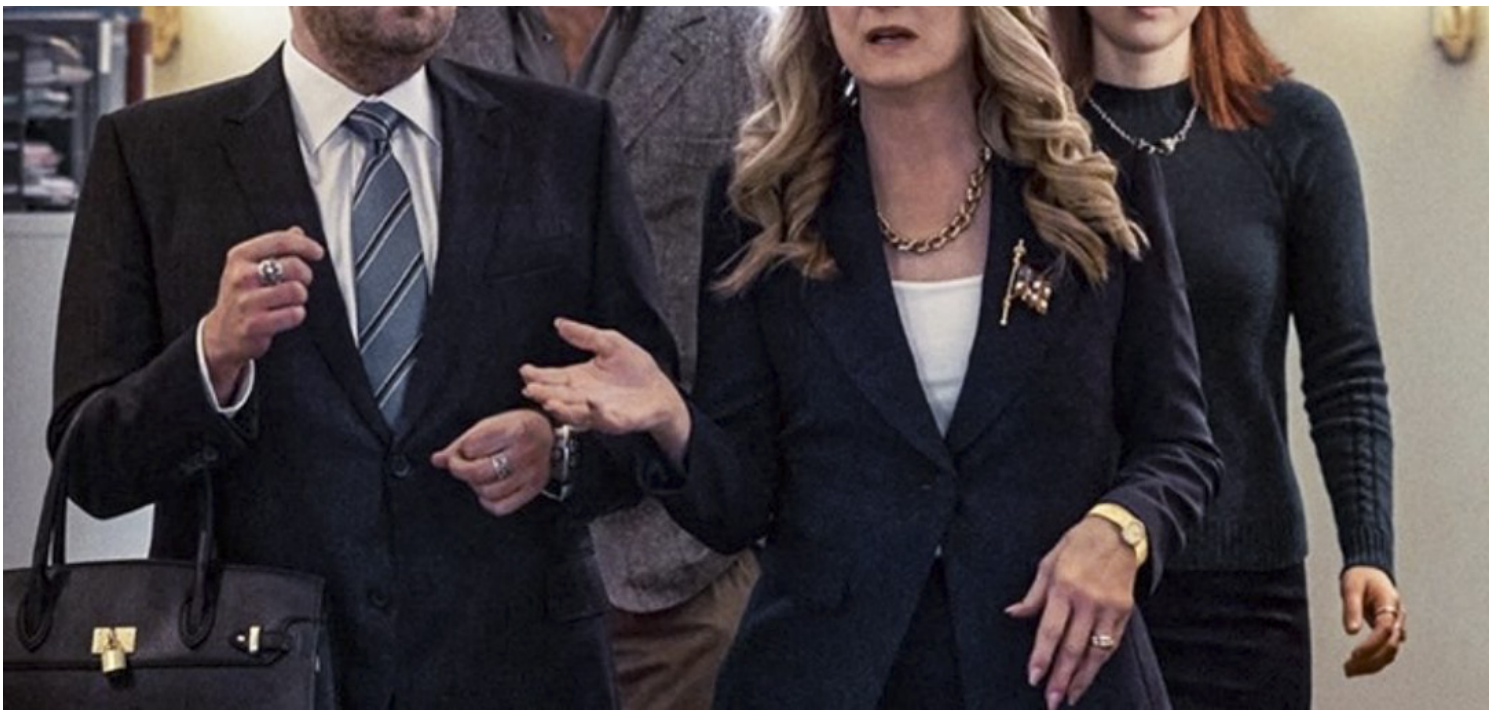
《千萬別抬頭》（Don't Look Up）電影劇照。