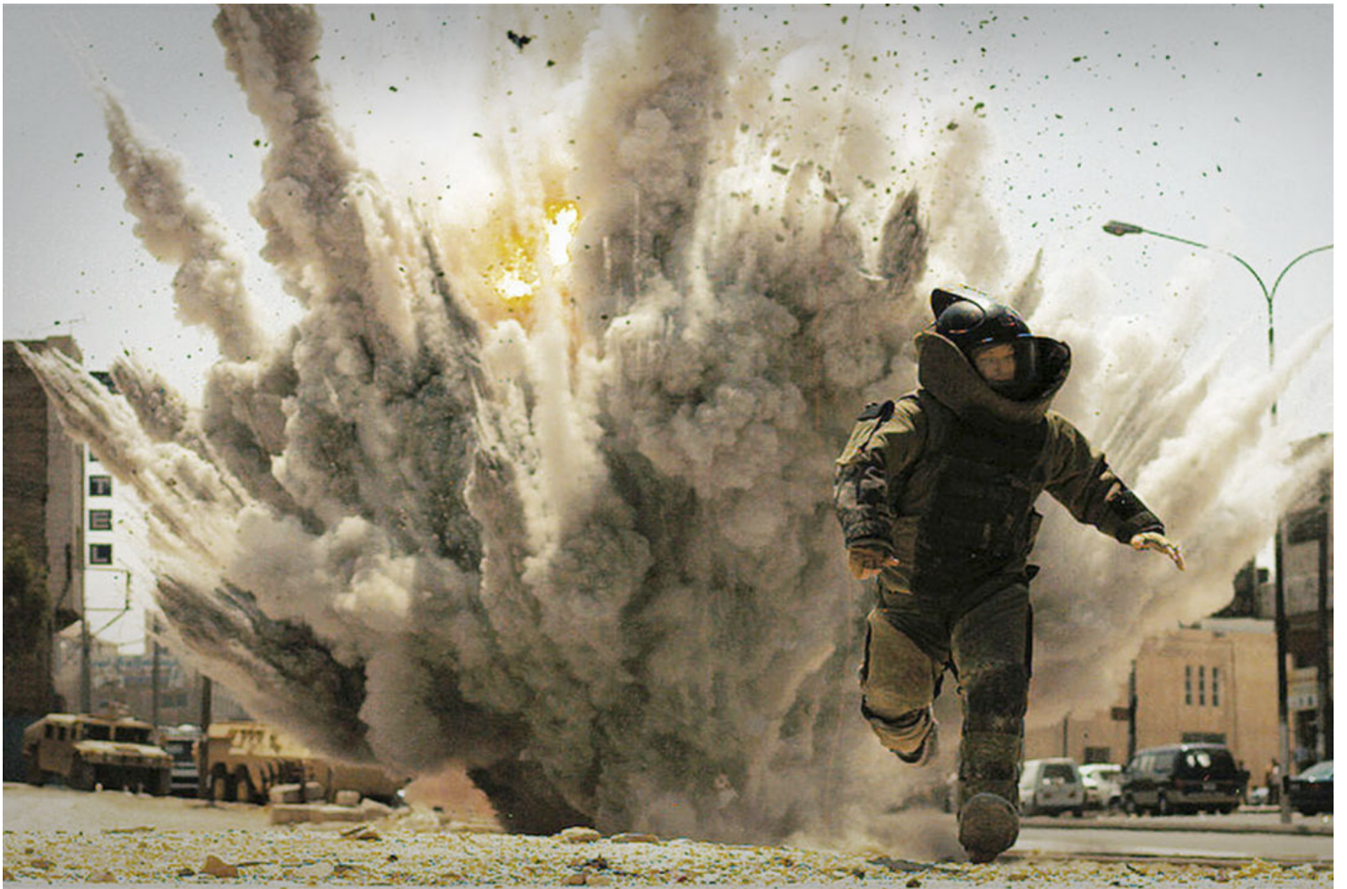
《危机倒数》（The Hurt Locker）电影剧照。网上图片