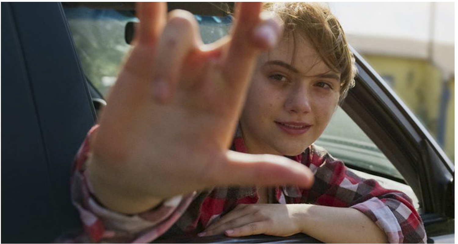
《乐动心旋律》（CODA）电影剧照。网上图片