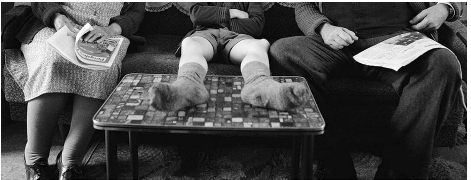
《贝尔法斯特》（Belfast）电影剧照。网上图片