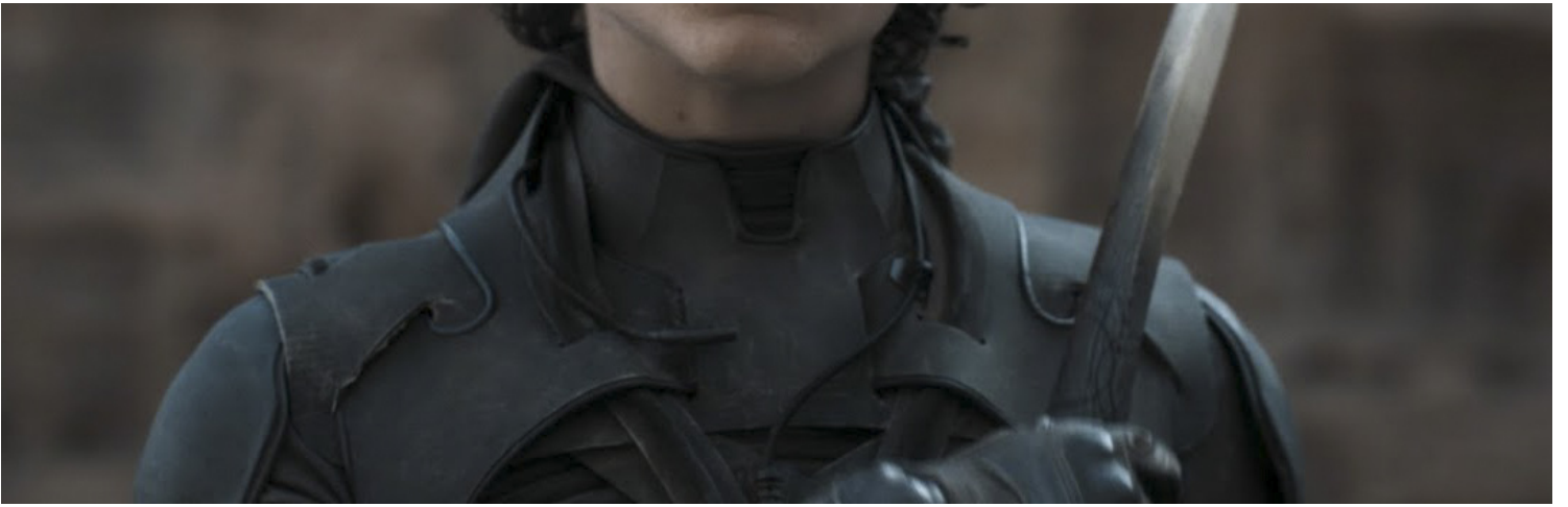
《沙丘》(Dune) 电影剧照。

《犬山记》表面上是普遍最被看好的大奖得主，不过奥斯卡多年下来为了力保电影院发行系统，坚决不让串流平台如Netflix发行的电影拿大奖。使得近年《罗马》、《爱尔兰人》(The Irishman, 2019)、《婚姻故事》(Marriage Story, 2019)、《芝加哥七人案：惊世审判 The Trial of the Chicago 7, 2020》、《曼克》(Mank, 2020) 等片都只差临门一脚。但疫情显然已经改变了世人的观影习惯，这是好莱坞再也无法回避的事实，以串流形式发行的《犬山记》或许不必再背负这般“原罪”。