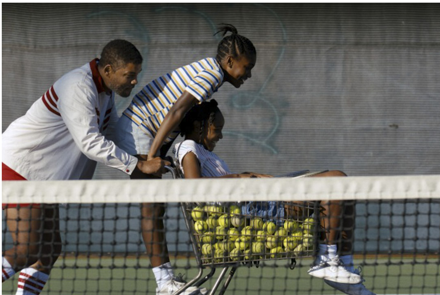
《王者理查》 (King Richard) 电影剧照。网上图片

今年奥斯卡最大悬念，恐怕还是在最佳女主角奖。分饰三位历史人物的洁西卡·雀丝坦 (Jessica Chastain)、妮可·基嫫 (Nicole Kidman)、克莉丝汀·史都华 (Kristen Stewart) 在各大风向球奖项各占胜场，谁封后都不会是意外，无疑是近年来最激烈的一次影后竞逐。