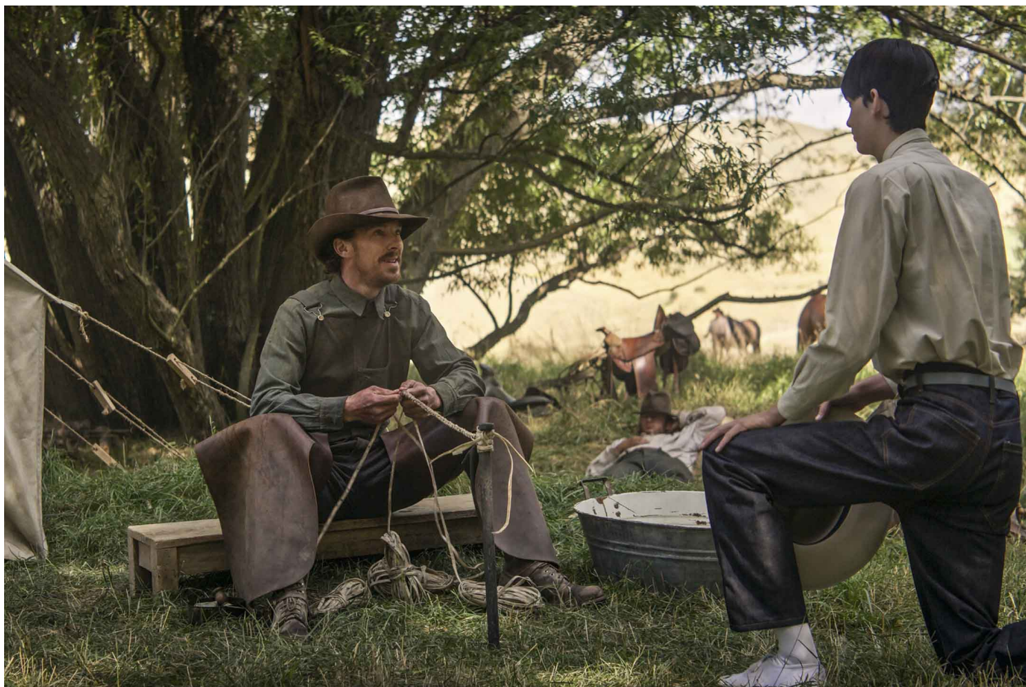
《犬山记》（The Power of the Dog）电影剧照。网上图片