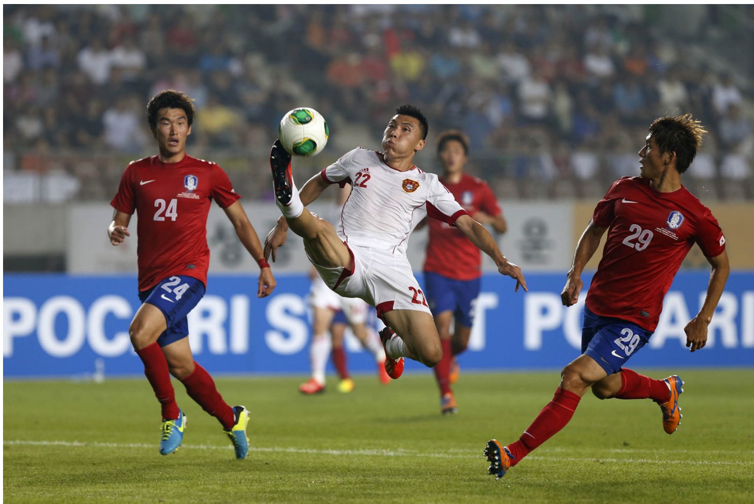
2013年7月24日，首尔举行的东亚杯足球锦标赛，中国队对韩国。