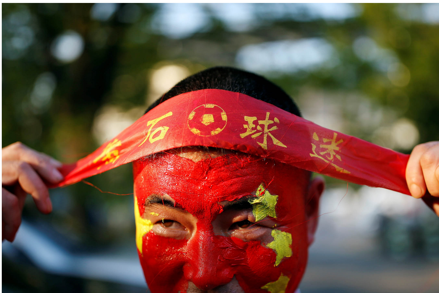
2016年1月9日，2018年世界杯足球外围赛，韩国对中国，一名中国球迷戴著头带。