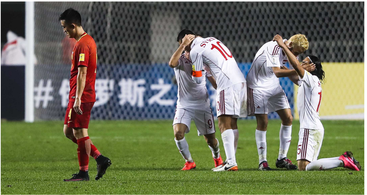
2016年10月6日中国西安，2018年世界杯预选赛，叙利亚球员在比赛后庆祝。