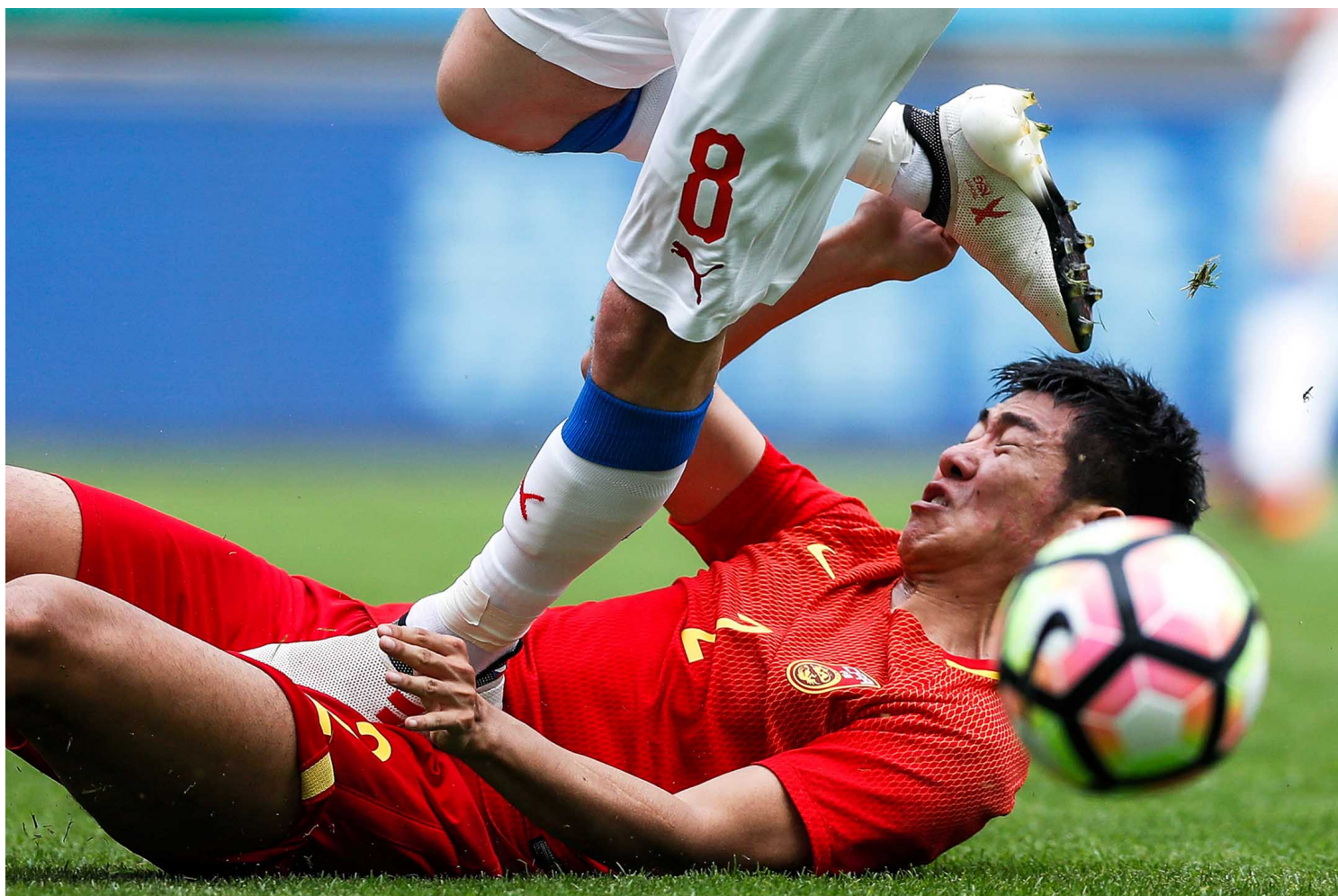
2018年3月26日，广西体育中心，中国对捷克的足球比赛。图：Stringer/Reuters/达志影像