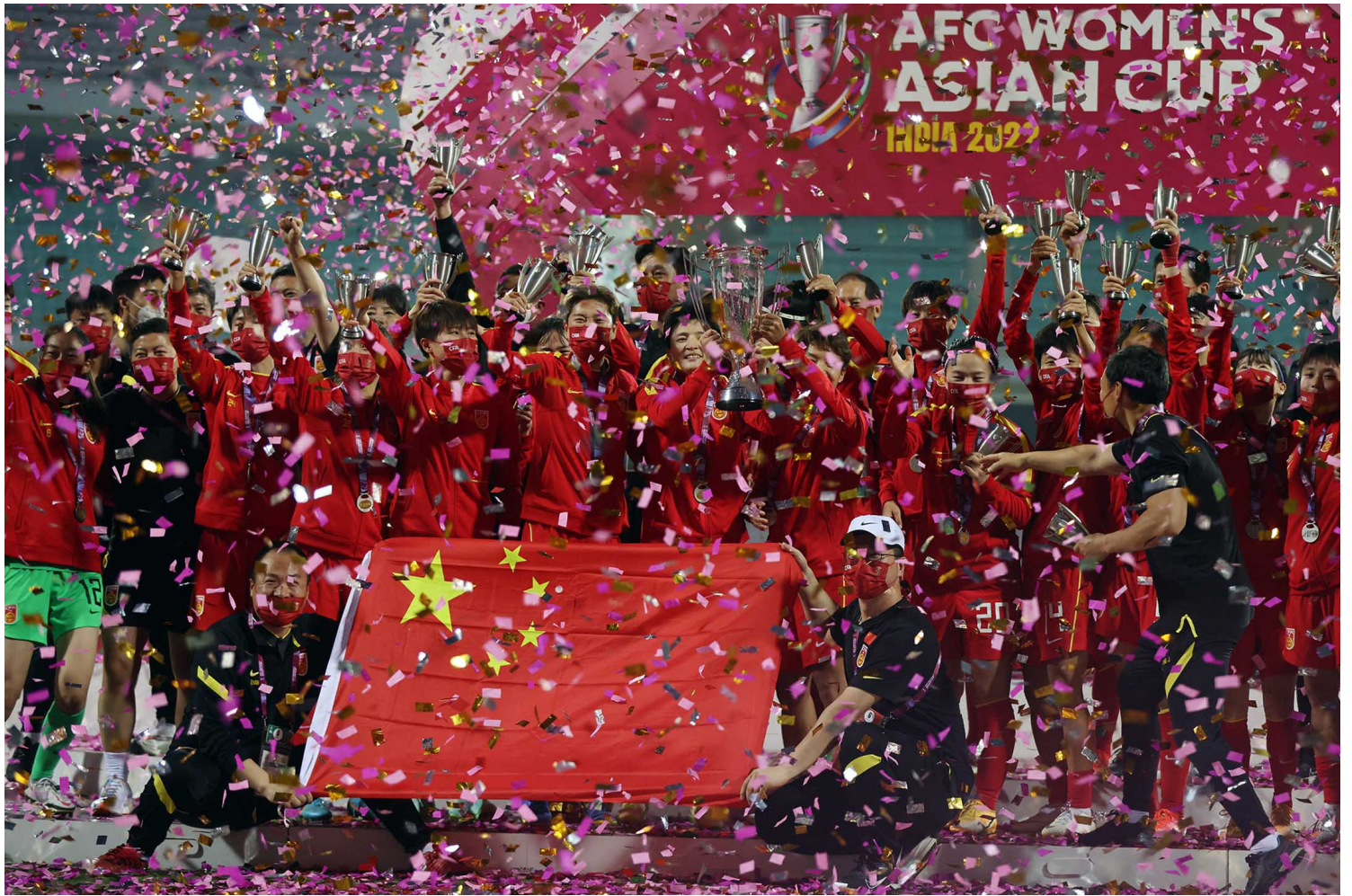
2022年2月6日，印度孟买，2022年女子亚洲杯决赛，中国队队员高举中国国旗庆祝获胜。