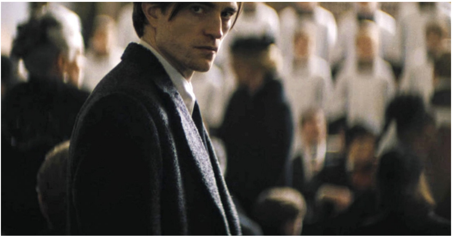
《蝙蝠侠》剧照。

这同样也是导演的良苦用心所在——戏里戏外都可被称之为新任蝙蝠侠，甚至被有些观众戏称为史上最穷蝙蝠侠（当然依然还是亿万富翁的设定没变），和观众的距离也是更加接近的。这里的接近并不是说像蜘蛛侠那样完全变成了一个邻家英雄，而是说在这一部里蝙蝠侠的状态和反应更像是一个普通人会有样子：会叛逆，会浮躁，遇到棘手的事情会寻求帮助，会努力保护自己想守护的东西，但同时也会被利用。而到了最后，蝙蝠侠也会审视自己的一切，进而成为更强大的存在。这样的处理削弱了蝙蝠侠作为超级英雄的神性，但也赋予了他此前大银幕中未曾展露的人性，让蝙蝠侠不再是一个单纯守护城市与罪恶对抗的符号，而是一个同样具有私心和缺点，并最终努力克服缺陷跨越障碍，进而拯救他人成为希望象征的有血有肉的人。