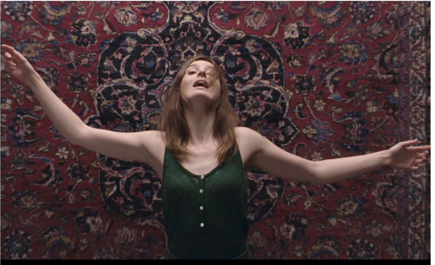
《世界上最烂的人》剧照。

所以《世界上最烂的人》在结尾加入了一个“剧组在戴口罩拍电影”的场景，作为该片拍摄于疫情之中的纪念。对尤沃金来说，疫情只是又一个时刻而已。“时间会过去，突然有一天，我们会不再需要口罩……”现实里很多不知不觉的转变，只有在电影里回看，才历历在目。