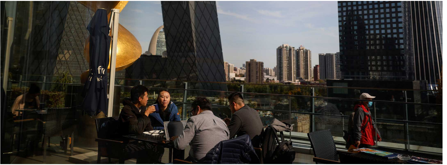
2020年10月27日北京，人们在中央电视台总部大楼附近的露台餐厅吃午餐。