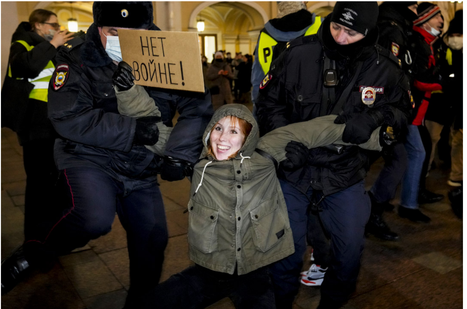
2022年2月24日，俄罗斯圣彼得堡，警察拘留了一名举著“禁止战争”反战标语的示威者。