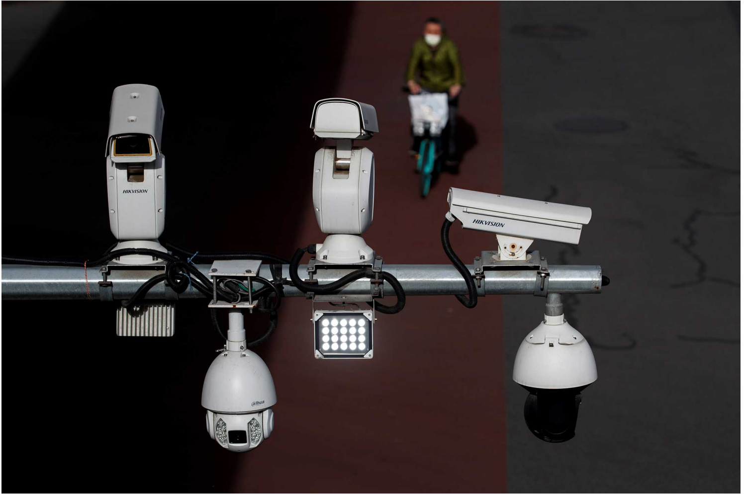
2020年5月11日北京，一名男子骑车经过时，闭路电视摄像镜头俯瞰街道。