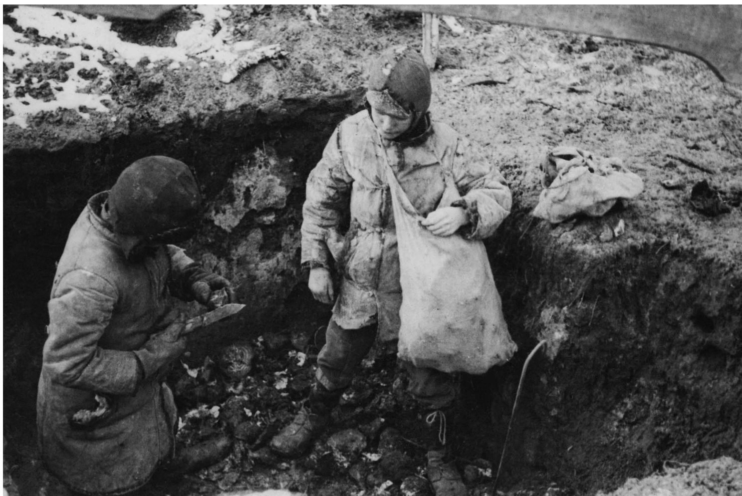
1934年春天，乌克兰大饥荒期间，两个男孩发现一堆土豆。

诚然，暴力镇压在我们这个时代，已经变得愈发罕见。如Steven Pinker所言，人类对于暴力的容忍程度自二战后就不断下降。乌克兰每一次爆炸和流血的画面，都会实时向全世界转播。赤裸裸的暴行触及了全人类的底线，因而才引发了整个国际社会的强烈反弹。