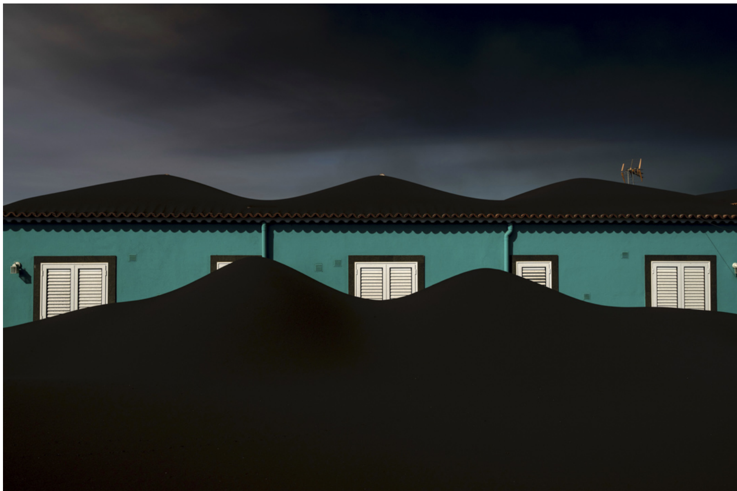
2021年11月1日，西班牙拉帕尔马岛（La Palma），火山爆发后灰烬把房屋掩盖。