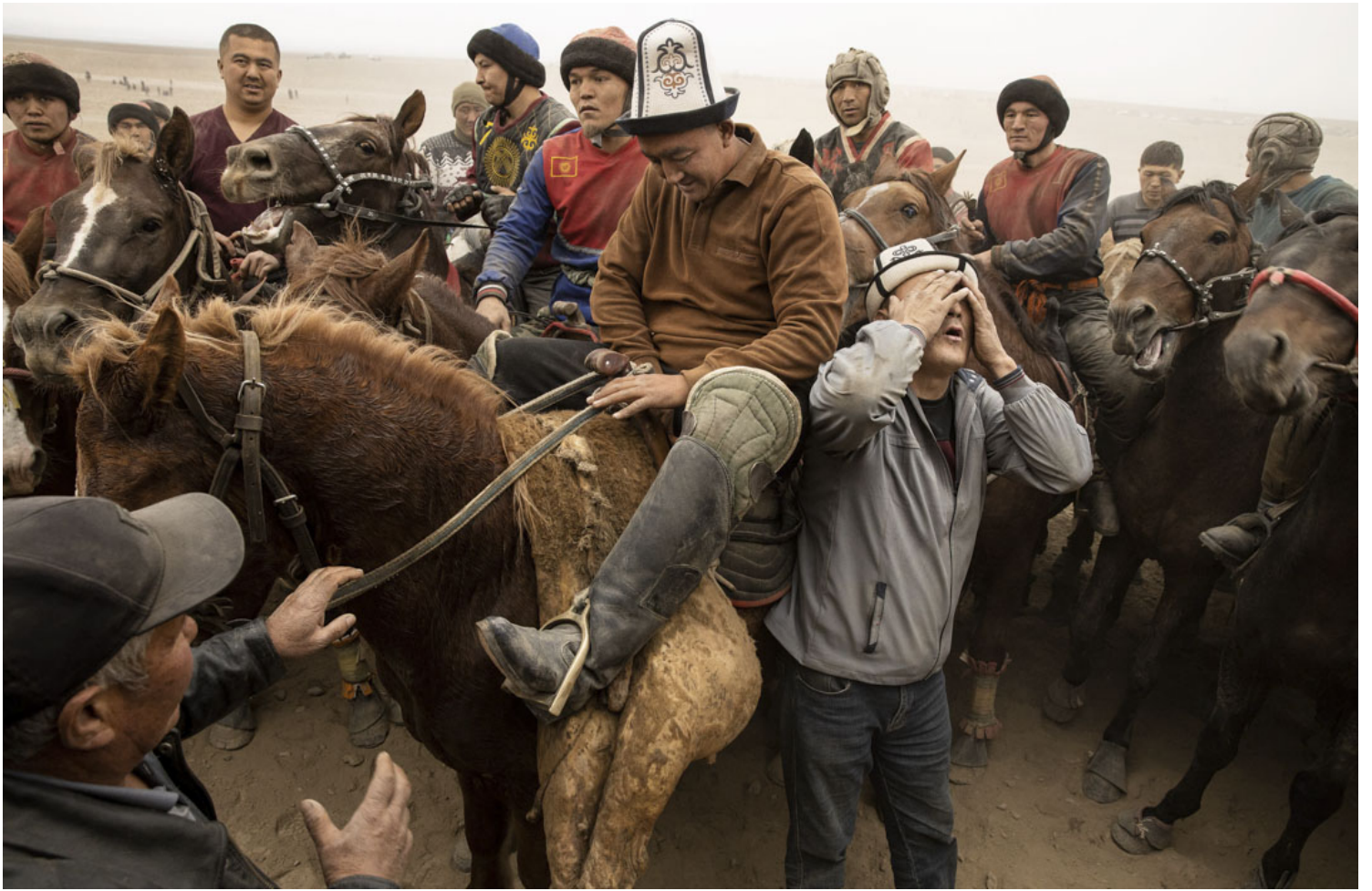
吉尔吉斯国民运动马背叼羊 (Kok boru)，比赛中参赛者争夺一头羊或小牛的尸体，这除了是大型的运动项目，也结合了传统习俗、表演、以及游戏本身的传统马上活动。