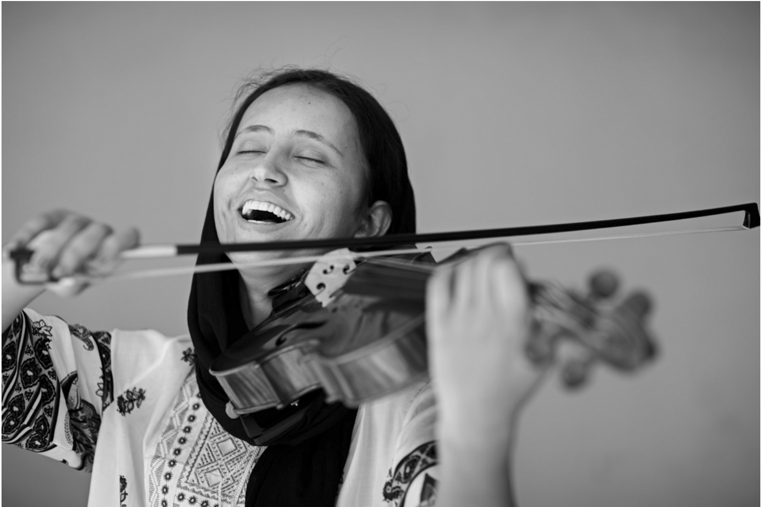
摄影师在塔利班入侵阿富汗首都喀布尔的约3个月之前，为该国首个全女管弦乐团 Zohra 的成员拍摄肖像。现在这间音乐学院已经人去楼空，再见不到教师和学生树影下练习音乐的画面，大部分Zohra成员被迫展开了逃亡生涯。