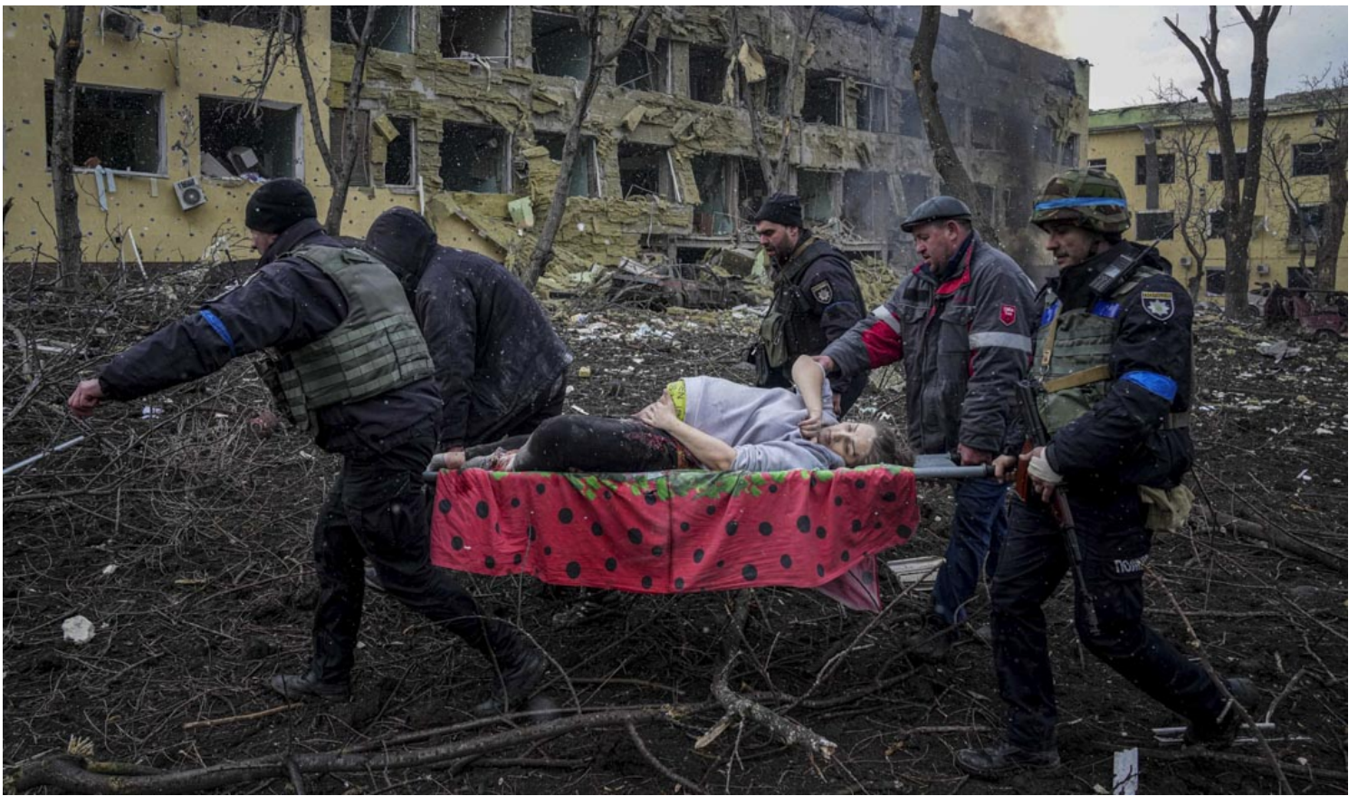
2022年3月9日，乌克兰南部城市马里乌波尔（Mariupol），俄军炮弹炸毁一座妇科医院，救援部队人员抬出一名受伤的孕妇。