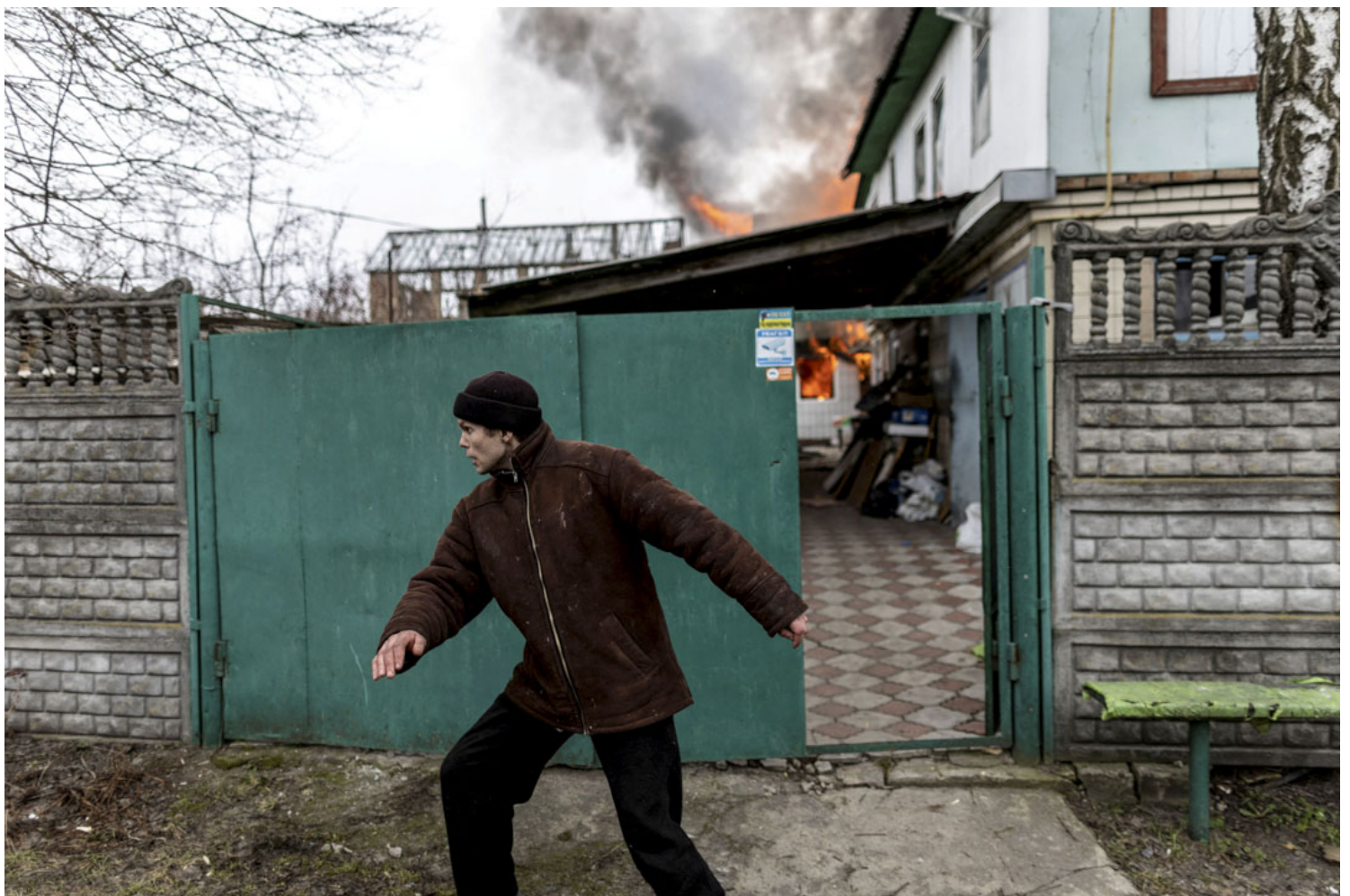
2022年3月6日，俄罗斯军队向距离乌克兰基辅 24 公里的首都推进时，一名当地居民在离开伊尔平镇的唯一逃生路线上遭到俄军猛烈炮击后，房子着火。

宁卉：这个问题大家可以读一下端上个礼拜发出来的一篇基辅的一个记者发出来的一篇手记。他其实在写那篇文章的时候还没有打仗，写到一半的时候战争已经开始了，所以大家如果看到那篇文章前半段会觉得他为什么还能这么平静去分析身边的人对战争的准备，但因为他那篇文章写的比战争要早一些，所以最近大家看那篇文章的前半部分能够感受得到为什么普通人对战争是否会到来、战争会在什么时候到来的那种情绪。因为文章是在战争前后两天写的，所以到后半部分很能够一下子体会到情绪的改变。另外一篇从现场发回的一些连线报道，可以看到很多普通人其实在过去的一段时间里面就已经非常有意识地去主动参加一些防卫训练。他不一定要成为民兵，也不一定要去拿到枪支，但他已经有非常有awareness，要去想怎么去保护自己的家园。我觉得这部分精神上的准备是很明显的。