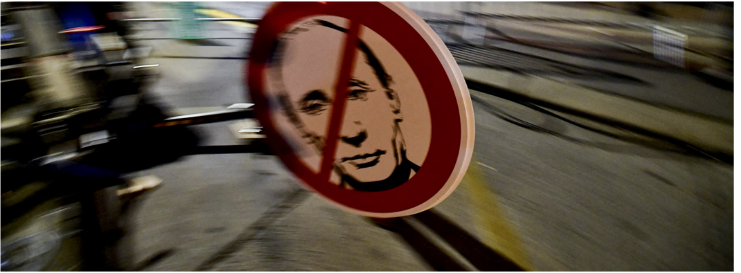
2022年3月1日，俄罗斯入侵乌克兰后，匈牙利布达佩斯的抗议活动，有人举著反普京示威牌。