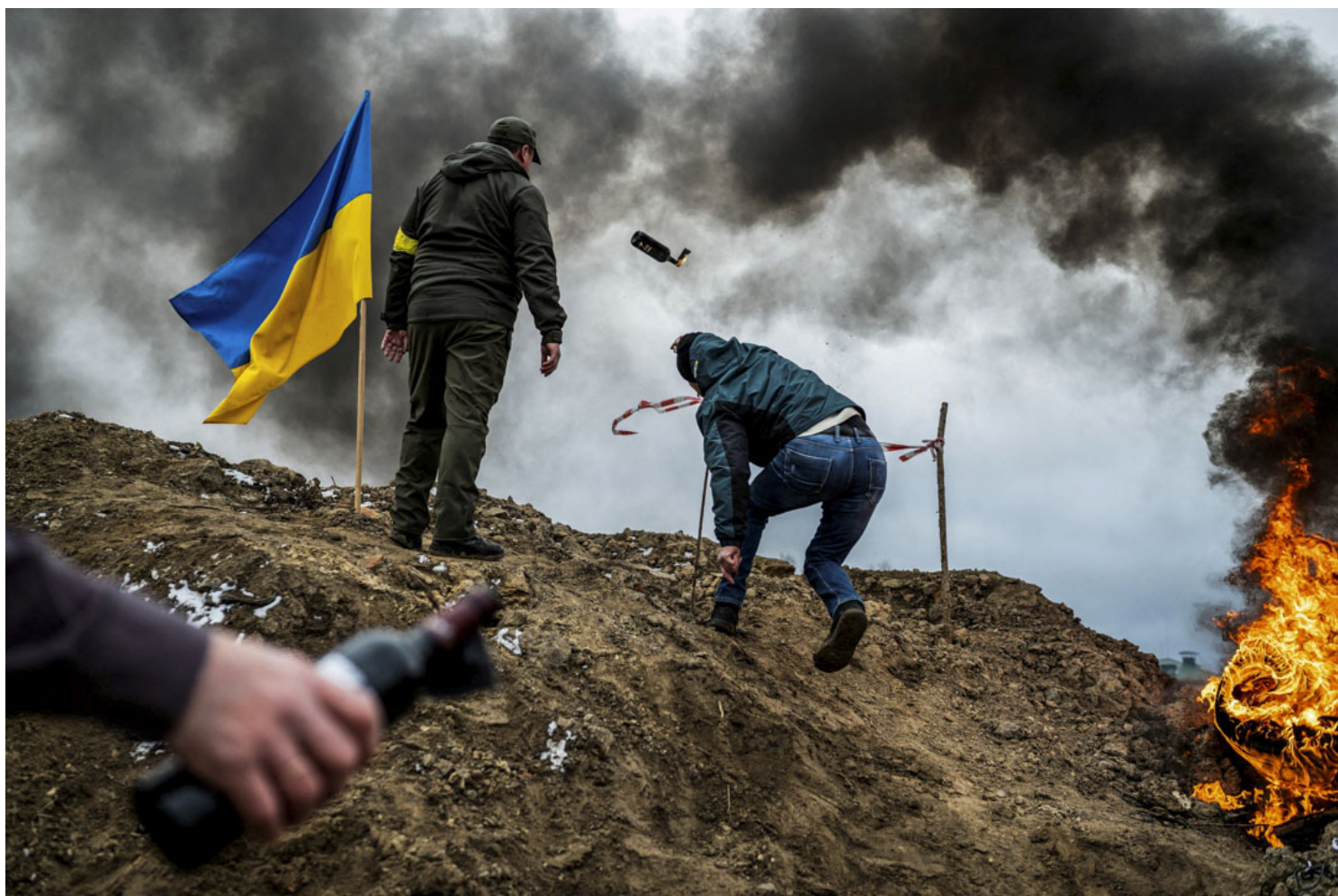
2022年3月1日，乌克兰日托米尔，随著俄罗斯继续入侵乌克兰，一名平民训练投掷燃烧弹来保卫这座城市。

蔚昀：我可以讲一下就是这8年来的准备。我并不想要只专注在乌克兰军队的准备上，当然军队的准备是很重要的，你都被拿走了克里米亚，东部顿涅茨克和卢甘斯克也被拿走了变成共和国。这些事情让我们看到，一个东西摆在那边的靠8年持续的话，总有一天会出问题的。我们今天也看到了，普京就是说，“噢这个是我们的，他已经独立了，我要进去保护我的人”，我觉得乌克兰的军队是有意识到这件事情的，这8年来一直在做准备。平民其实也有，虽然大家8年来也是过自己的生活，并不是一直全民皆兵，这个是没有办法过下去的。