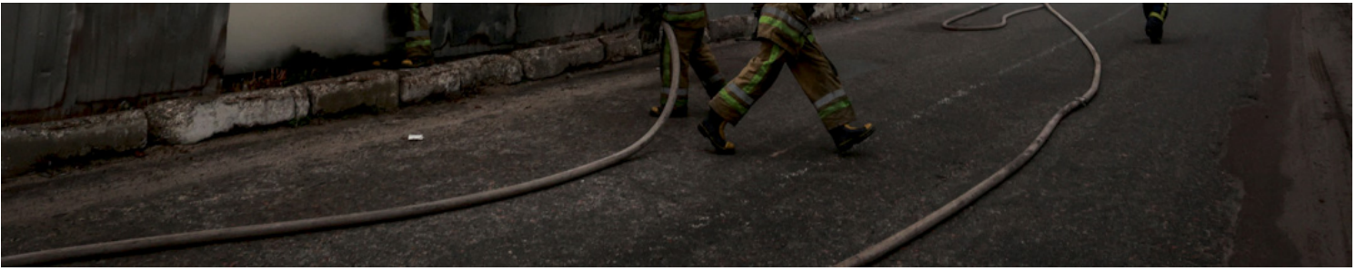
2022年3月3日，乌克兰基辅，消防员扑灭被俄军炮击后著火的仓库。

路尘：我觉得要分情况讨论，俄乌战争跟之前的很多局部战争是完全不一样的。在这个case上面，不可能选择中立，因为没有中立地区。之前我曾经在战争中保持过中立，2020年的时候有过一场亚美尼亚和阿塞拜疆之间的局部战争，很多人可能都没有听说过纳戈尔诺·卡拉巴赫地区，它是有一个持续了大概50天的小战争，那一次你的确会觉得没有办法站边，你只能选择中立，因为你实在不是两边任何一个民族主义所生发那个地方的人，所以你只能保持中立。但俄乌这一次我的确尝试了，但我找不到就是如何能够为普京现在的决策辩护，从哪个角度上去做。我看不出来它对哪一边是有好处的，哪怕是对普京自己。对他自己来说也是一个万劫不复的开始，所以这一场战争的确是找不到中立的点。