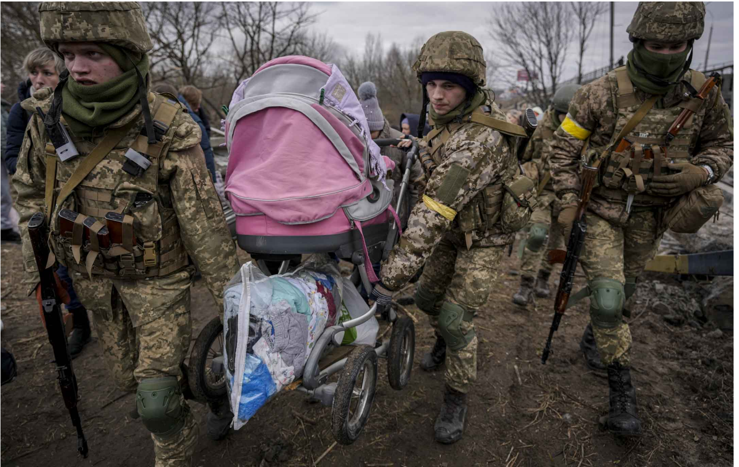
2022年3月5日，乌克兰军人在伊尔平镇一座被俄罗斯空袭摧毁的小路上，两名军人协助婴儿车搬离现场。