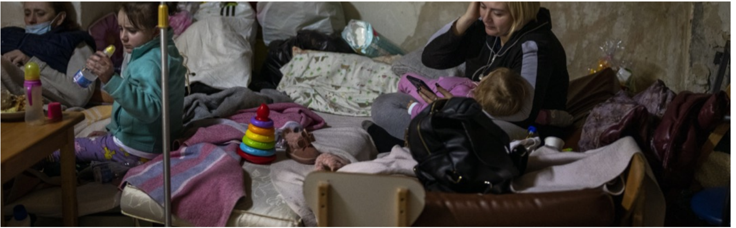
2022年3月1日，乌克兰首都基辅，一位母亲抱着孩子在一个临时防空洞内暂避战火。

我也曾经问过《向日葵的季节》的作者，这是一本关于乌克兰的报道文学，2017年在台湾出版。我觉得是很难得的一本报道文学，虽然他讲的不是当下的情况，但他讲述了Maidan过后乌克兰东部发生的战争。我们看这本书也可以看到今天的一些影子，或者说今天的情况是那时的一个延续。作者本身也很有趣，他妈妈是来自顿巴斯的俄罗斯人，因为他外公在二战之中被俘虏，所以后来找不到工作就只能到顿巴斯去；他爸爸是波兰人，所以他对乌克兰认知也不能这样用东/西简单划分，而要看每一个城市的不同。我有问他对于乌克兰东部西部以及认同的想法，他举了敖德萨（Odesa，乌克兰南部城市）为例，在西方人眼中这是公认亲俄的城市，但这个城市其实有自己的认同，里面有犹太人、穆斯林，还有来自二十几个国家的人在做生意，大家都和平共处。