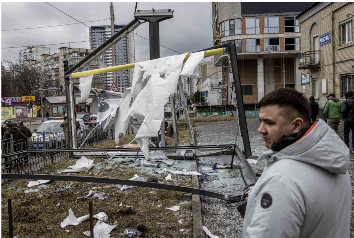
2022年2月24日，乌克兰首都基辅，俄罗斯发射飞弹击中市内建筑，市民在旁围观。