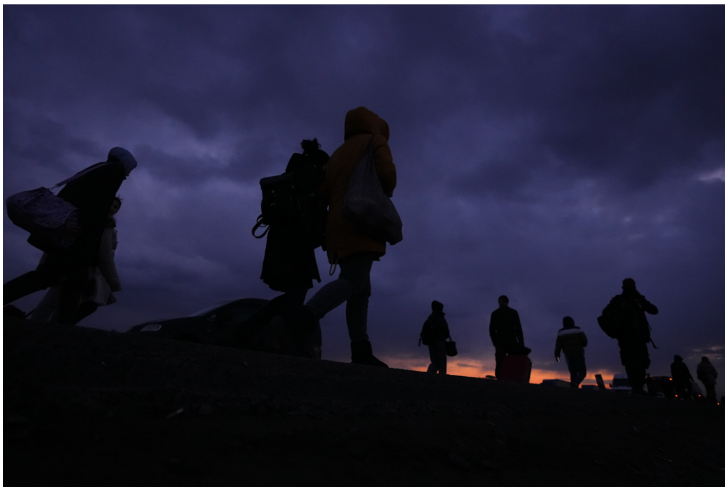
2022年2月26日，逃离乌克兰的难民抵达波兰普热梅希尔（Przemysl）。

雨欣： 关于中国对乌克兰战争态度风向的转变，我们前两天有一篇相关的评论文章，因为中国在联大的特别会议上投的是弃权票而非否决票，这个投票其实是蛮可琢磨的，显示出一种摇摆不定、稍有犹豫的立场。这可能可以从中imply到的一点是之前中国对俄罗斯的态度还是非常坚定和信任的，但后来慢慢发现自己“被耍了”。我们之前的评论文章就谈及了这个脆弱的中俄联盟，感兴趣的朋友可以去查看那篇文章。