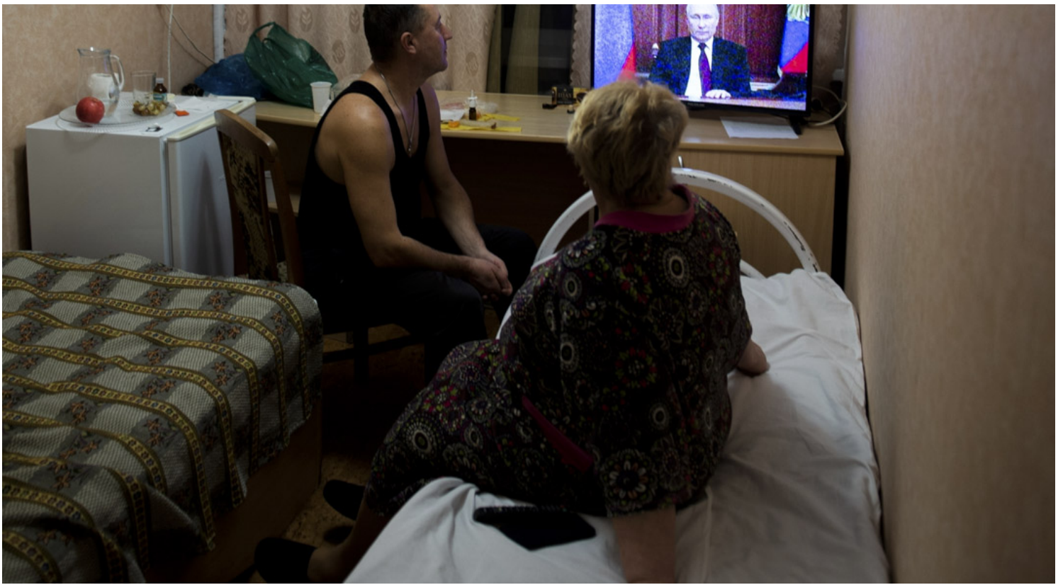
2022年2月21日，乌克兰东部的顿涅茨克和卢甘斯克地区，人们在临时住所观看俄罗斯总统普京的讲话。