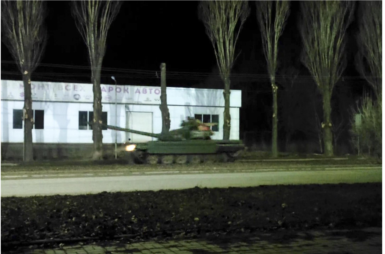
2022年2月23日，俄罗斯军用坦克在顿巴斯地区推进。

他的名字被印在纪念碑上，可兹的家人也。虽然他是乌克兰的作家，但是与一九二八年他移民波兰，波兰人都认为他是共同的作家。我也是在德罗霍贝奇（Drohobych，乌克兰西部城市）认识了一些乌克兰的朋友，其实之前在我以前居住的城市克拉科夫（Kraków，波兰城市）就认识到一些住在波兰的乌克兰人。8年前Maidan事件（独立广场革命）发生时，有很多乌克兰人在波兰发起一些抗争活动，那时候我有去参加，也有翻译一些当时乌克兰作家、诗人他们对于Maidan的看法与大家分享，所以我是从那个时候开始关注乌克兰的。