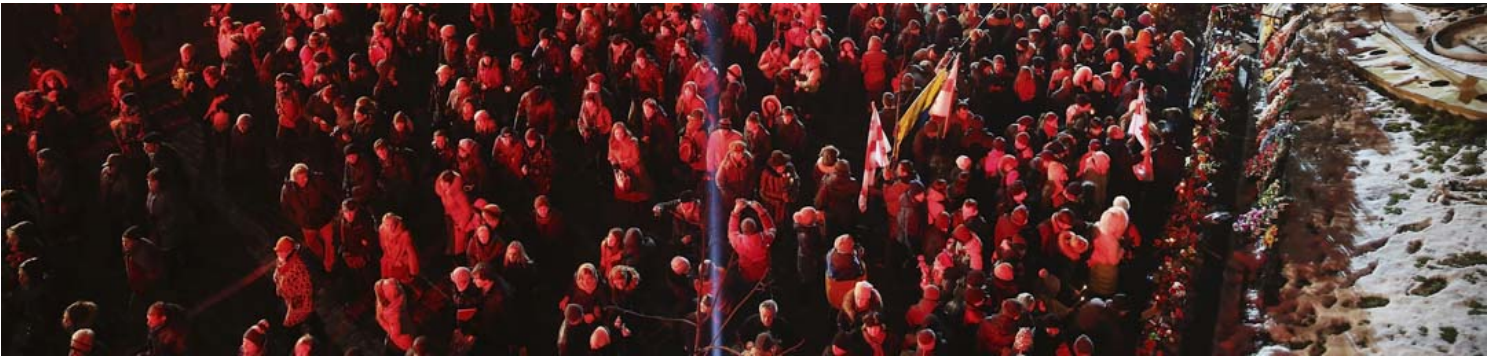
2015年2月20日，乌克兰基辅数千人抵达一年前在独立广场起义的遇难者纪念碑前献花和点燃蜡烛。纪念一年前死亡的反政府示威者，随后总统亚努科维奇下台。乌克兰其后引发克里米亚危机，亲乌克兰军队和亲俄份子在顿巴斯地区仍继续进行战事。

但是14年之后，他突然改变了这个策略，细看普京这几年的公开发言能找到一点点蛛丝马迹。去年12月底的时候，国情咨文里面普京有一段关于克里米亚的解释：“直到2014年3月之前，我都从来没有想过要对克里米亚做什么”，意思是他当时是“迫于无奈”，是因为当地发生了“人道主义灾难”，听起来很像现在对吧？当初用过的理由跟现在是一样的，“因为我们的同胞受到威胁，所以迫于无奈我采取了应急措施”。其实这句话也透露出，他用这样的历史观去解释现在的举动是不充足的。他目前剧烈的转向，不只是我自己觉得不习惯，我认识的俄罗斯人也都觉得很习惯。他们之前会认为这可能只是一些政治上的狠话，知道闹得很僵、很严重；甚至包括Maiden闹起来的时候，俄罗斯国内更害怕是下一个就是莫斯科，因为基辅的人们已经上街了，大家决定要推翻政府，而当时在俄罗斯国内这个担忧是非常强烈的，怕这种抗议会像阿拉伯之春一样从基辅开始直接卷到莫斯科。在这之后才有了关于“乌克兰不是一个主权国家”、“乌克兰不应该有一个作为主权国家的地位”，或是“乌克兰就不应该是一个民族”这些说法，在14年到15年的一年多时间里也曾经出现过。但跟这一次的效果一样，那一次他说完之后并没有产生更进一步的举动，仍然停留在口头。这一次突然之间变成了这样，我想全球可能仍在试图寻找里面的逻辑，但是目前能分享的是我们至少能看见现在的俄罗斯官媒是如何阐述这个事件，这个阐述也是目前为止俄罗斯普通人接触到的比较完整的事件版本，也就是刚才蔚昀说到她的朋友为什么会认为“乌克兰军队炮击了我们的幼儿园”，因为他们在2月中旬以后有一系列密集的报道，认为乌克兰在强攻顿涅茨克和卢甘斯克两个地区。那两个“人民共和国”恐怕是很难再坚持住，他们已经坚持了8年了，在这样两个小的、几乎没有行政上治理的地区撑了8年已经很神奇了。