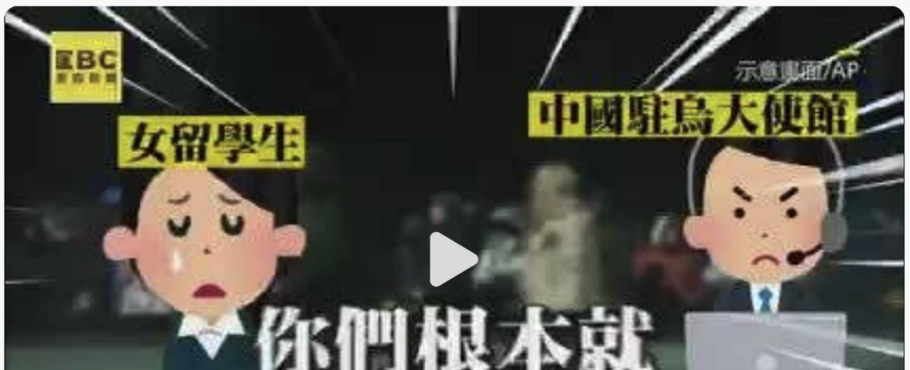
子午侠士将留学生求助录音遭台媒转发视频发布在微博。