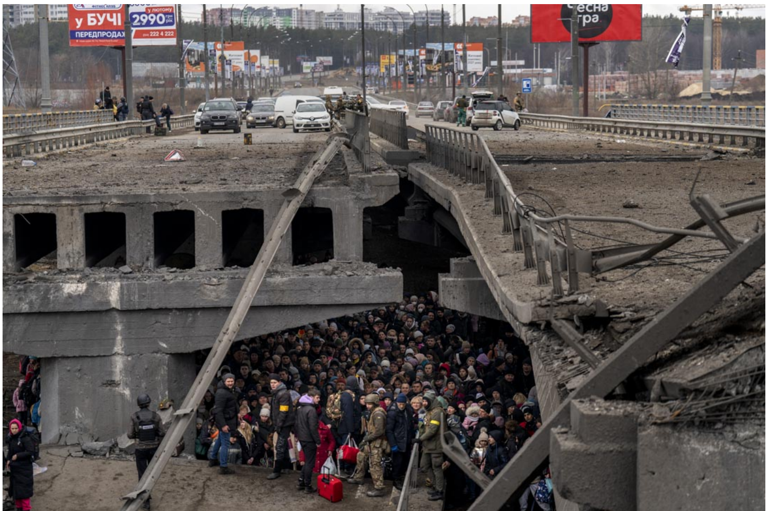
2022年3月5日，乌克兰人聚集在一座被毁坏的桥下，试图越过乌克兰基辅郊区的伊尔平河 (Irpin' River)。