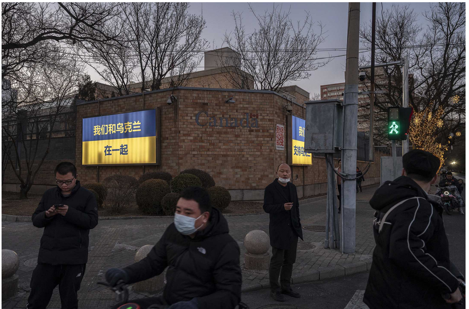
2022年3月1日中国北京，加拿大大使馆的外墙上可以看到“我们与乌克兰站在一起”的大型宣传牌。

有网民这样总结目前微博舆论场上的风向：“舆论战=要考虑大局=每个人都以身作则不可表达对国外其他城市的喜欢；在乌留学生发录音崩溃=给境外势力递刀子。”仍被困在乌克兰的留学生，甚至无奈地表示“如果不到万不得已，我是不会上来wb（微博）求助的唉……”