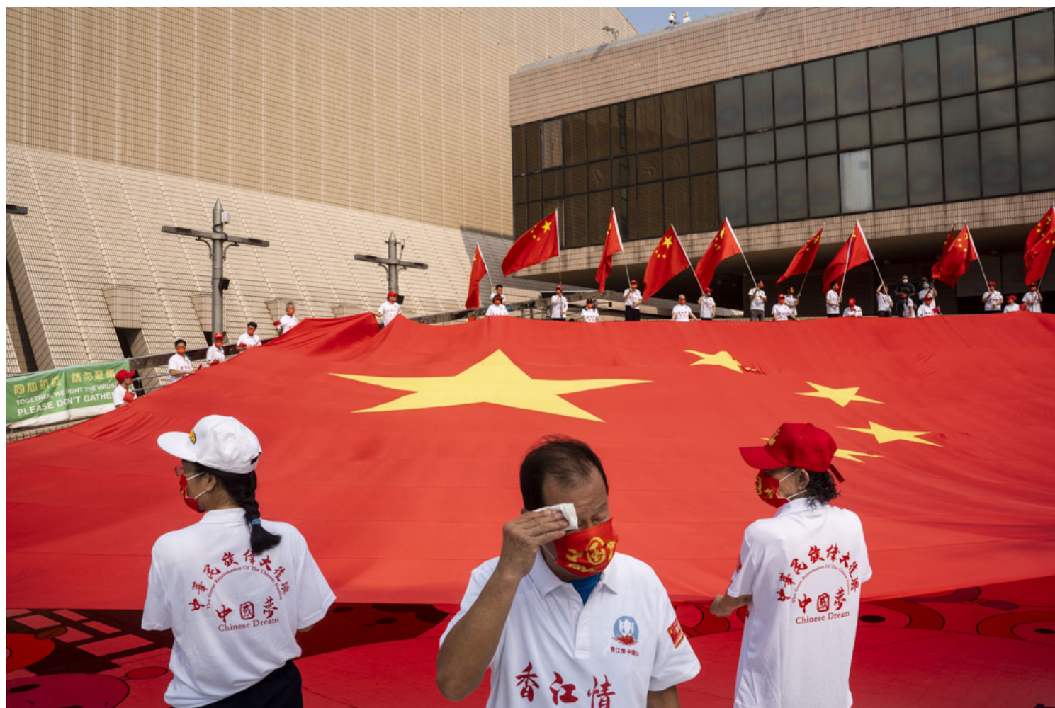
2021年10月1日，香港尖沙咀有大型庆祝国庆的活动。

今年“两会”上，有全国人大代表建议将“打拐工作纳入政府考核”；一位长期关注女性权益保护的全国人大代表也提出，建议提高拐卖妇女儿童罪收买者刑期，实现买卖同罪，提高震慑，同时对妇女拐卖情况进行普查普救，并建立后续综合救助机制。