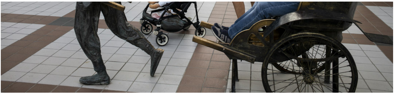
2021年6月2日，北京王府井，有爸爸带著婴儿逛街。