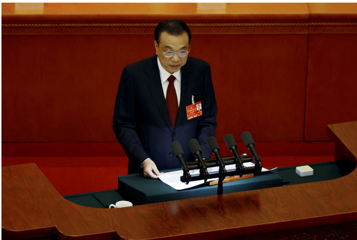
2022年3月5日，总理李克强在北京举行的全国人大发表讲话。

除主要发展预期目标外，端传媒梳理发现，在持续两年高于3%的赤字率后，今年中国赤字拟安排2.8左右%，重回疫情前水平；“双减”方面，报告提出“继续做好义务教育阶段减负工作”，不过，见于去年报告的“规范校外培训”未再提及；春节期间引发中国舆论轰动的“徐州八孩母亲”事件也在此次报告有所回应，报告提出，“严厉打击拐卖妇女儿童犯罪行为，坚决保障妇女儿童合法权益。”