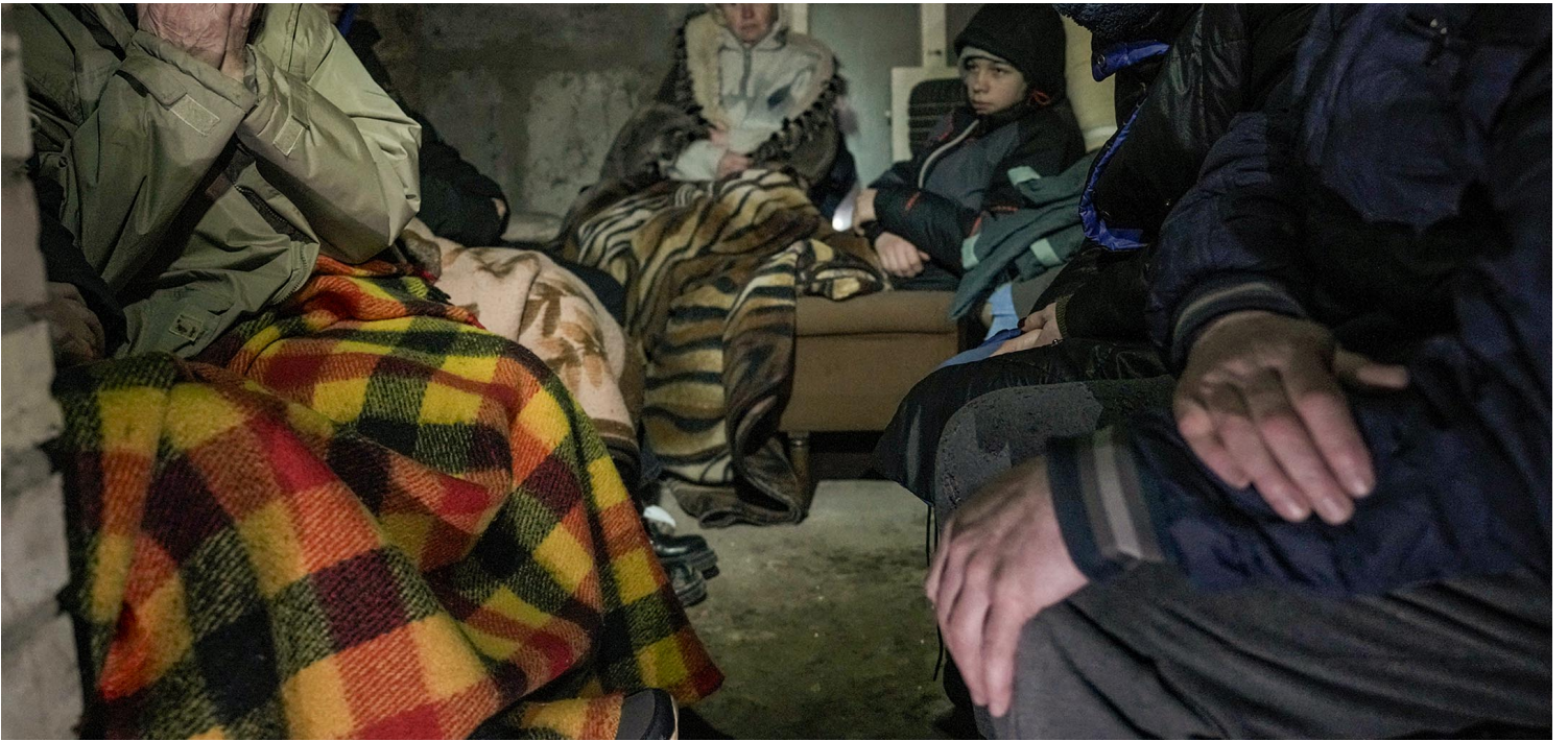
2022年3月2日，乌克兰首都基辅郊外，一所房子的小地下室里挤满了避难的人。