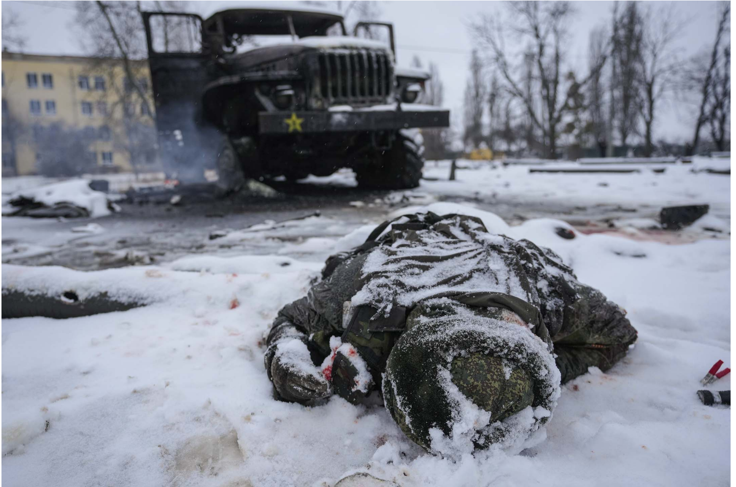
2022年2月25日，乌克兰哈尔科夫郊区，一辆被毁的俄罗斯军火箭发射车旁，一名军人的尸体被雪覆盖。

特 (Udo Voigt) 等人。就连中国的 《环球时报》 当时都指出，这次论坛被许多批评者称为“新纳粹论坛”。