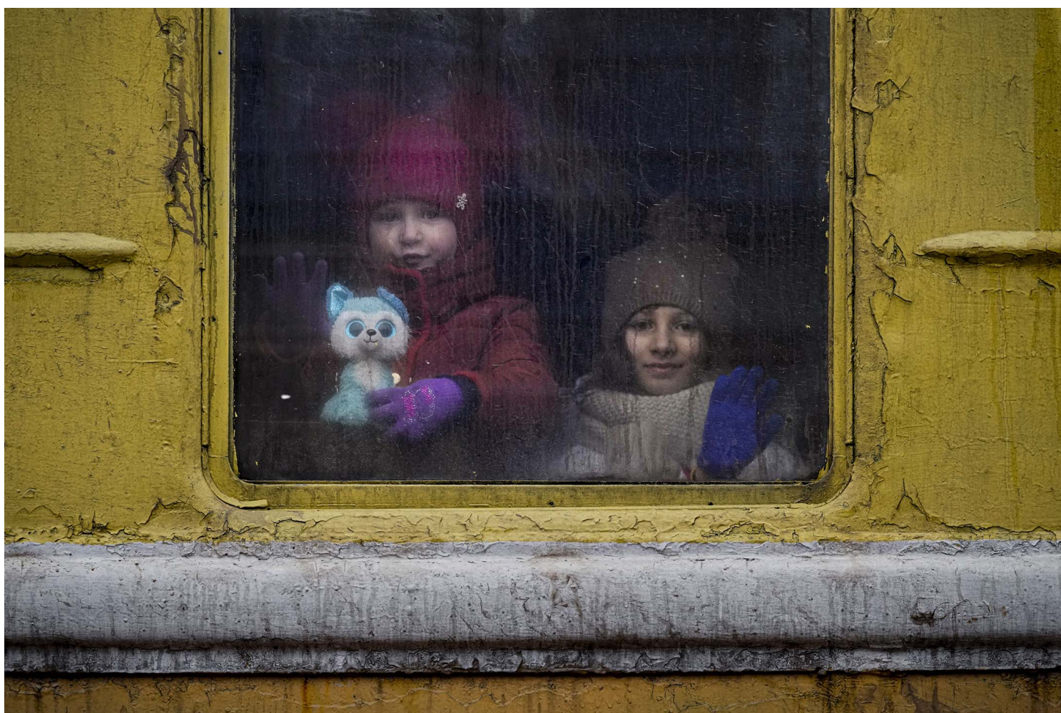
2022年3月3日，乌克兰基辅，逃亡中的孩子从一辆没有暖气的火车向窗外望。