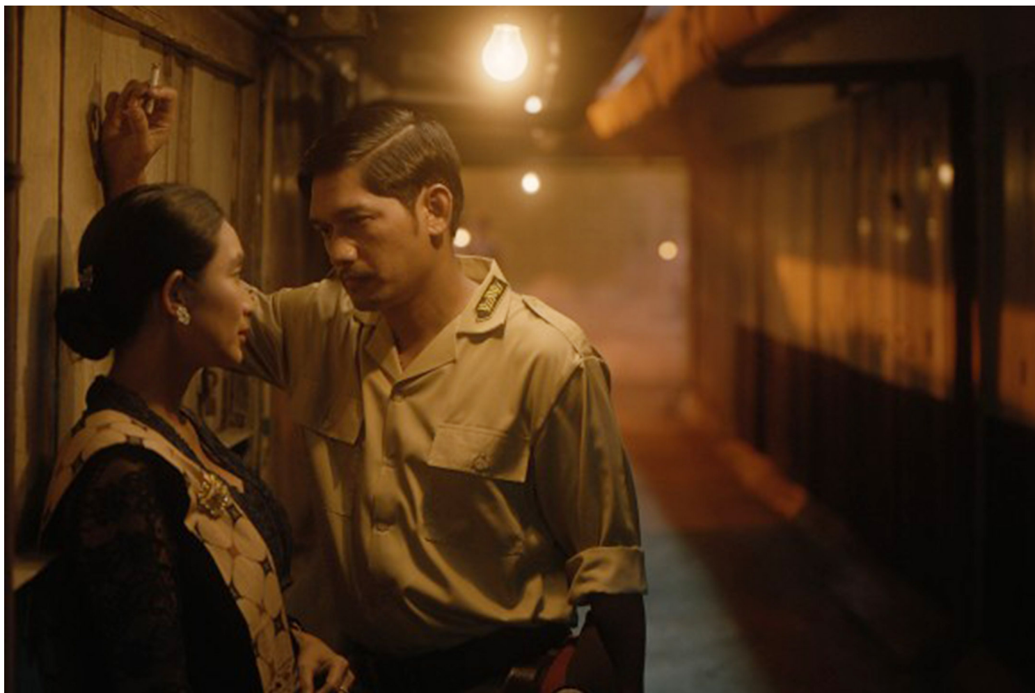
《Nana: Before, Now & Then》剧照。

电影散场后聚集聊天、交换影展“爆私”（festival buzz）的人群少了许多，因为全球疫情仍紧张，旅行移动的成本与风险仍高，各国防疫措施不一，使得影展现场少了许多来自亚洲、北美、中南美洲、非洲等非欧盟国家的电影人与观众。相较于往年能吸引近50万人次的柏林影展，今年实体参展人次约只有平均值的一半，但在影展规模缩小、严密的防疫措施中仍能有此成绩，亦可见观众对回到电影院观影的渴望。