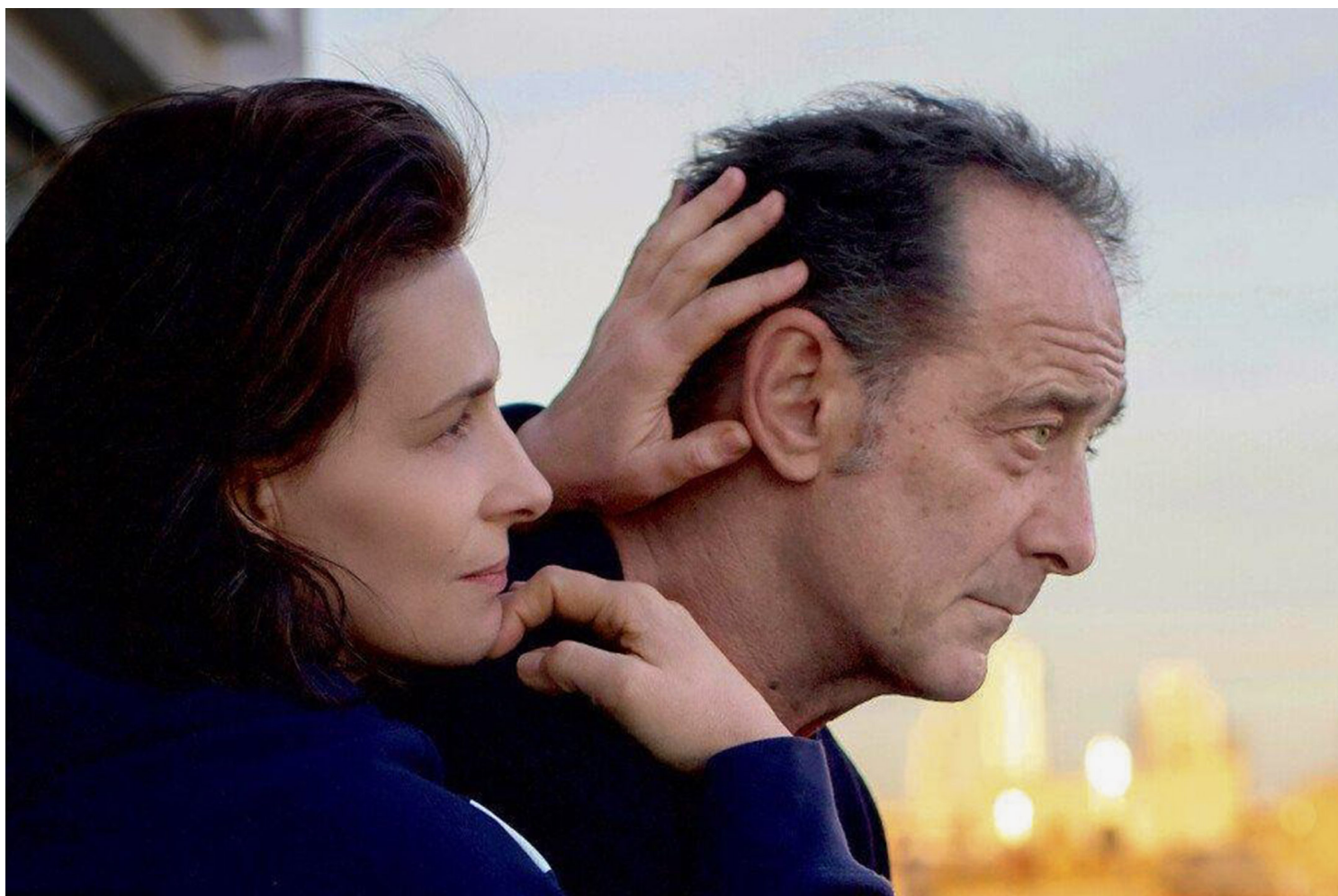
《Both Sides of the Blade》剧照。

在此，电影不再是个人美学的展现，而是作为集体的、汇聚微薄之力向外界发声的防御武器，此刻，电影是他们唯一拥有的语言。