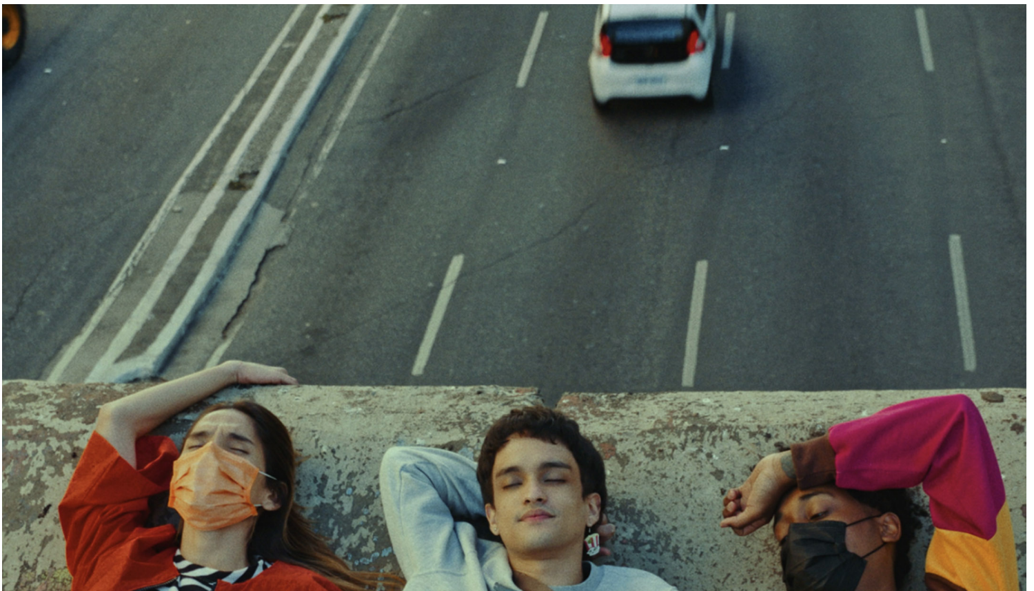
《Three Tidy Tigers Tied a Tie Tighter》剧照。